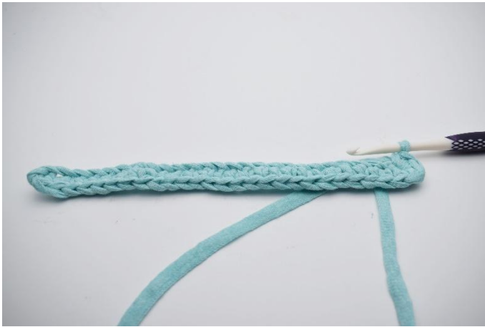
5. Faire 4 ms dans la dernière ml.