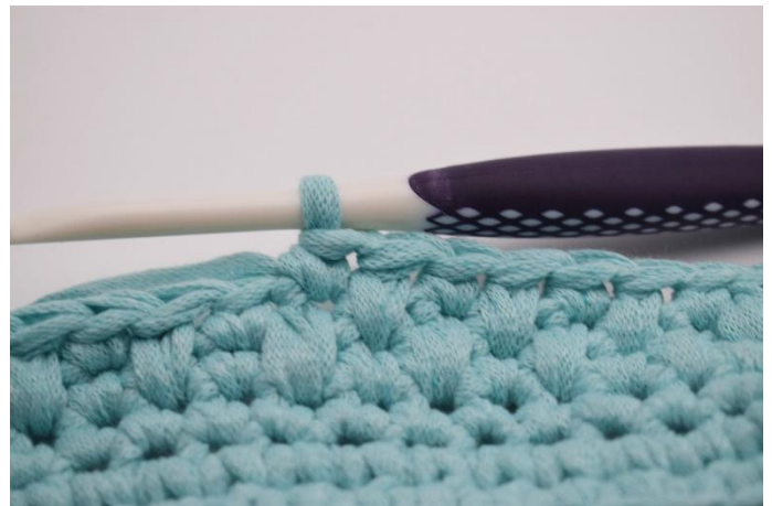
12. Répéter ceci tout le tour et finir ce 1er rang avec 1 lms.