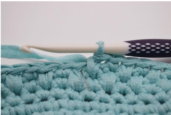
11. Faire 1 ms normale.