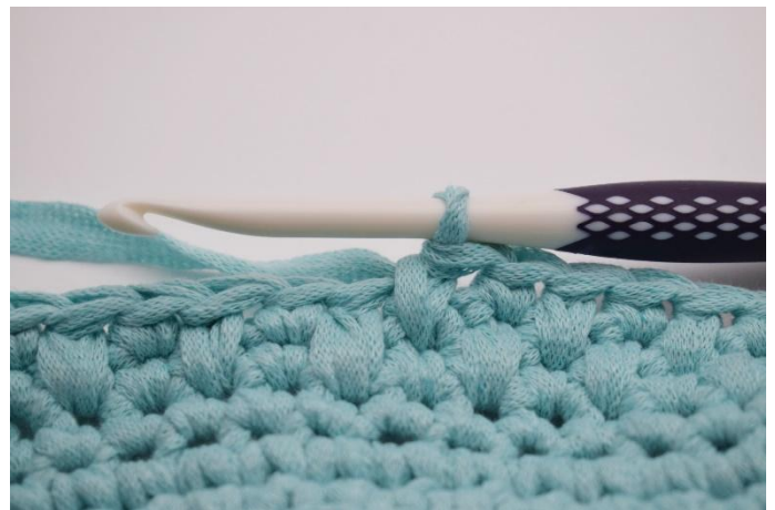
10. Comme ceci.