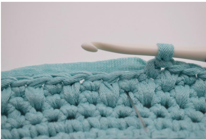
9. L'aiguille montre où faire la lms.