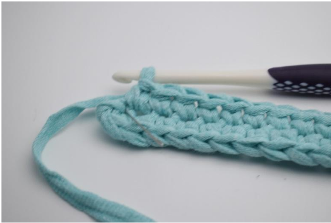
7. Dans la dernière m (marquée ici par l'aiguille)