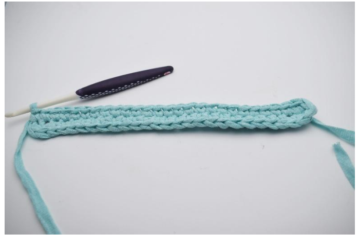
8. Faire 1 ms. (55)