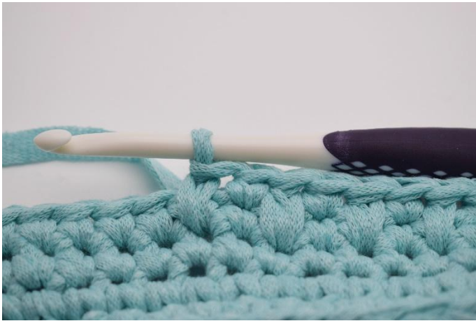
7. Répéter ceci tout le tour et finir ce 1er rang avec 1 ms.