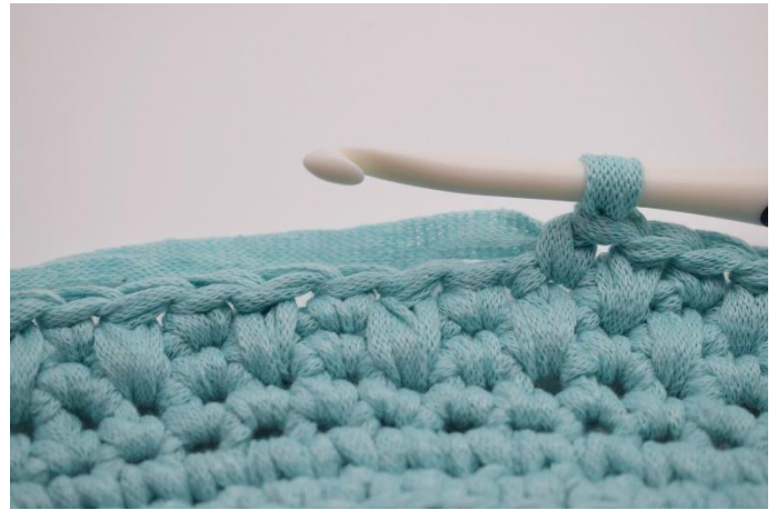
8. Pour le rang suivant, répéter "1 lms, 1 ms"