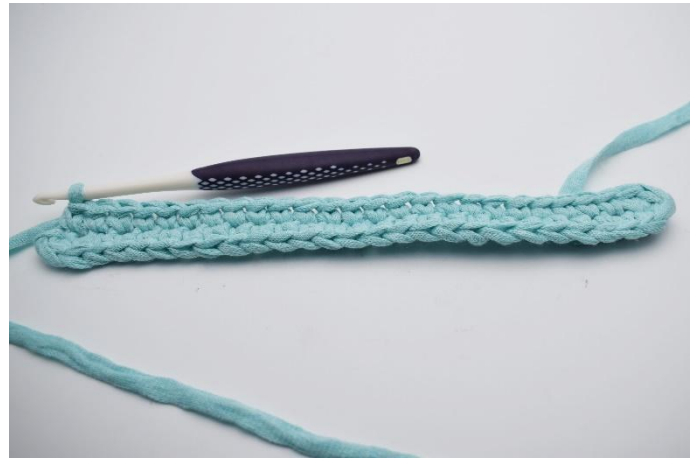
6. Maintenant crocheter de l'autre côté de la chaînette. Faire 1 ms dans chacune des 24 ml suivantes.