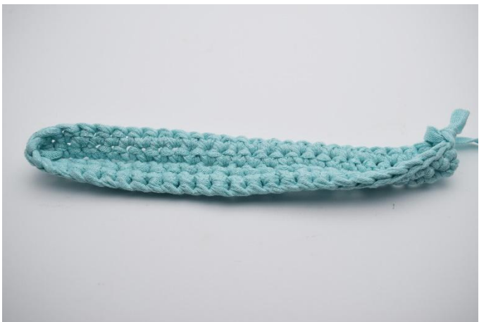
9. Crocheter 1 ms tout le tour.