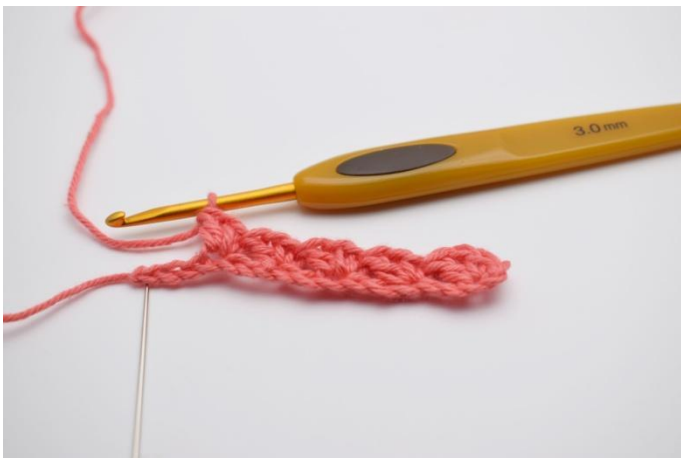
7. Répéter "sauter 2 ml, faire "1 ms, 1 ml, 1 br" dans la ml suivante" tout le rang jusqu'à ce qu'il reste 3 ml.