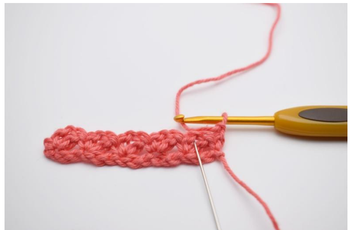
10. Maintenant travailler dans les espaces de ml du rang précédent.