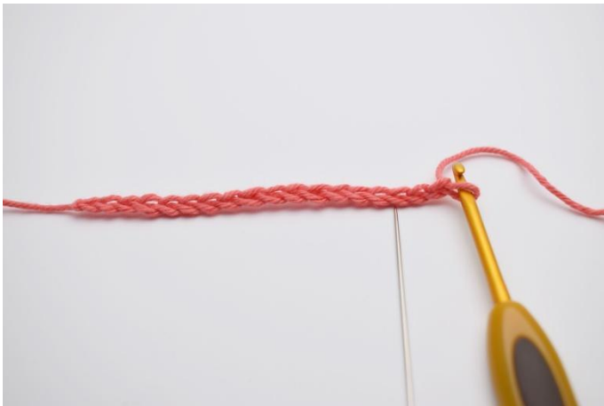
1. commencer par monter votre chaînette de fondation. La première m est faite dans la 3ème ml à partir du crochet.