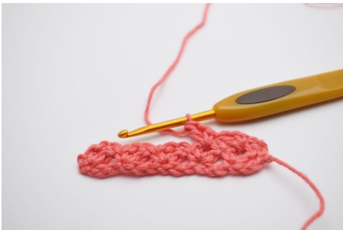
13. Faire "1 ms, 1 ml, 1 br" dans l'espace de ml suivant.