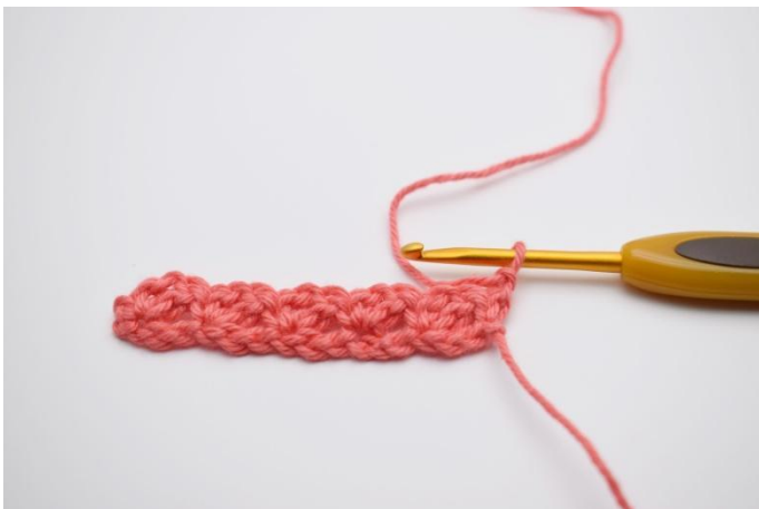
9. Tourner votre travail avec 1 ml.