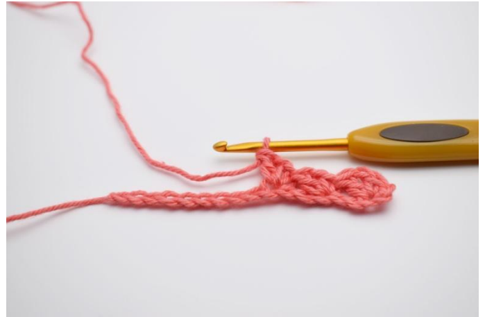
6. Faire "1 ms, 1 ml, 1 br" dans la m suivante.