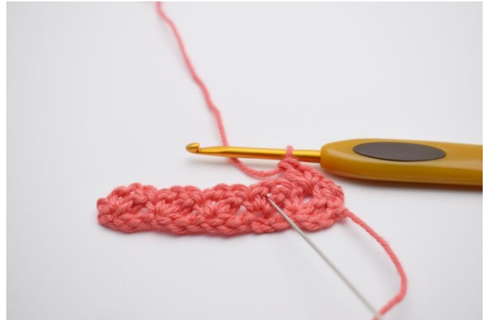
12. Sauter jusqu'à l'espace de ml suivant.