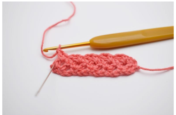
14. Répéter tout le rang.