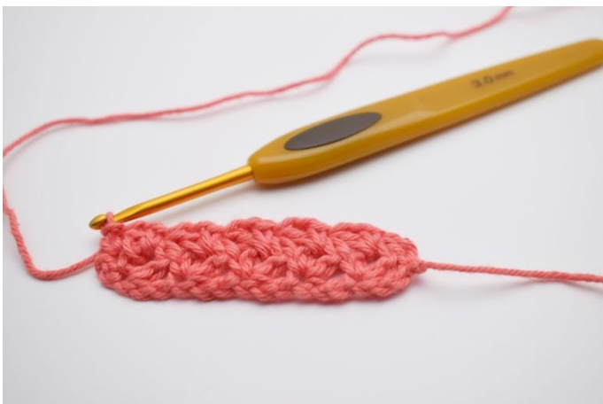
15. Dans la ml tournante faire 1 ms. Maintenant répéter ce rang jusqu'à avoir la taille désirée pour votre lavette.