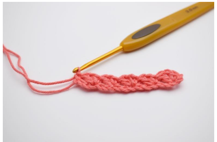
8. Dans la dernière ml, faire 1 ms.