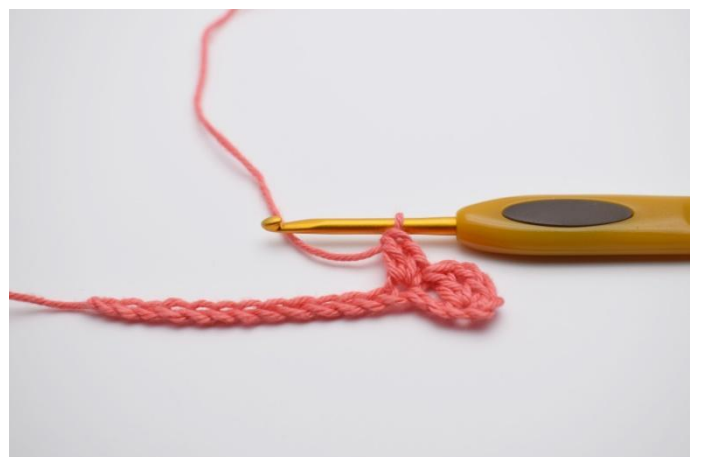
4. Faire "1 ms, 1 ml, 1 br" dans la m suivante.