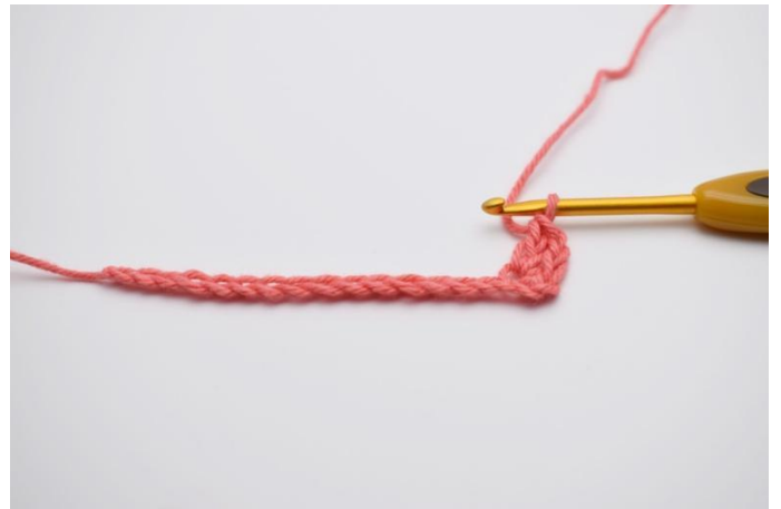
2. Faire "1 ms, 1 ml, 1 br" dans la 3ème ml à partir du crochet.