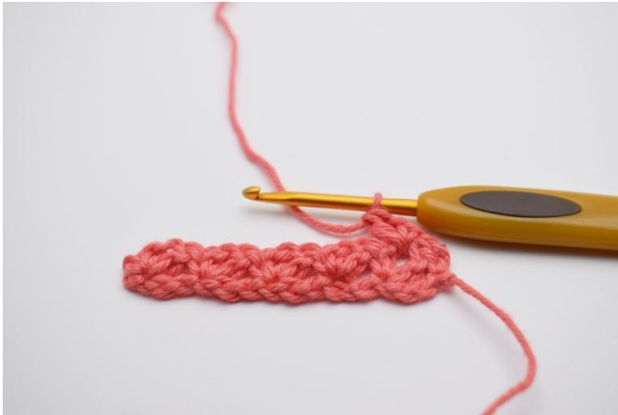
11. Faire "1 ms, 1 ml, 1 br" dans le premier espace de ml.