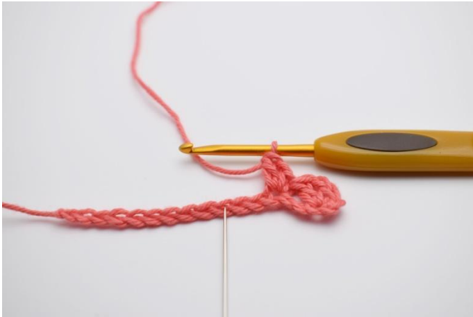
5. Sauter 2 ml.