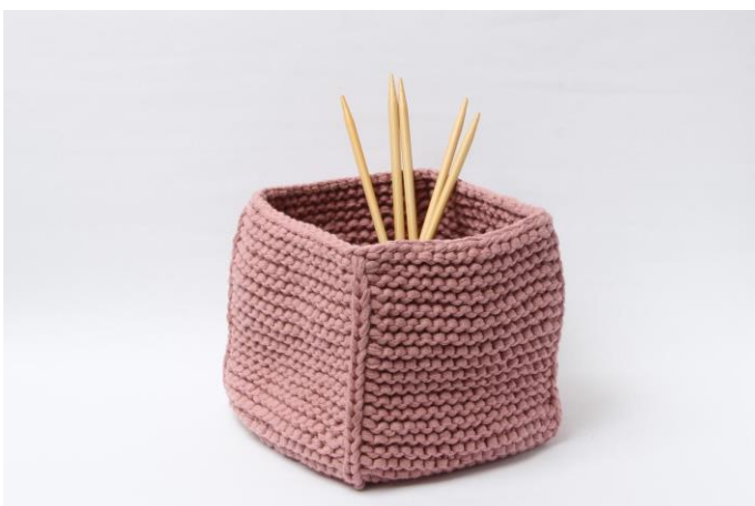
Panier sans bordure rabattue.

Tourner le côté endroit de votre travail vers l'extérieur et rabattre la bordure.