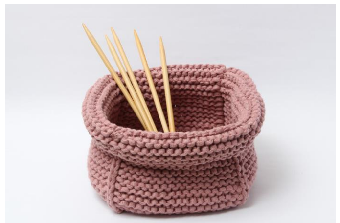
Panier avec bordure rabattue.