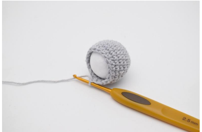
2. insérer la boule.