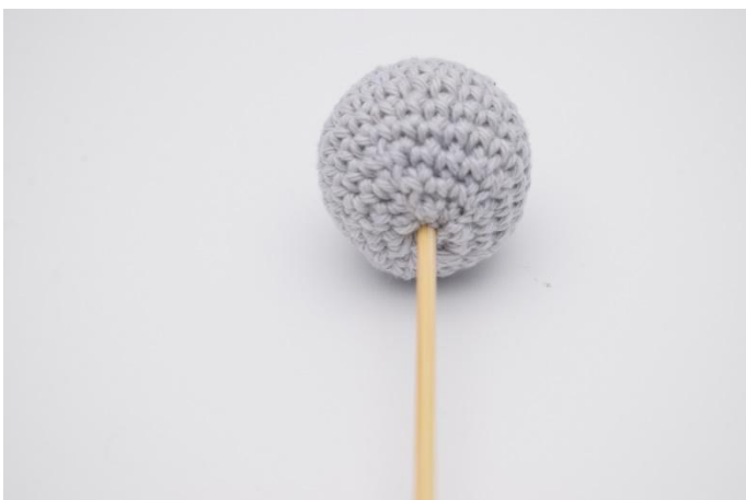
5. Piquer la tige dans la boule.