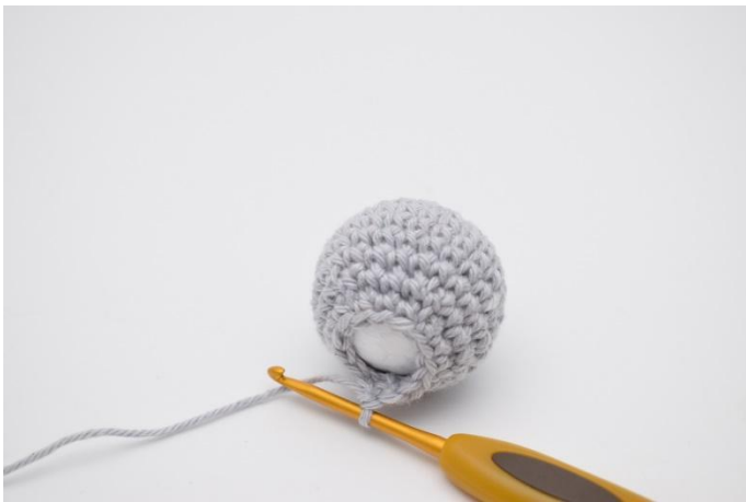
3. Crocheter à présent autour d'elle.