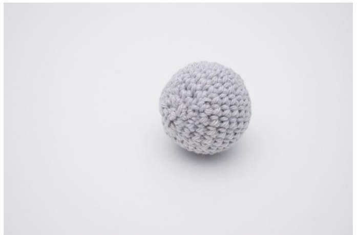
4. Coudre le trou, et rentrer le fil.