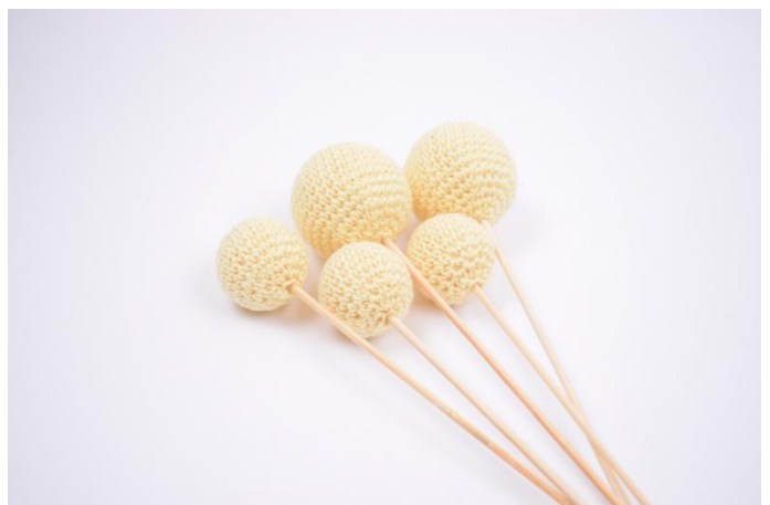
6. Elles sont désormais prêtes à décorer votre maison 😊