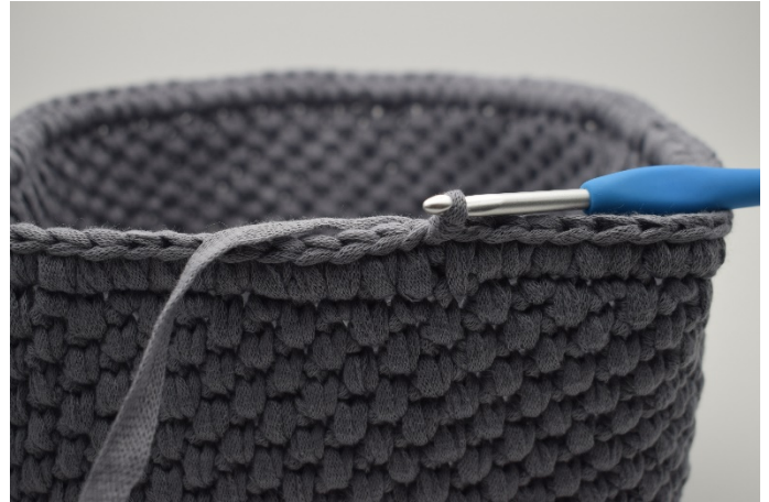
6. Répéter tout le rang. Finir avec 1 mc.