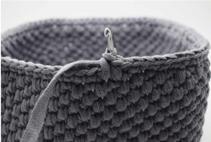
5. Comme ceci.