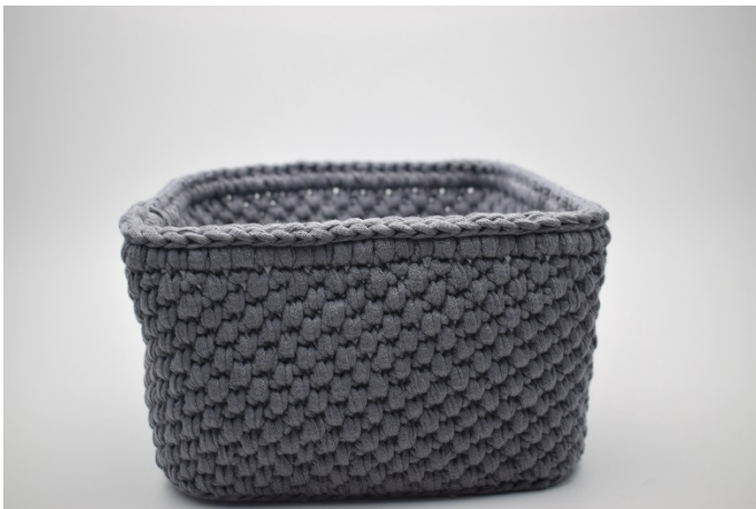
7. Finir avec un rang de mc.