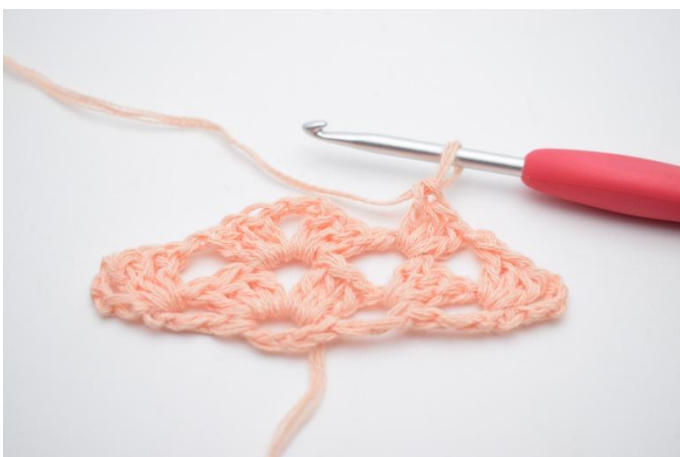
22. Faire 1 ml.