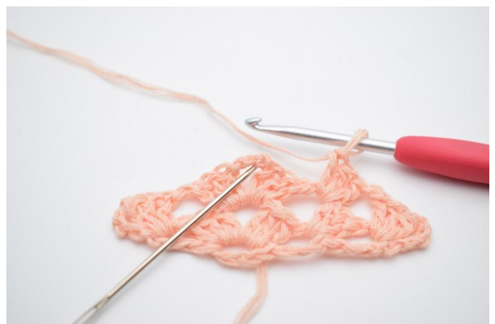
23. Maintenant travailler dans l'espace de ml où se trouve la pointe du châle: