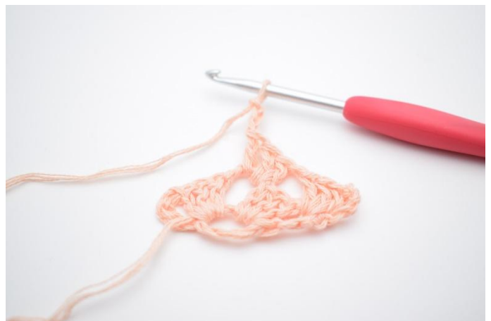
12. Faire 3 ml. Crocheter 1 gr br dans le même espace que précédemment.