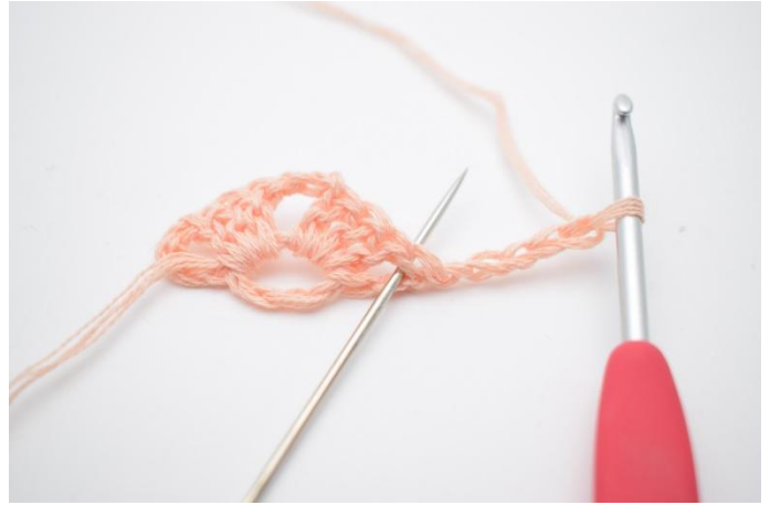
8. Dans l'espace marqué par l'aiguille sur la photo: