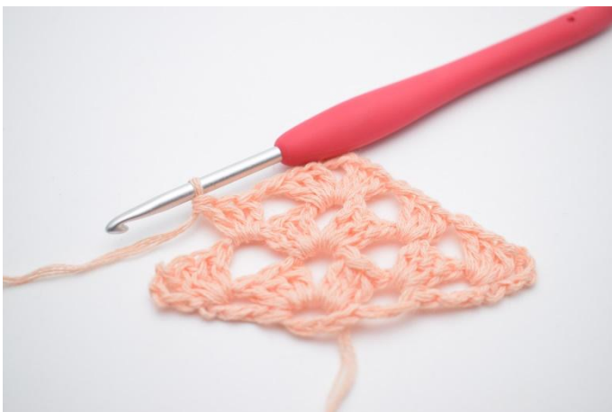
26. Comme ceci.