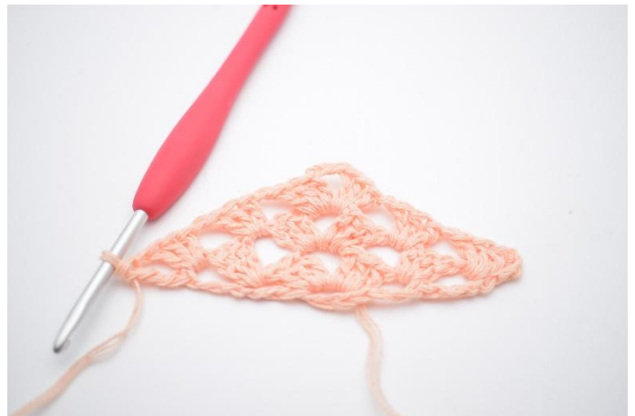
29. Faire 1 ml. Crocheter 1 dbr dans la 4ème ml du début du rang précédent..

Répéter de cette façon jusqu'à avoir 55 rangs où jusqu'à avoir la taille désirée pour votre châle.