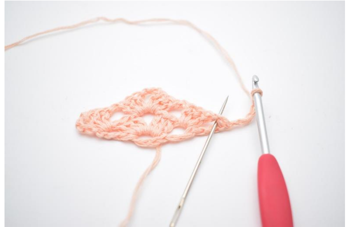
19. Dans l'espace marqué par l'aiguille sur la photo: