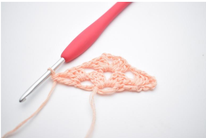
17. Comme ceci.