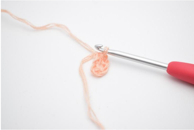
1. Faire 6 ml et former un rond avec 1 mc dans la 1ère ml.