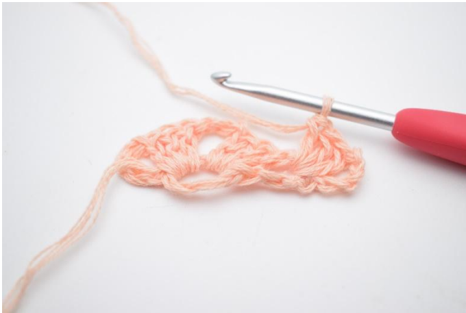
9. Faire 1 gr br (3 br dans la même m)