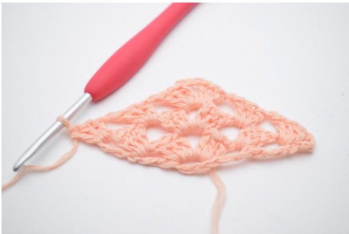
28. Comme ceci.