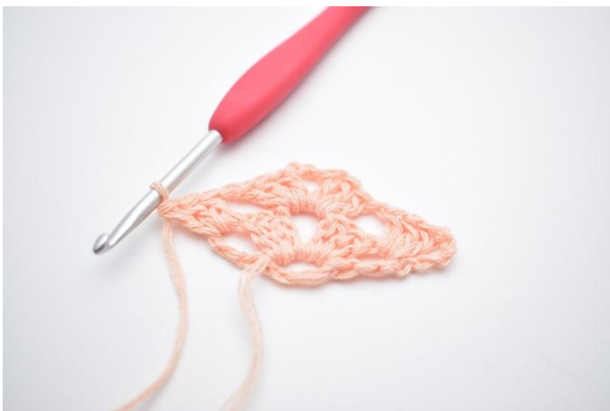
15. Comme ceci.