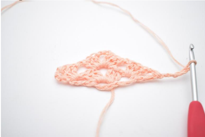
18. Faire 5 ml et tourner.