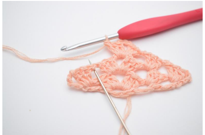
25. Faire 1 ml. Crocheter le prochain gr br dans l'espace marqué par l'aiguille.