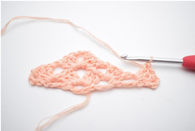
20. Faire 1 gr br