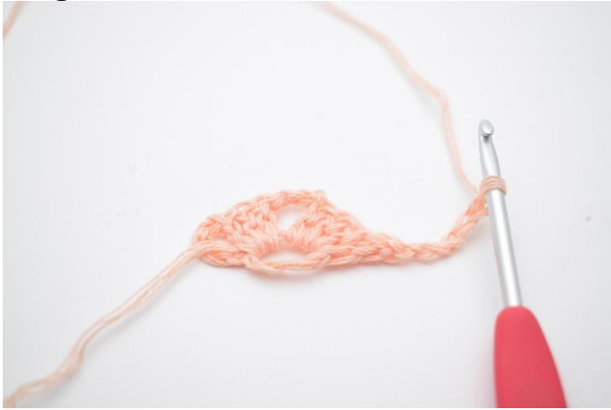
7. Faire 5 ml et tourner le travail.