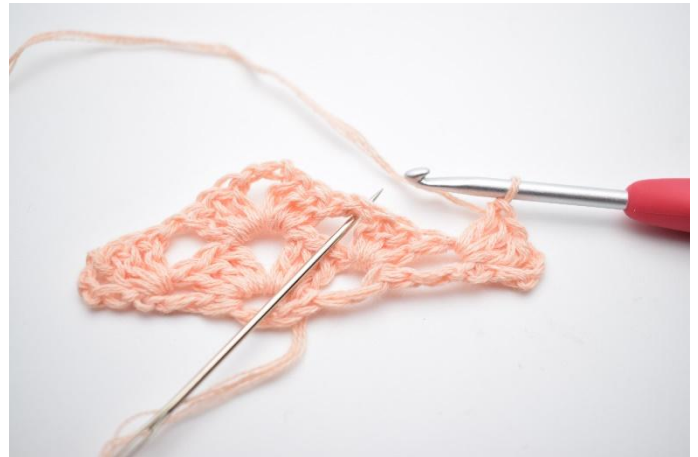
21. Faire 1 ml. Faire 1 gr br dans l'espace marqué par l'aiguille sur la photo.