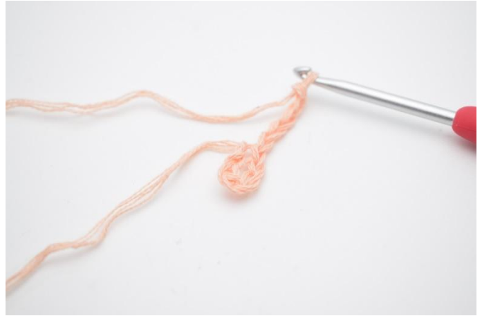
2. Faire 5 ml.