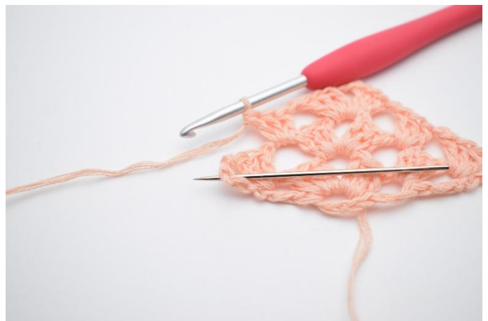
27. Faire 1 ml. Crocheter le prochain gr br dans l'espace marqué par l'aiguille.