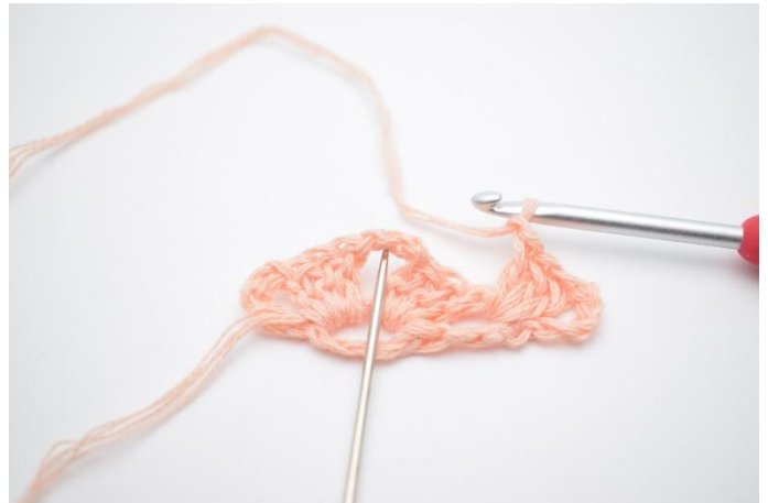
10. Faire 1 ml. Maintenant, dans l'espace du rang précédent crocheter: (C'est la pointe du châle):