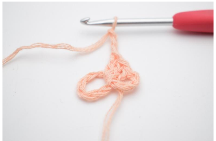
4. Faire 3 ml.