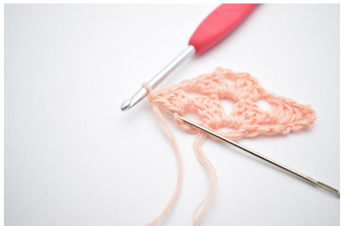
16. Faire 1 ml, faire 1 dbr dans la 4ème ml du début du rang précédent