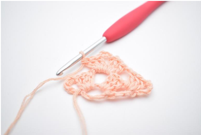
13. Comme ceci.