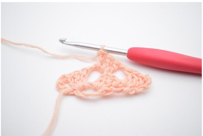
11. Faire 1 gr br.