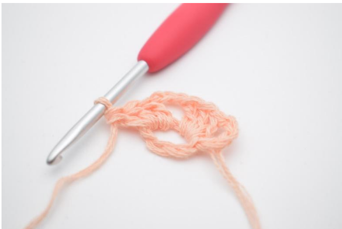
5. Crocheter 3 br dans le cercle.