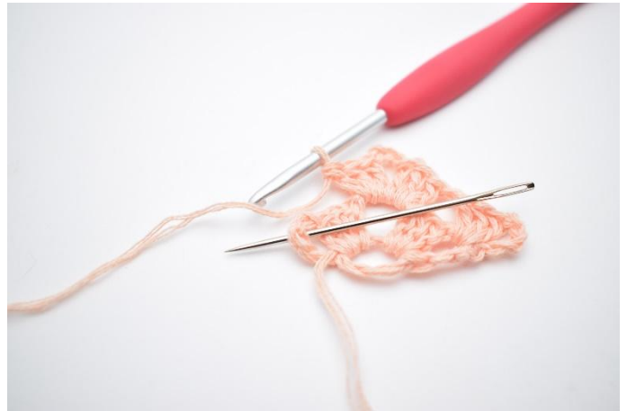
14. Faire 1 ml. Crocheter 1 gr br dans l'espace marqué par l'aiguille sur la photo.