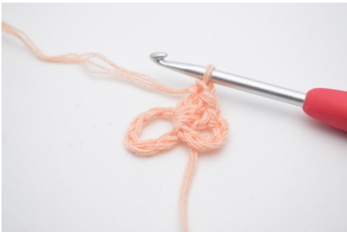
3. Crocheter 3 br dans le cercle.