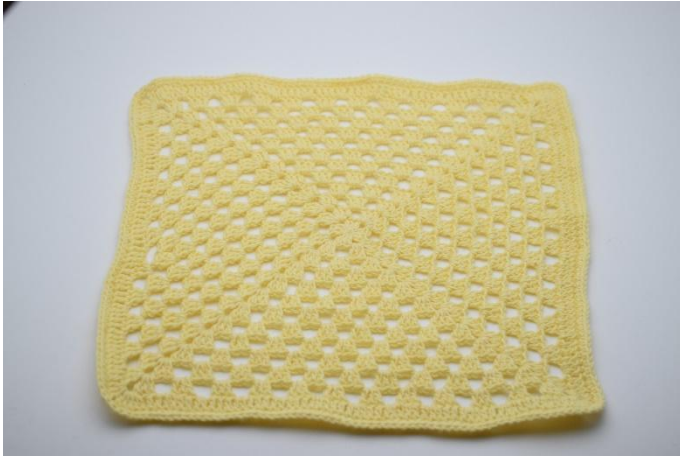
9. Le Doudou est maintenant terminé.