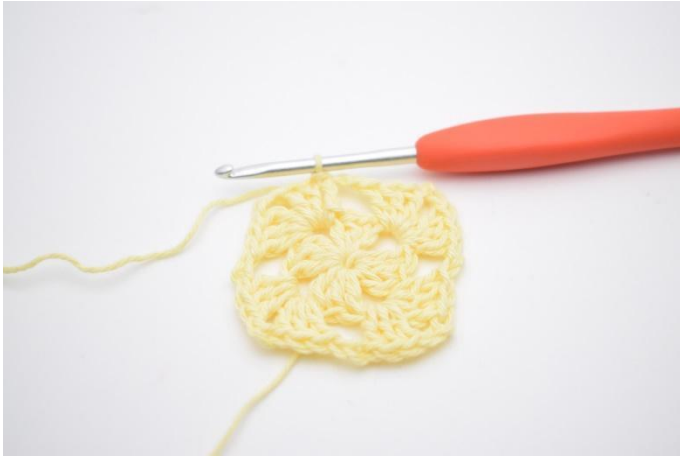
9. Finir avec 1 mc dans la 3ème ml du début du tour.