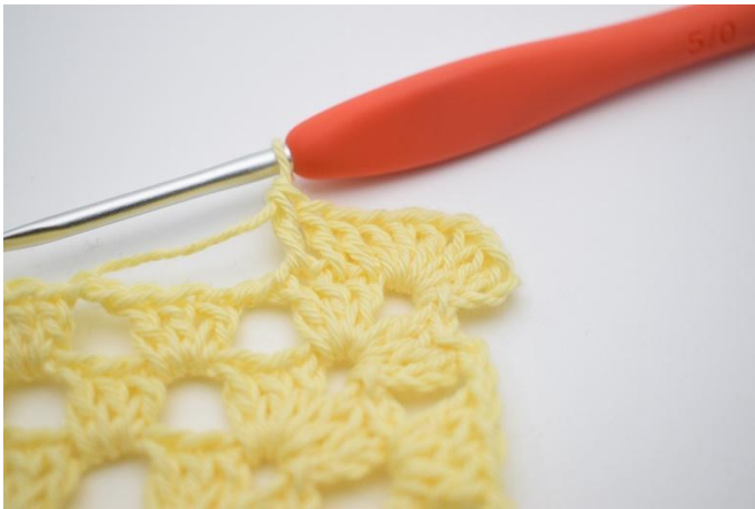
3. *1 br dans les 3 m suivantes.