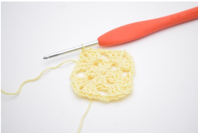
11. Comme ceci.