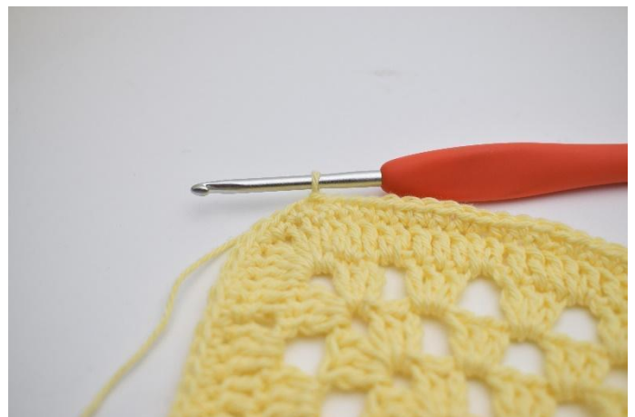
8. Faire 1 ml et faire des ms tout le tour. Finir avec 1 mc.