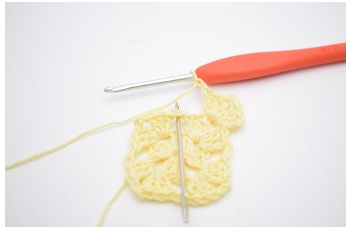
2. Faire 2 ml. Maintenant crocheter dans l'espace de ml suivant.