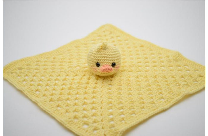
10. Coudre la tête au centre de celui-ci.