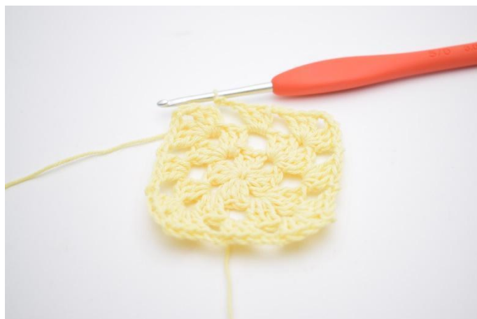
10. Répéter tout le tour. Finir avec 2 ml et 1 mc dans la 3ème ml du début du tour.