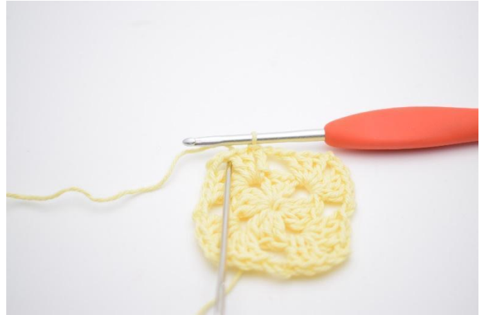
10. mc tout le long jusqu'à atteindre le coin (l'espace de ml).