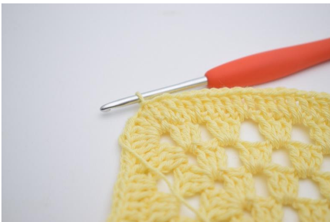
7. Finir avec 1 mc.