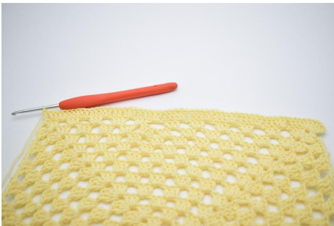
5. Répéter de * à * jusqu'au prochain coin.