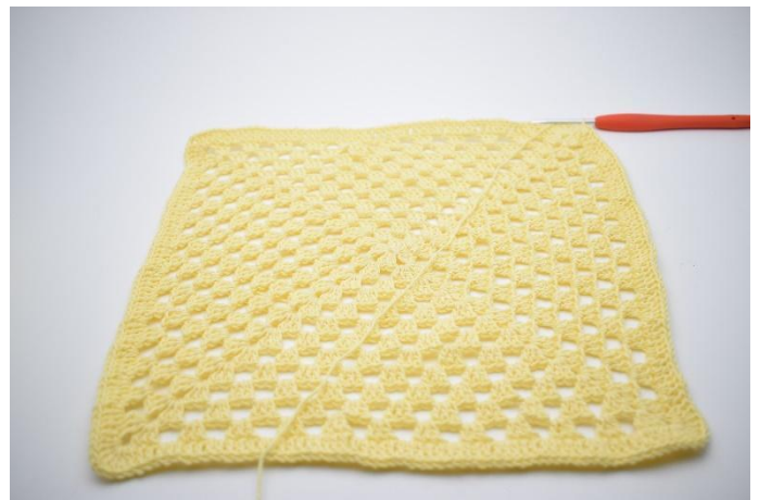
6. *3 br, 2 ml, 3 br* dans le coin (espace de ml). 1 br dans chaque m et 2 br dans les espaces de ml. Répéter tout le tour.