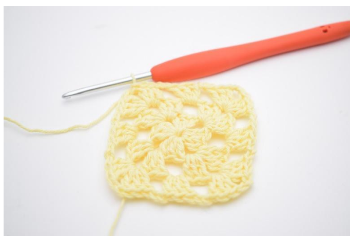
12. Comme ceci.