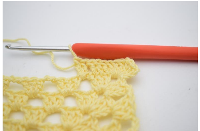
4. 2 br dans l'espace de ml*.