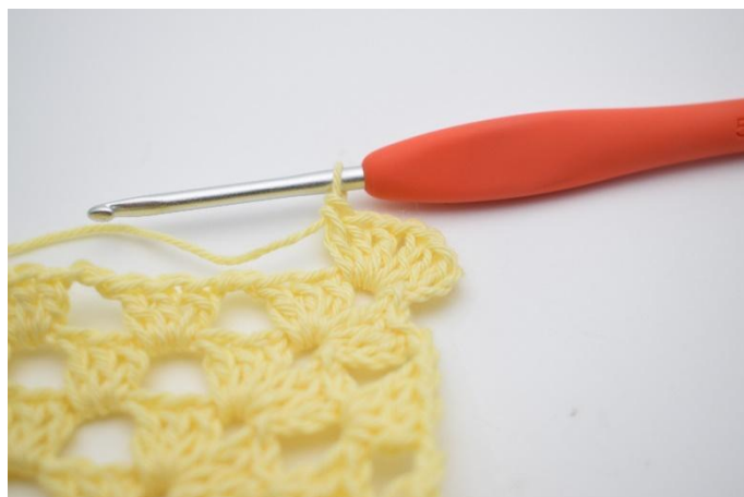
2. Maintenant faire 3 ml et *2 br, 2 ml, 3 br* dans le coin (espace de ml).