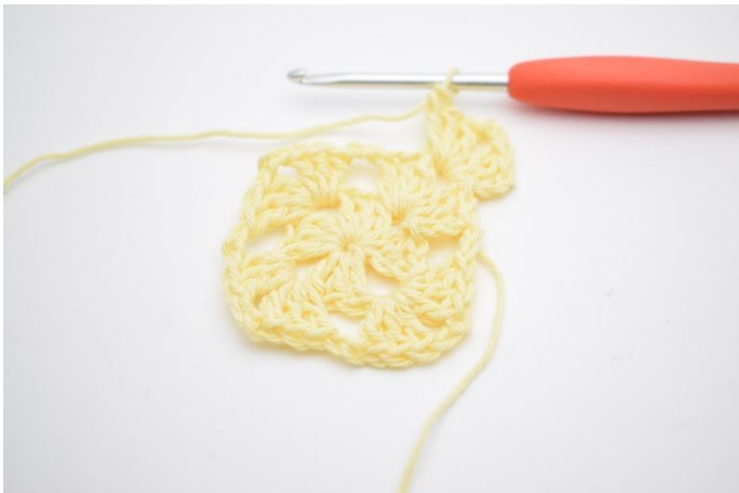
1. Faire 3 ml (comptent comme 1 br). *2 br, 2 ml, 3 br* dans le coin (l'espace de ml).