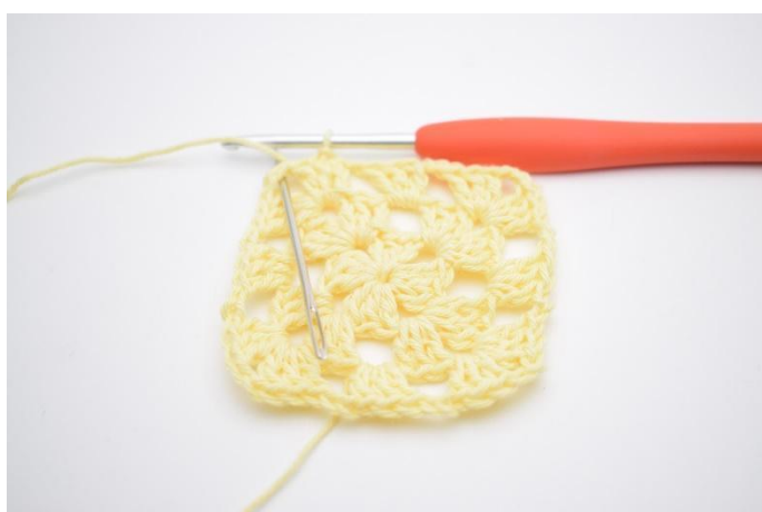
11. mc tout le long jusqu'à atteindre le coin (espace de ml).