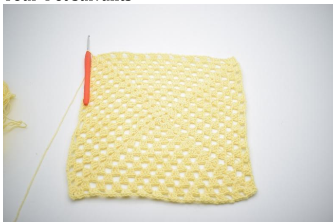
1. Répéter le tour 3 pour un total de 10 fois ou jusqu'à avoir la taille désirée.