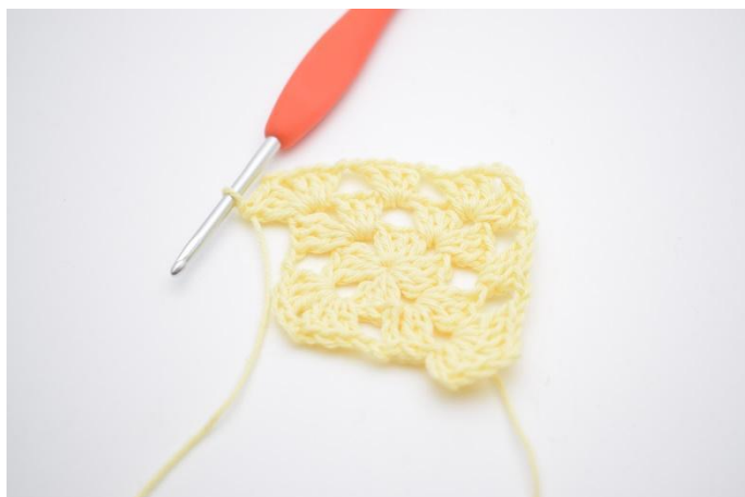
9. *3 br, 2 ml, 3 br* dans le coin (espace de ml).