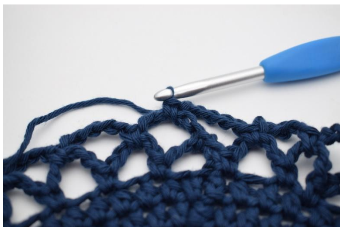
15. Maintenant répéter les tours et changer de couleur comme décrit dans le tutoriel.