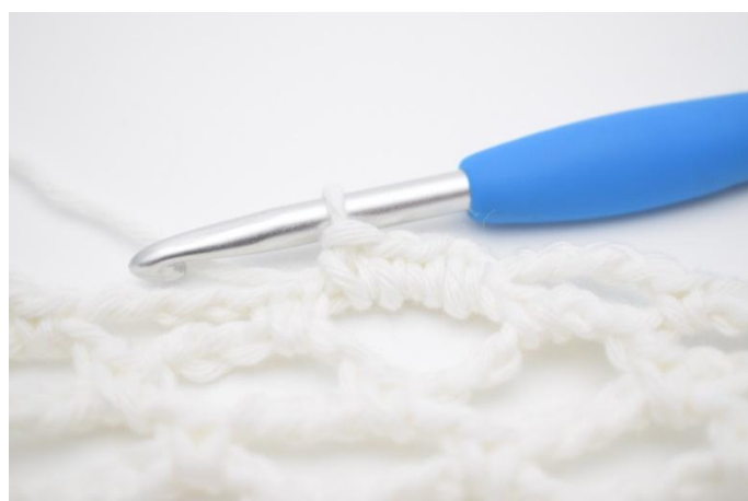
2. Comme ceci.