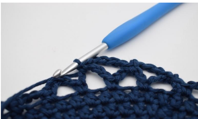
13. Crocheter 1 ms.