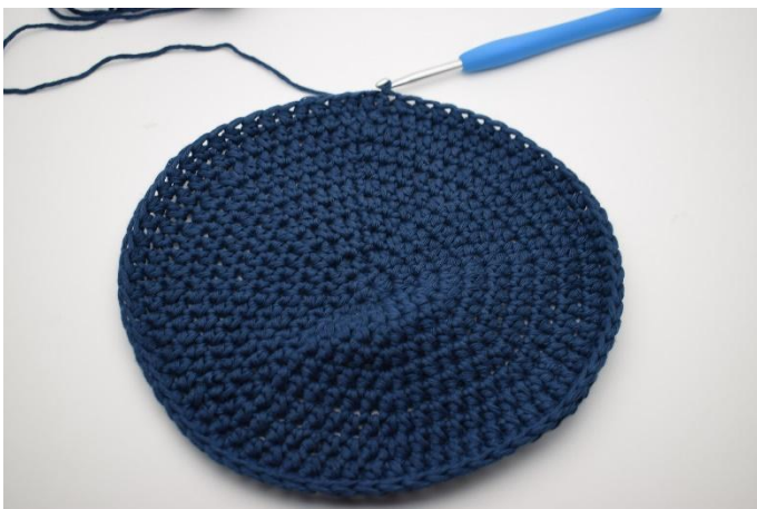
1. La base est juste terminée avec 1 mc.