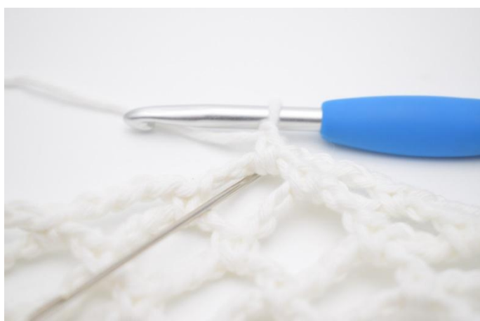
1. Faire 1 ml et crocheter 4 ms dans l'esp-ml.