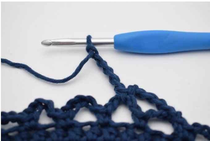
11. Faire 5 ml.