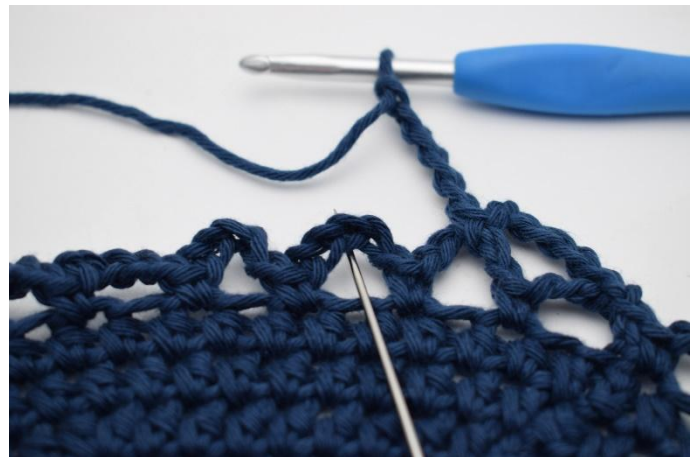
12. Dans l'esp-ml suivant. (L'aiguille le marque ici).