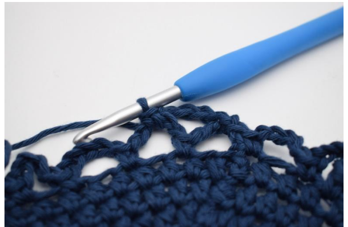
10. Crocheter 1 ms.