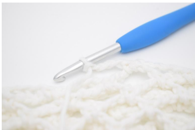
17. Crocheter encore un tour avec la couleur 4. Crocheter ce tour comme avant, mais faire 4 ml au lieu de 5.