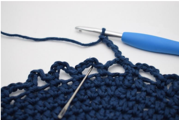
9. Dans l'esp-ml suivant. (L'aiguille le marque ici).