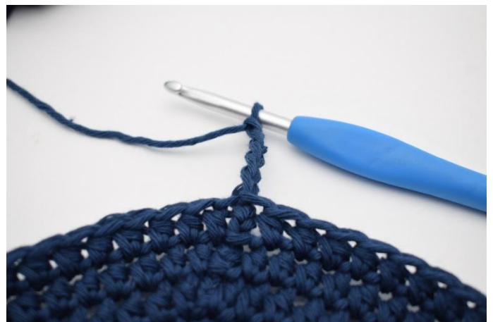
2. Faire 5 ml.