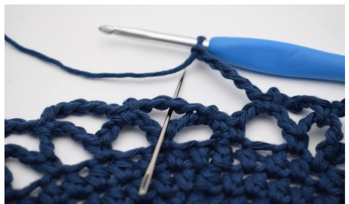
14. Répéter comme ceci tout le tour. Finir le tour avec 1 mc dans le premier esp-ml, qui a été fait sur ce tour.