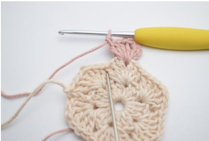
3. Crocheter 4 br dans l'espace suivant.