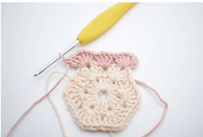
5. "3 br, 1 ml, 3 br dans l'espace,