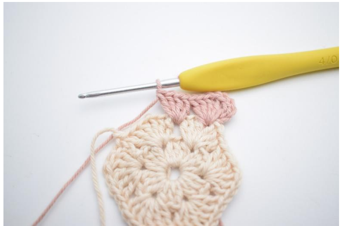
4. Comme ceci.