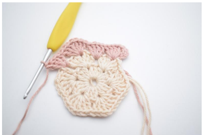
6. et 4 br dans le prochain espace".