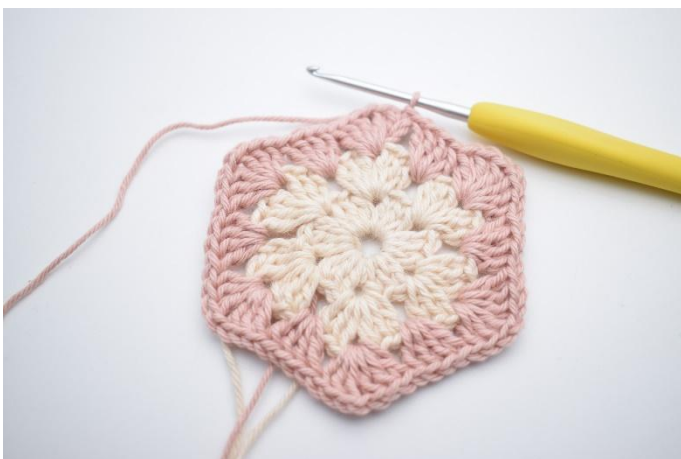
7. Répéter de " à " 5 fois et finir avec 1 mc.