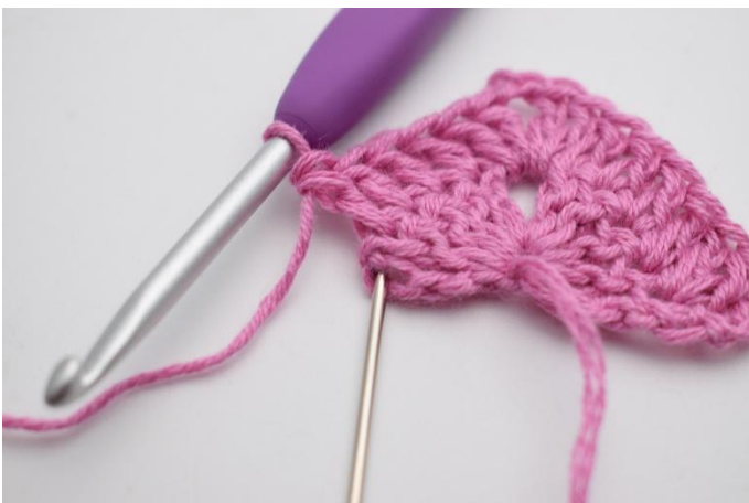
7. Dans la dernière m, on crochète (2 b, 1 db).