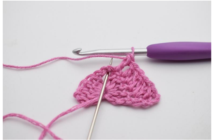
4. Dans l'arceau de ml, on crochète (2 b, 2 ml, 2 b).