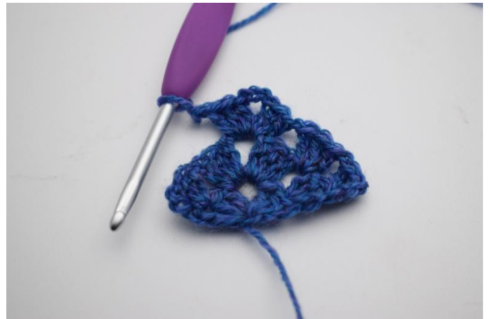
12. Crocheter (1 gr de b, 3 ml, 1 gr de b) dans cet espace.