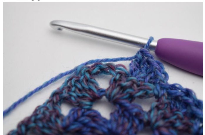
10. Répéter jusqu'à la pointe du châle / l'arceau de ml.