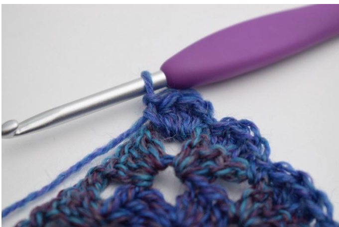
11. Crocheter (1 ms, 3 b, 1 ms) dans l'arceau de ml.