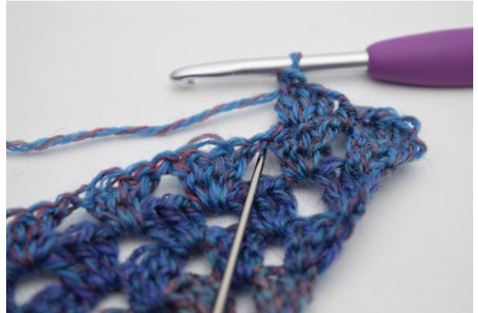
8. Crocheter 1 ms dans l'espace sous les ml du rang précédent.