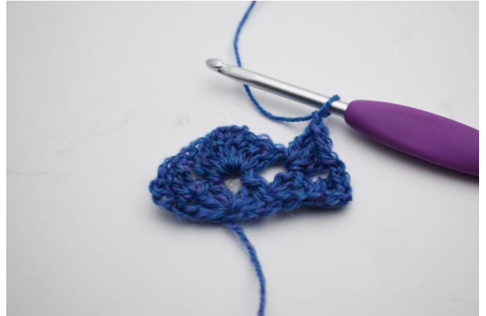
10. Crocheter 1 gr de b dans le prochain espace sous les ml.