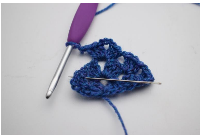
13. Faire 1 ml. On crochète maintenant dans l'espace sous les ml.