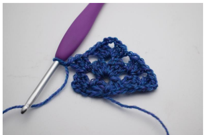
14. Crocheter 1 gr de b.