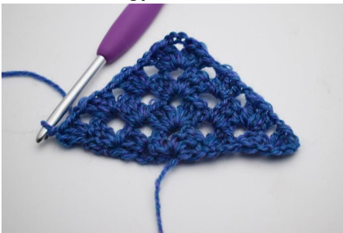
17. Et répéter ainsi. Faire 3 ml (équivalent à 1 b) Crocheter 2 b dans la première m et faire 1 ml. Crocheter (1 gr de b, 1 ml) dans chaque espace sous les ml. Dans la pointe du châle, crocheter (1 gr de b, 3 ml, 1 gr de b, 1ml). Répéter (1 gr de b, 1 ml) dans chaque espace sous les ml sur le côté opposé et terminer par 1 gr de b dans la 3ème ml du rang précédent.