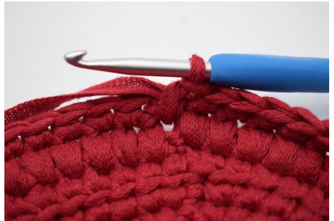
12. Comme ceci.