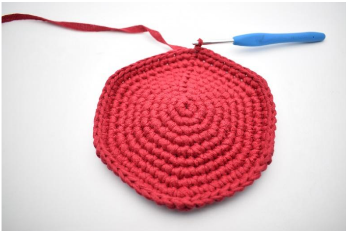
1. Voilà à quoi doit ressembler la base après avoir terminé les tours d'augmentations.