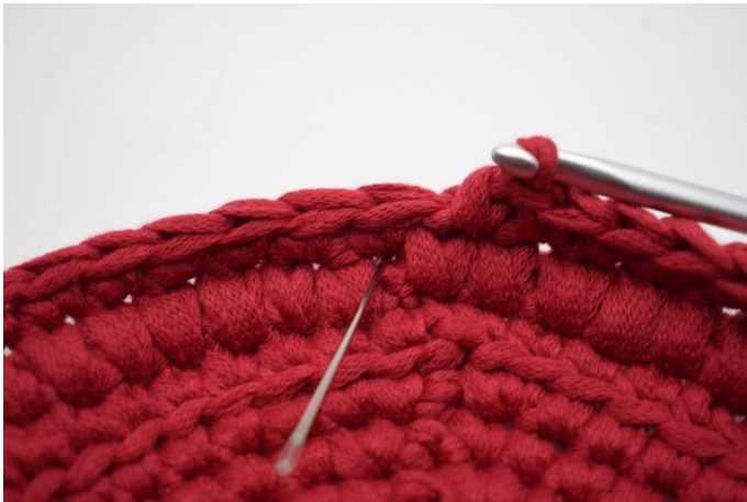
11. Sur le prochain tour faire des lms dans l'espace indiqué par l'aiguille.