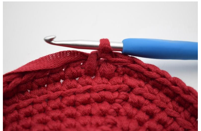
8. Comme ceci. Il y a maintenant 2 lms.