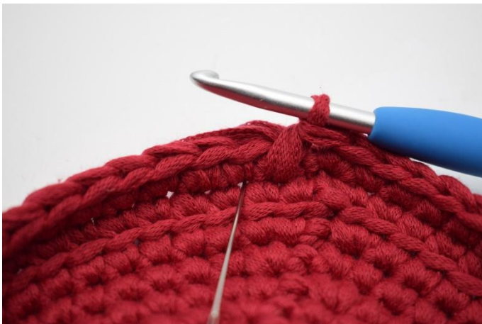
7. Faire la lms suivante dans l'espace où pointe l'aiguille.