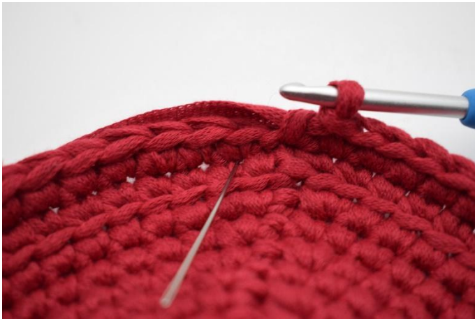
5. Crocheter des lms dans chaque m. (Sauter le tour précédent, insérer le crochet dans la ms du tour suivant, là où pointe l'aiguille).