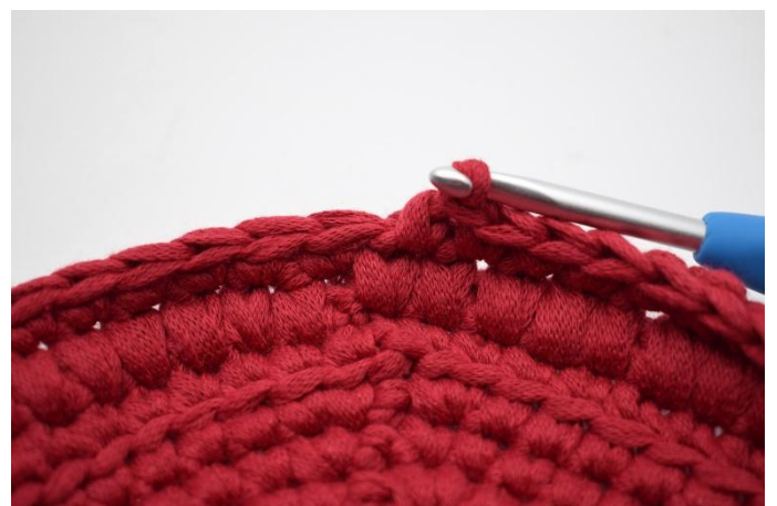
10. Sur le tour suivant, faire 1 ms dans chaque m.