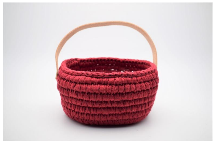
16. Fixer la lanière au panier grâce aux rivets.