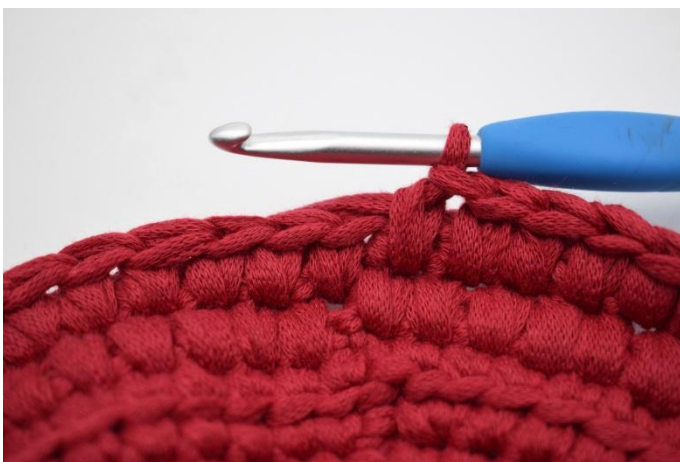
13. Répéter dans chaque m tout le tour.