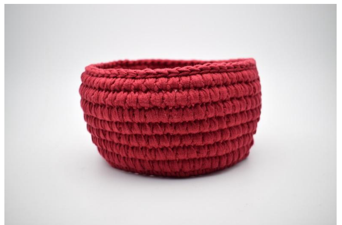
14. Répéter les tours 12 et 13 pour un total de 7 fois. Finir avec 1 tour de mc.