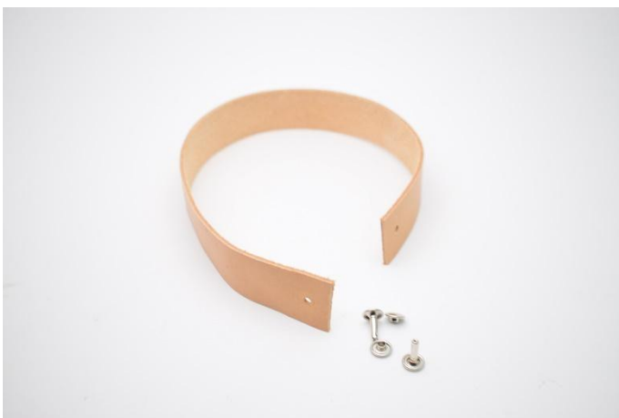
15. Couper votre lanière en cuir, un morceau de 35,5 cm environs et faire un trou à chaque extrémité pour les rivets.