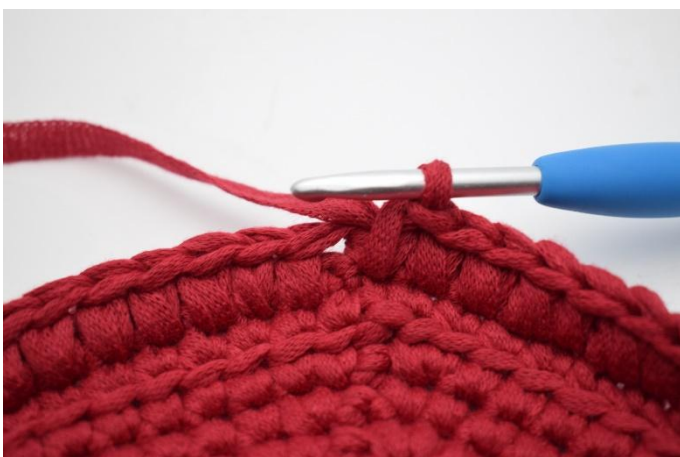
9. Répéter dans chaque m tout le tour.