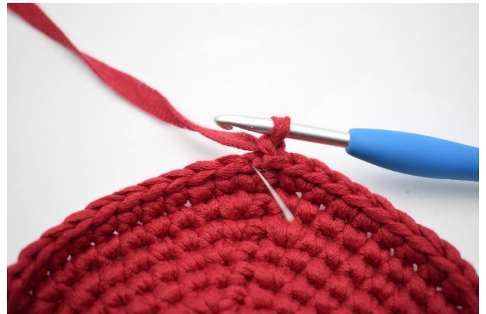
2. Faire 1 ml. Crocheter 1 ms Bar tout le tour, l'aiguille montre où faire la première ms.