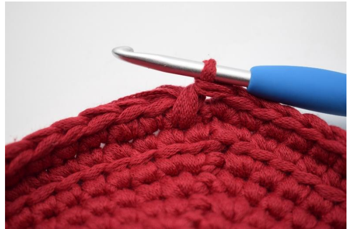
6. Crocheter la lms comme ceci.