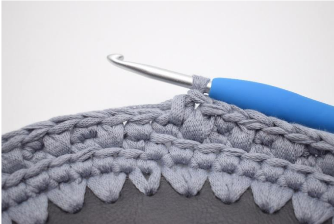
13. Répéter sur tout le tour avec des ms et msa. Terminer le tour par 1 ms.