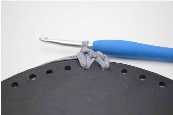
1. Crocheter des ms dans tous les trous du fond, comme décrit dans le modèle.