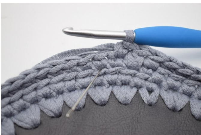
11. Faire 1 msa dans la m suivante. L'aiguille indique où faire la msa.