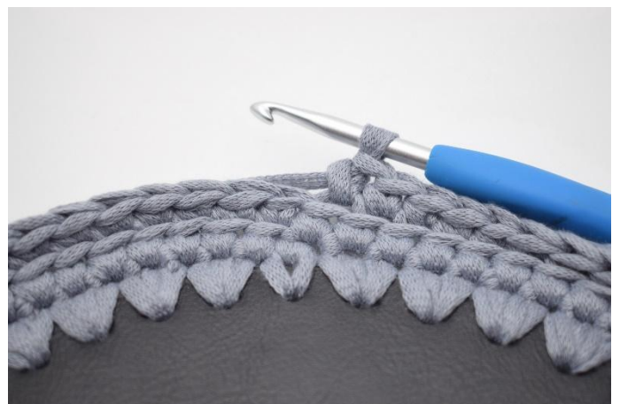
6. Répéter tout le tour avec des ms dans le br arr.