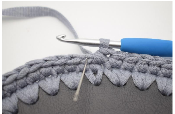
4. Maintenant on crochète des ms dans le br arr. L'aiguille indique où crocheter la ms.