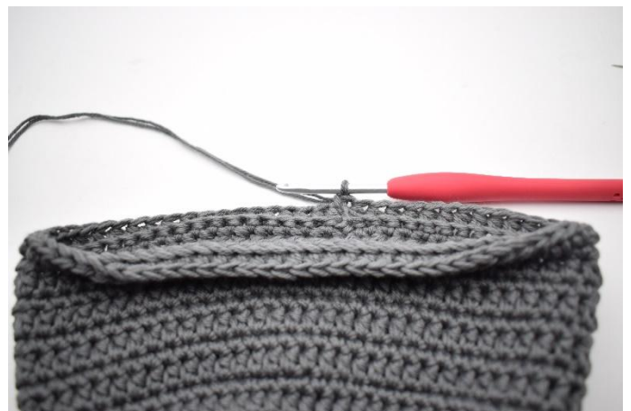
12. Finir avec 1 mc dans la première demi-br.