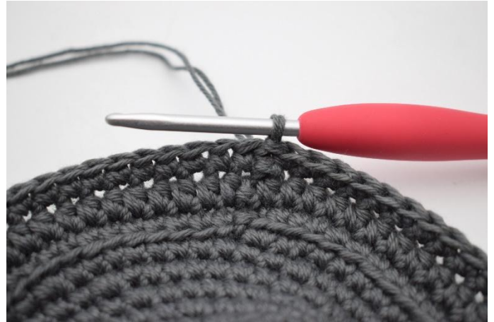
8. Faire 1 ms dans le brin arrière de chaque m du rang. Finir avec 1 mc.