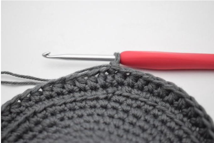
7. Faire 1 ml.