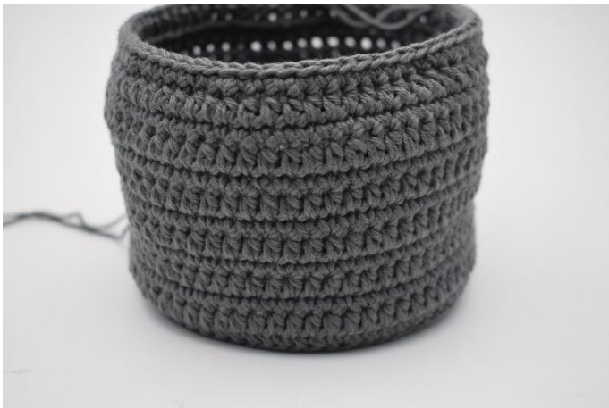
9. Répéter ces 2 rangs jusqu'à avoir la hauteur désirée comme décrit dans le tutoriel.