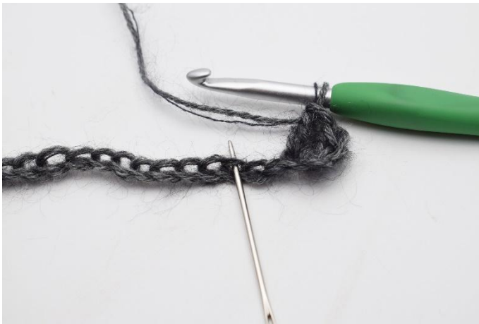
3. Sauter 2 ml.