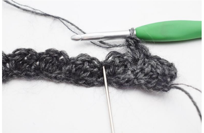
6. Sauter 2 m,