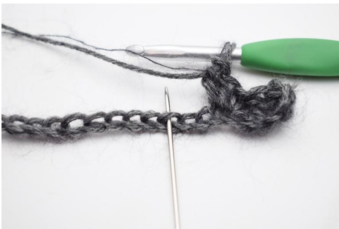
5. Sauter 2 ml