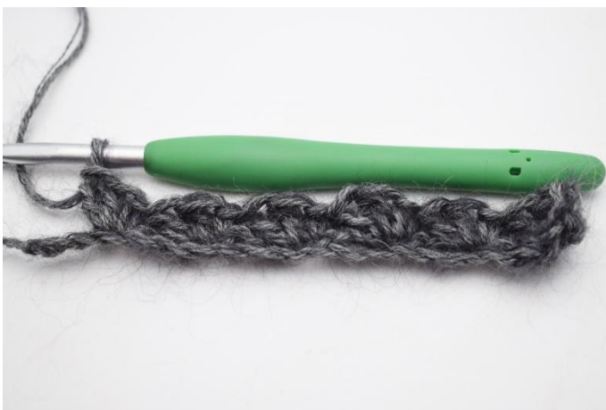
7. Sauter 2 ml, crocheter 1 ms et 2 br dans la m suivante. Répéter jusqu'à ce qu'il reste 2 ml.