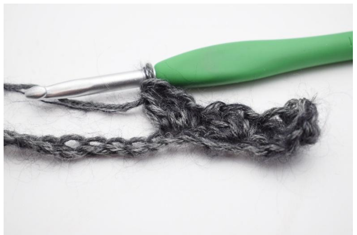
6. Crocheter 1 ms et 2 br dans la ml suivante.