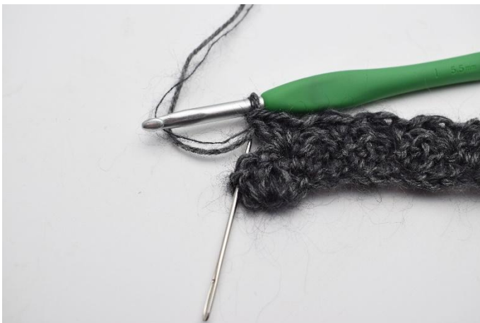
9. Dans la dernière m du rang, (l'aiguille vous montre la dernière m du rang précédent)