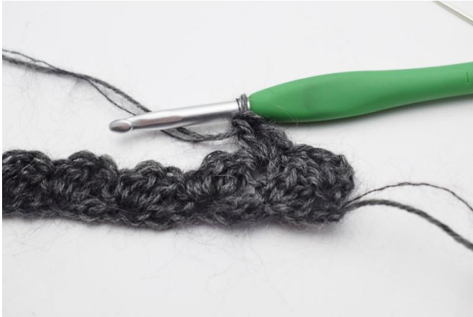
5. Crocheter 1 ms et 2 br dans la m suivante.