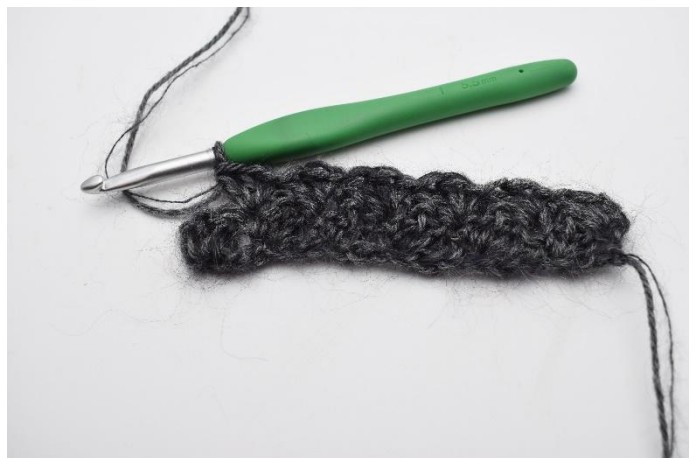
8. "Sauter 2 m, crocheter 1 ms et 2 br dans la m suivante". Répéter de " à " jusqu'à la fin du rang.