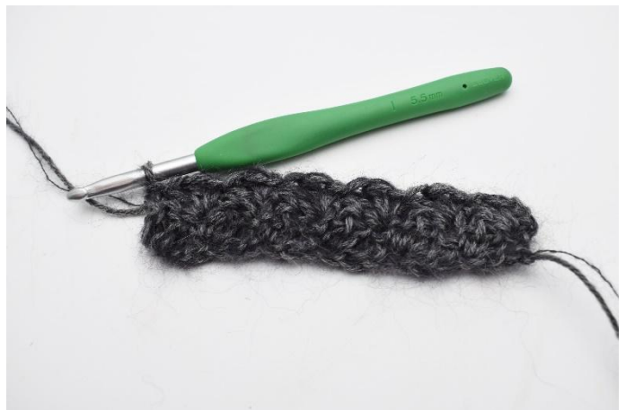
10. Crocheter 1 ms.