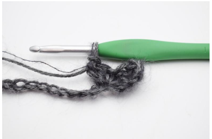
4. Crocheter 1 ms et 2 br dans la ml suivante.