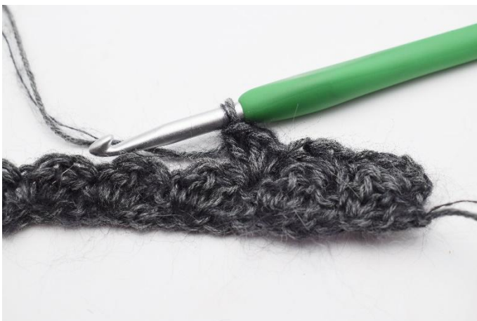
7. Crocheter 1 ms et 2 br dans la m suivante.