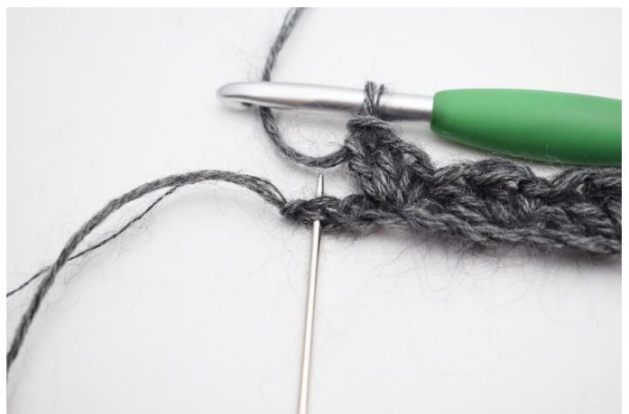
8. Sauter 1 ml. (l'aiguille montre la dernière ml)