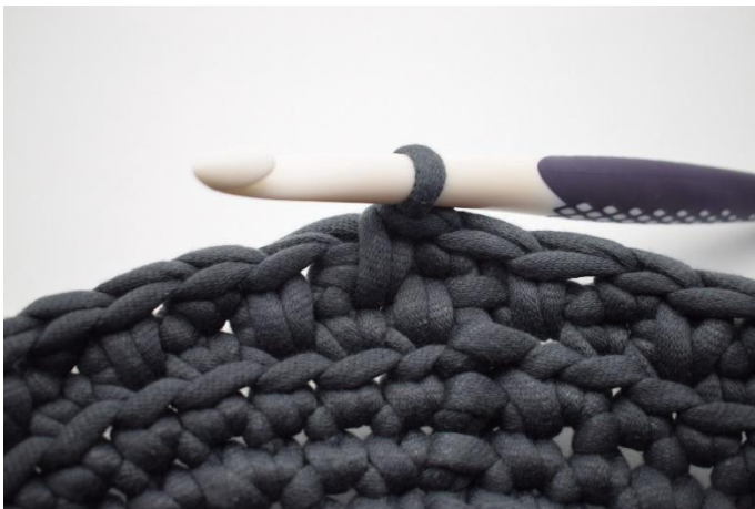
15. Comme ceci.