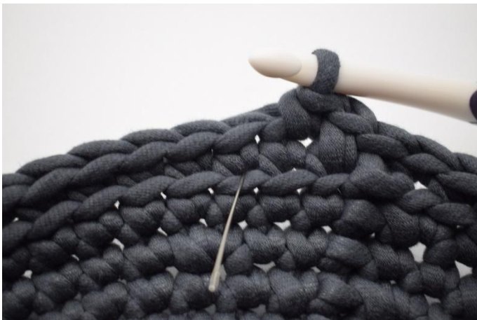
9. Faire 1 lms. L'aiguille marque là où vous devez faire la lms.