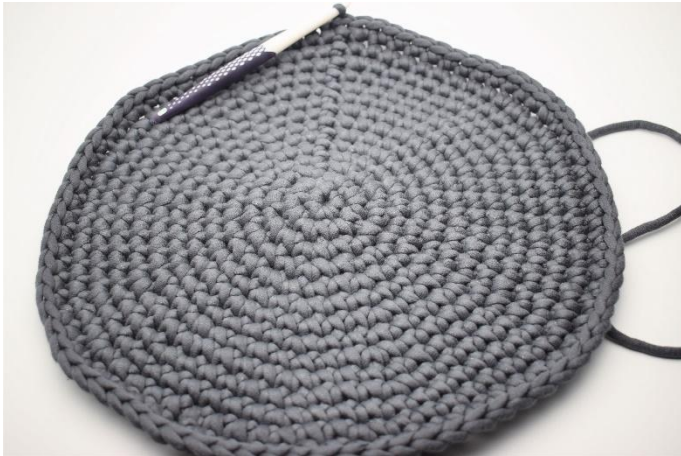
1. Voici la base du panier, une fois terminée.