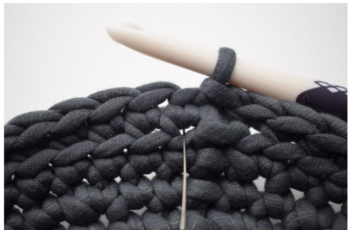
6. Continuer en crocheter en spirale. Commencer par 1 lms. Une lms est crochétée comme une ms normale mais faite un rang plus bas. L'aiguille marque là où vous devez faire la lms.