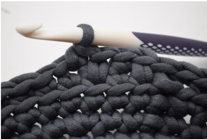
11. 1 ms dans la m suivante.