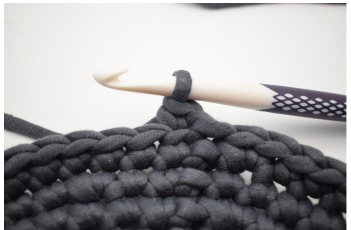
4. Comme ceci.