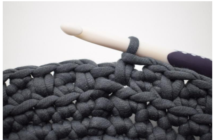
12. Répéter "1 lms, 1ms " tout le tour. Finir avec 1 lms.