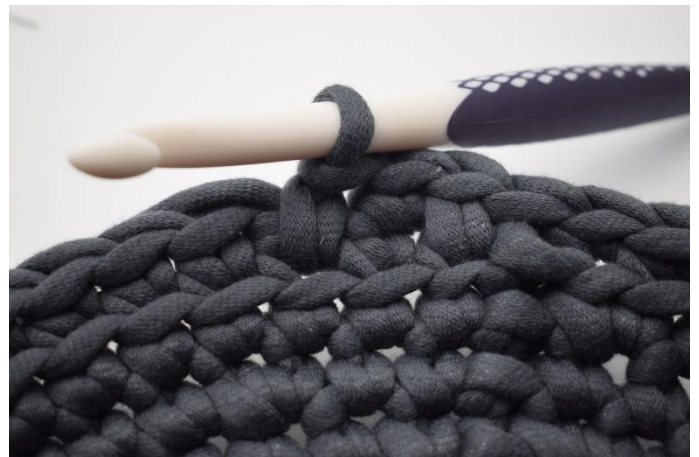
10. Comme ceci. Maintenant vous avez fait 1 lms.