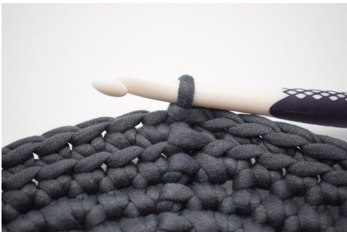
5. Répéter tout le tour. Finir avec 1 mc.