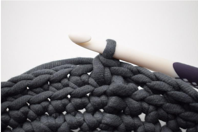
7. Comme ceci. Maintenant vous avez fait 1 lms.