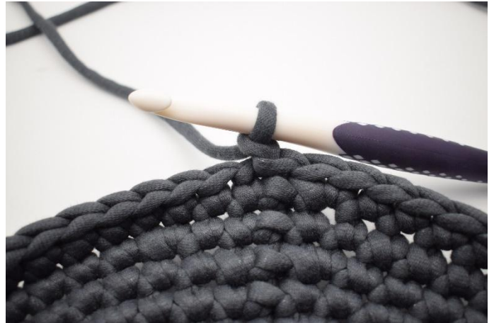
2. Faire 1 ml.