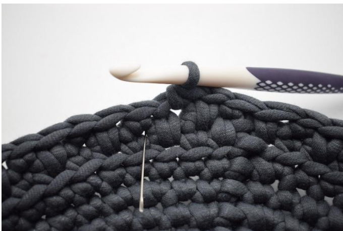
17. Faire 1 lms. L'aiguille marque là où vous devez faire la lms.