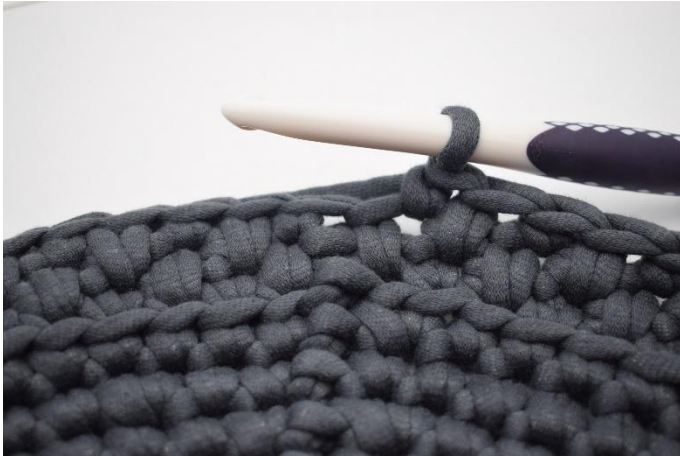
19. Répéter "1ms, 1 lms " tout le tour. Finir avec 1 ms.