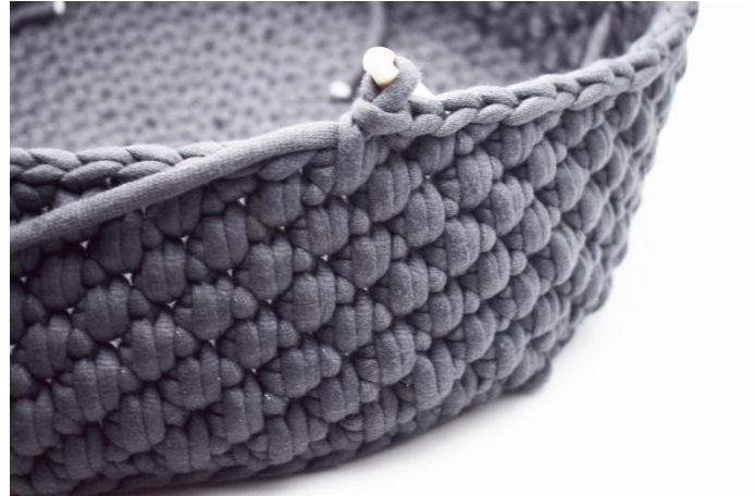
20. Répéter les tours 16 et 17 jusqu'à avoir 8 rangs alternant les ms et les lms.