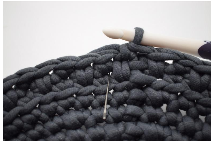
14. Faire 1 lms. L'aiguille marque là où vous devez faire la lms.