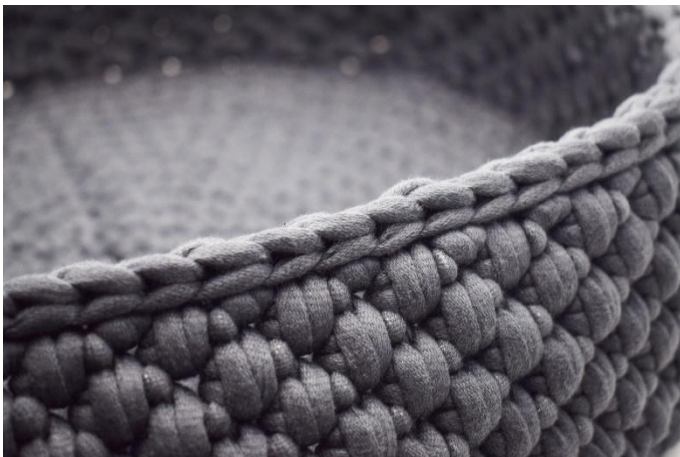
21. Finir avec 1 rang de mc. Couper le fil et le cacher.