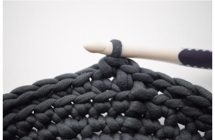
8. 1 ms dans la m suivante.