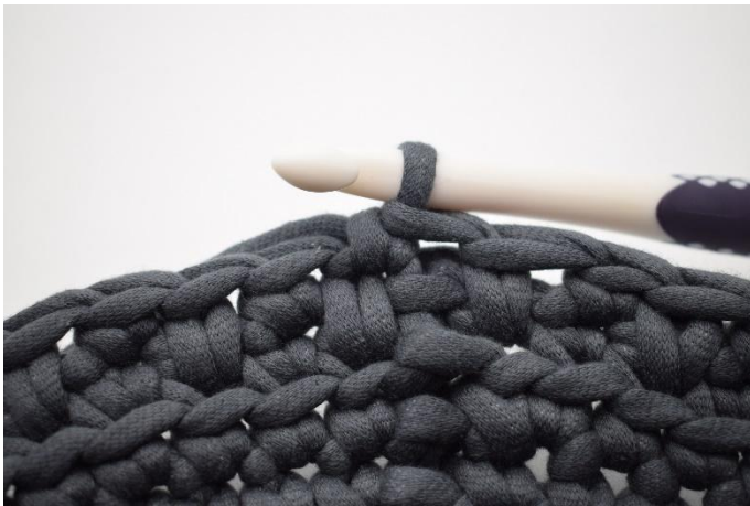
13. 1 ms dans la m suivante.