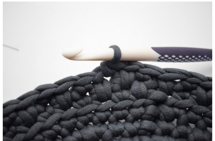
16. 1 ms dans la m suivante.