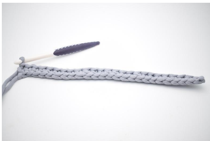
7. Répéter tout le rang.