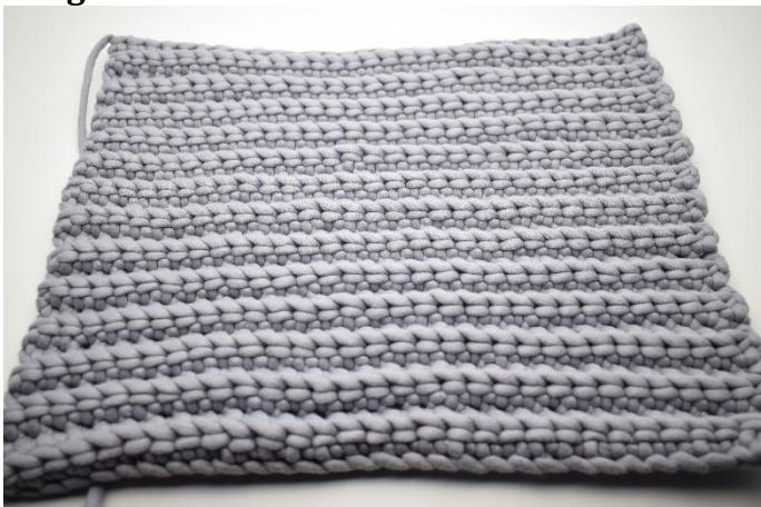
1. Répéter le rang 2 au total 25 fois. Couper le fil et le cacher. Crocheter une deuxième pièce de la même façon.