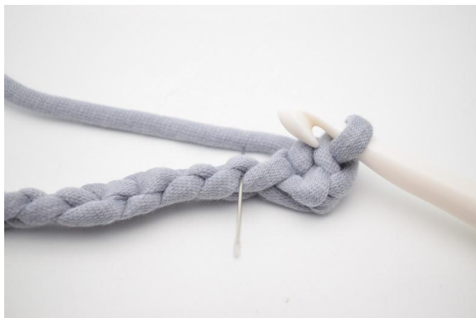
5. Faire 1 ms dans la boucle horizontal. L'aiguille montre la boucle dans laquelle travailler votre prochaine ms.