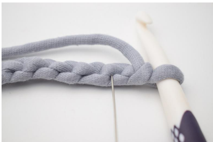
3. Vous pouvez faire un rang beaucoup plus soigné en travaillant les ms dans les boucles horizontales. L’aiguille montre la boucle dans laquelle travailler votre 1ère ms.