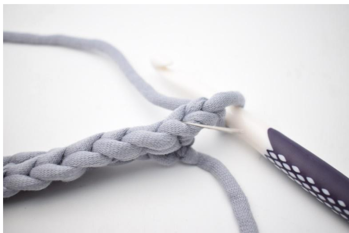
2. Crocheter 1 ms Bar. L'aiguille sur la photo montre dans quelle boucle faire la ms.