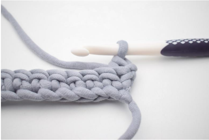
3. Comme ceci.