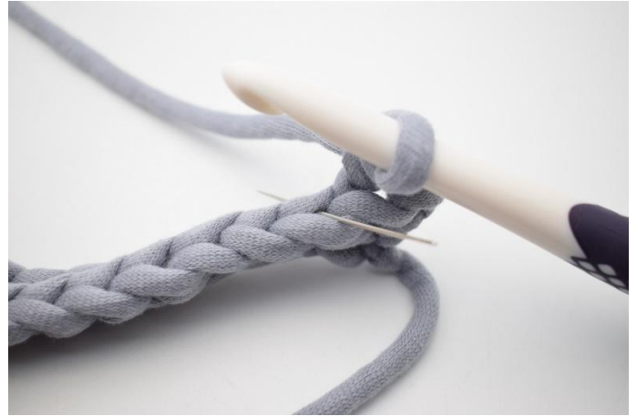
4. Faire 1 ms Bar dans la m suivante. L'aiguille sur la photo montre dans quelle boucle faire la ms.