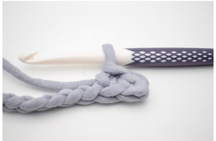
6. Comme ceci.