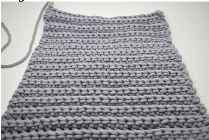
1. Répéter le rang 2, 29 fois au total. Couper le fil et le cacher. Faire une autre pièce de la même manière.