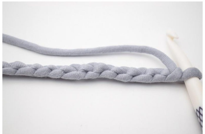
2. Tourner la chaînette pour que le dessous des mailles soit vers le haut.