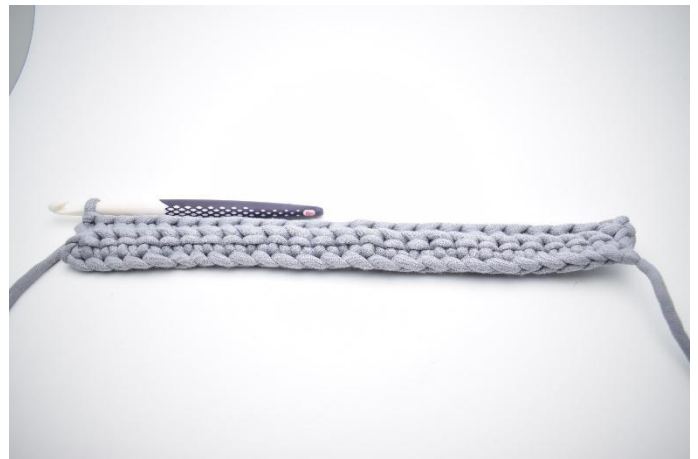
6. Répéter jusqu'à la fin du rang.