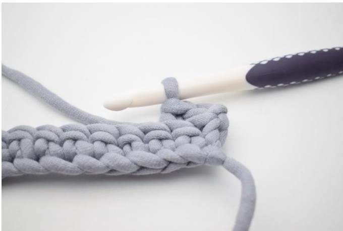
5. Comme ceci.