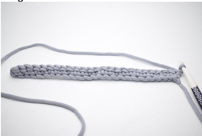
1. Tourner votre travail avec 1 ml.