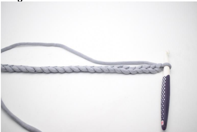
1. Faire vos ml.