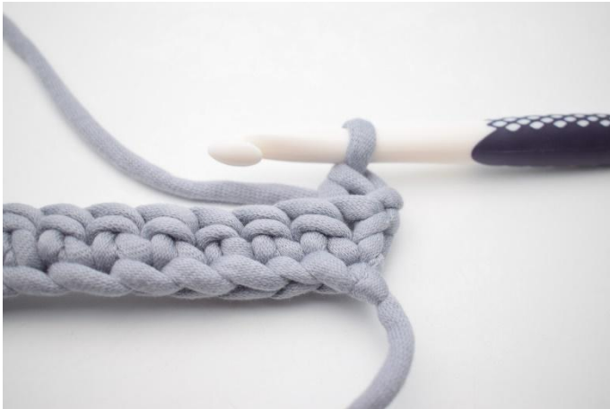
3. Comme ceci.