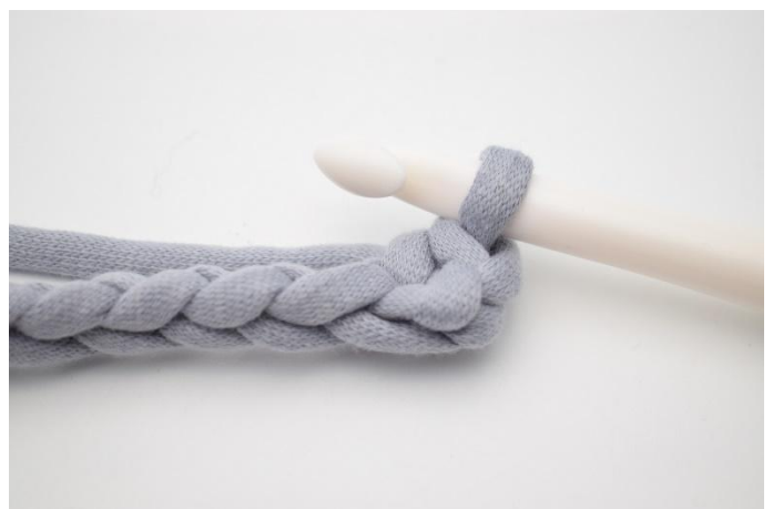
4. Comme ceci.