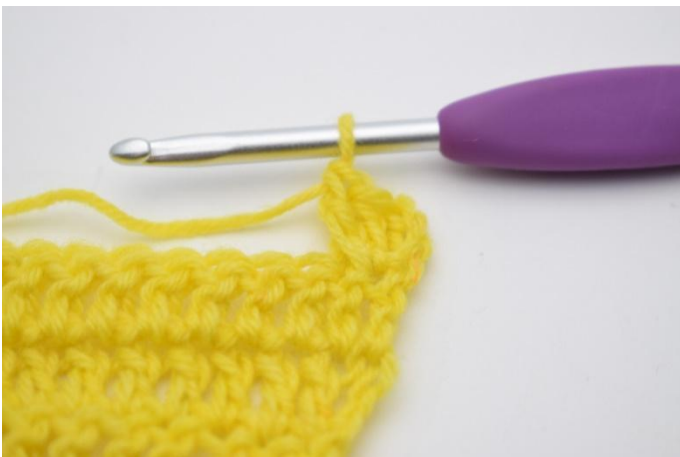
5. Comme ceci.