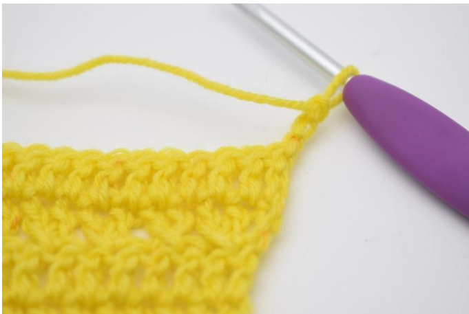
1. Retourner l'ouvrage avec 3 ml.

Retourner l'ouvrage avec 3 ml. "Sauter 1 m puis crocheter 1 b dans la prochaine m. Crocheter 1 b dans la m qui vient d'être sautée." Répéter de "à" jusqu'à ce qu'il reste 1 m. Crocheter 1 b dans la dernière m. (24)