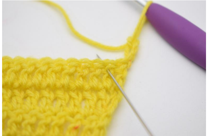
2. Sauter 1 m,