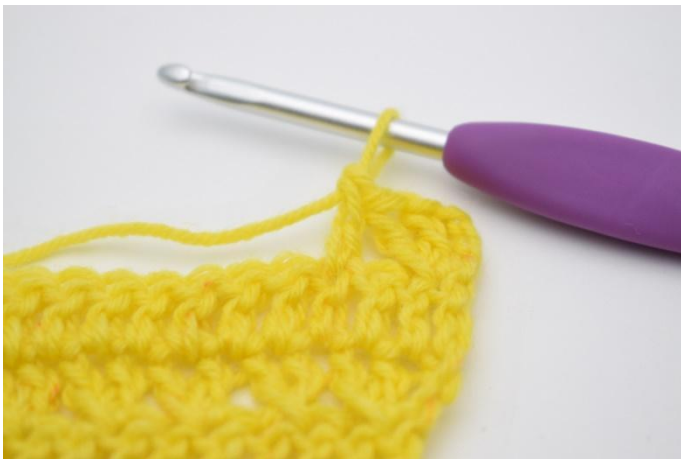
7. crocheter 1 b.