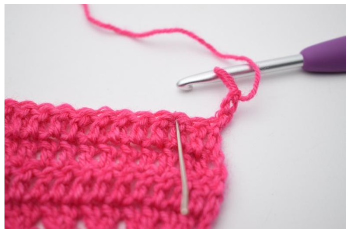
2. Sauter 2 m.