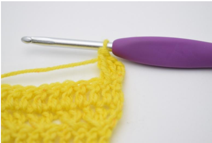
5. Comme ceci.