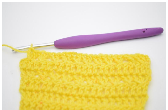
10. Répéter les b croisées jusqu'à ce qu'il reste 1 m.