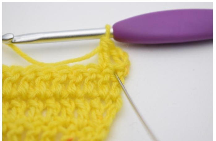
4. Crocheter 1 b dans la m qui vient d'être sautée.