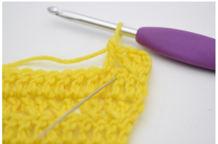
8. Crocheter 1 b dans la m qui vient d'être sautée.