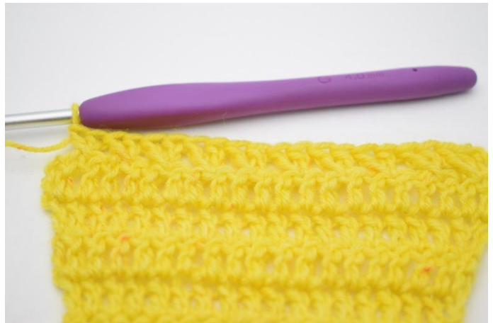
10. Répéter avec les b croisées jusqu'à ce qu'il reste 1 m.