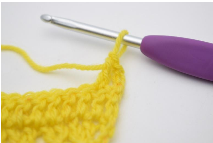
3. crocheter 1 b.