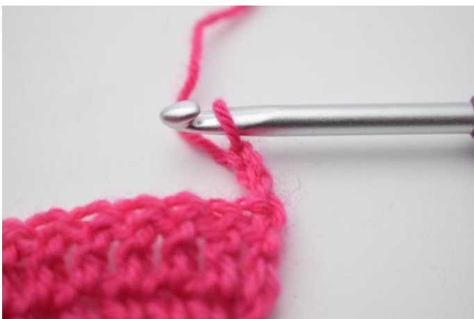
1. Retourner l'ouvrage avec 3 ml..

97. Retourner l'ouvrage avec 3 ml. Crocheter les 2 prochaines m ens. Crocheter des b le reste du rang. (96)