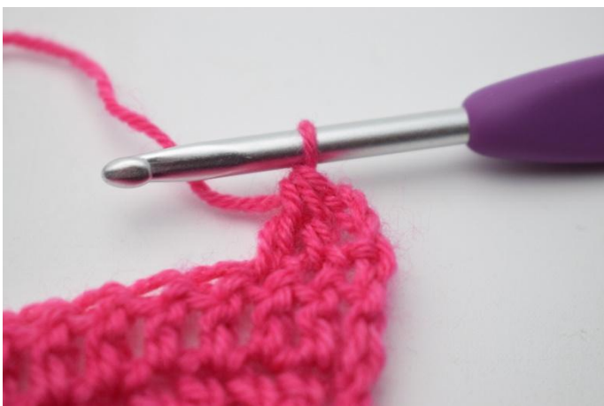
3. Comme ceci.