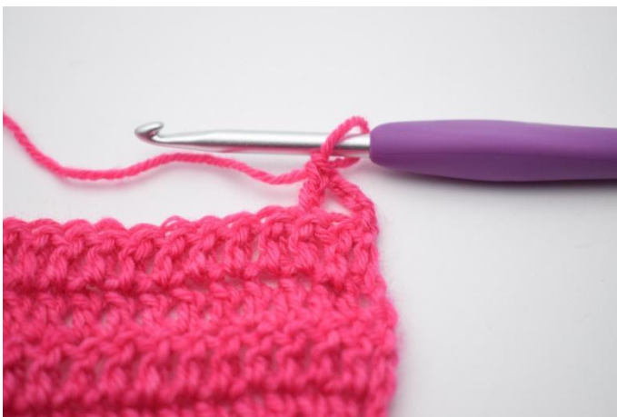
3. Crocheter 1 b.