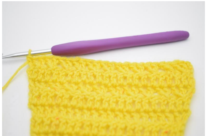
12. Un rang à motif a désormais été croché.

23. Retourner l'ouvrage avec 3 ml. Crocheter 1 b dans la 1ère m. Crocheter 1 b jusqu'à la fin du rang. (25)