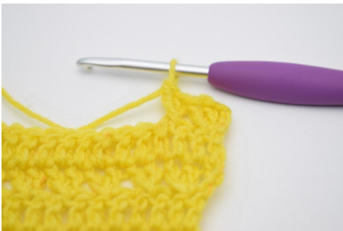
9. Comme ceci.