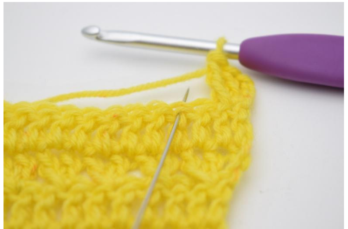
6. Sauter 1 m,