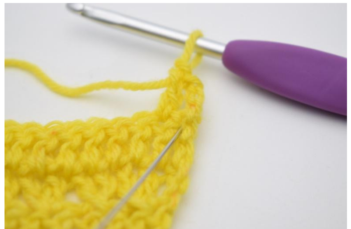
4. Crocheter 1 b dans la m qui vient d'être sautée.