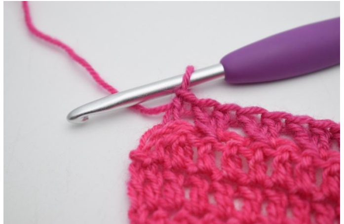
8. crocheter 1 b dans la dernière m.

100. Retourner l'ouvrage avec 3 ml. Crocheter les 2 prochaines m ens. Crocheter des b le reste du rang. (93)