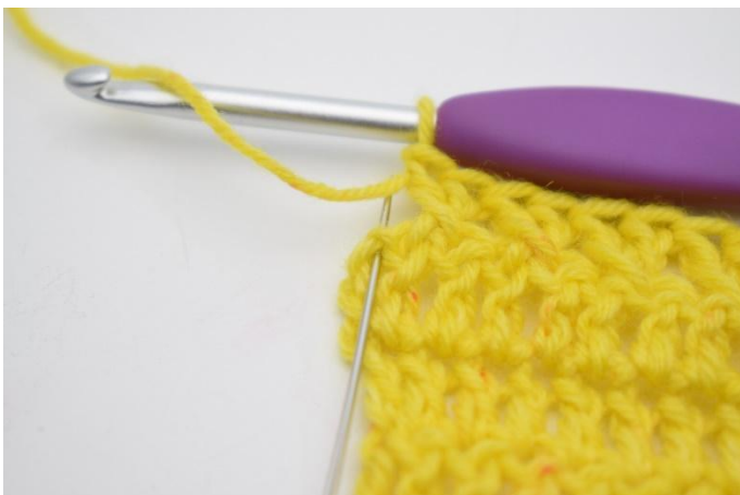
11. Crocheter 1 b dans la dernière m.