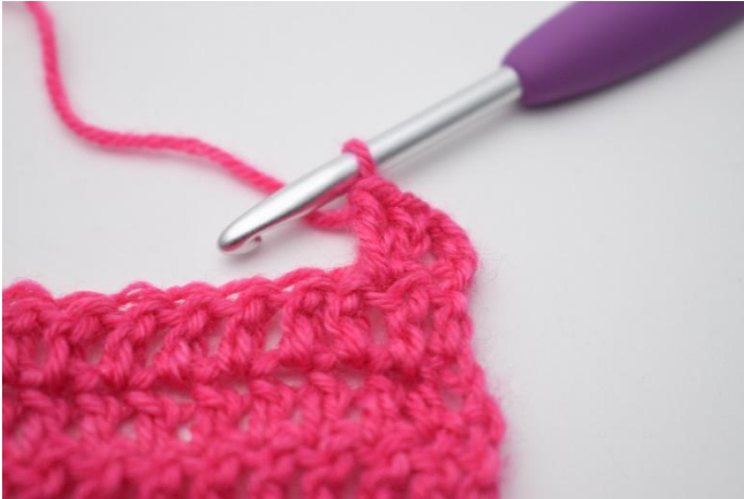
5. Comme ceci.