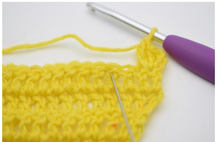
6. Sauter 1 m,