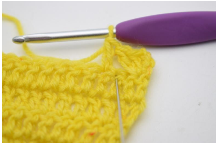
8. Crocheter 1 b dans la m qui vient d'être sautée.