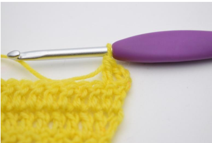
3. Crocheter 1 b.