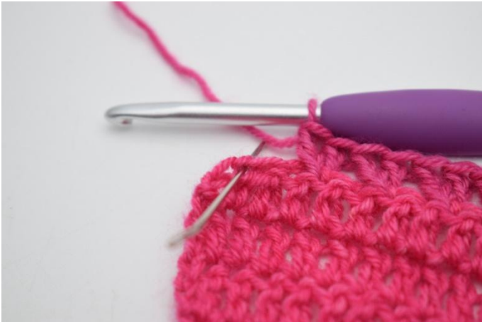
7. Sauter 1 m,