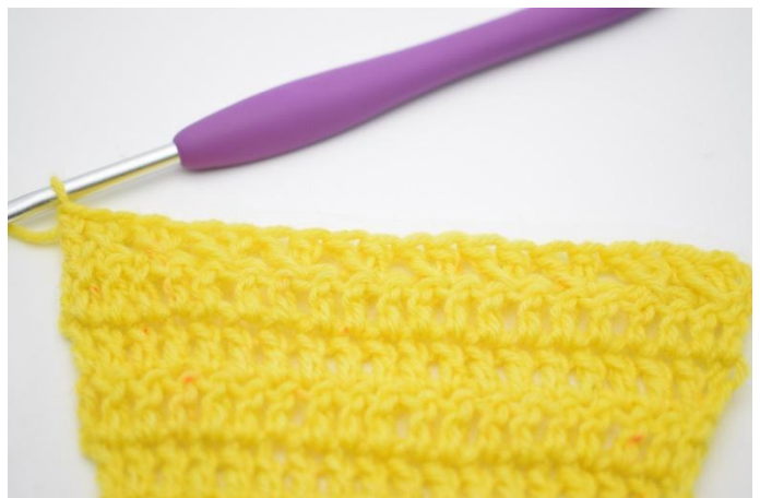
12. Comme ceci.

21. Crocheter maintenant 1 rang avec des augmentations comme plus tôt. Retourner l'ouvrage avec 3 ml. Crocheter 1 b dans la 1ère m. Crocheter 1 b jusqu'à la fin du rang. (23)