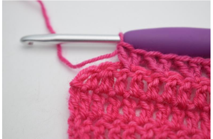
6. Crocheter maintenant le motif normalement. "Sauter 1 m et crocheter 1 b dans la prochaine m. Crocheter 1 b dans la m qui vient d'être sautée." Répéter de "à" le reste du rang jusqu'à ce qu'il reste 2 m.