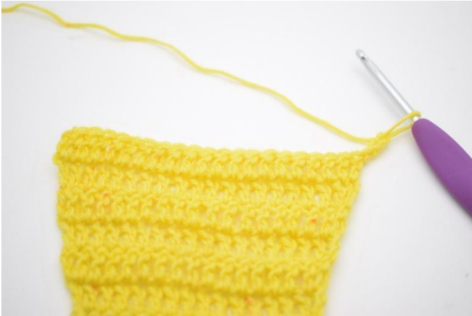
1. Retourner le travail avec 3 ml.