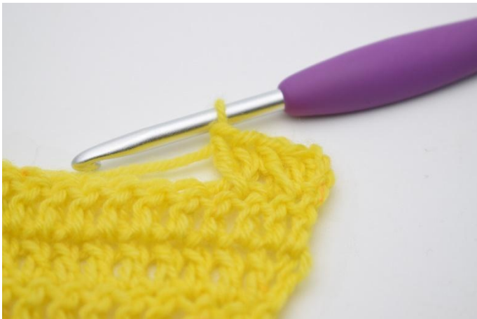
9. Comme ceci.