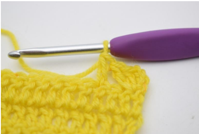
7. crocheter 1 b.