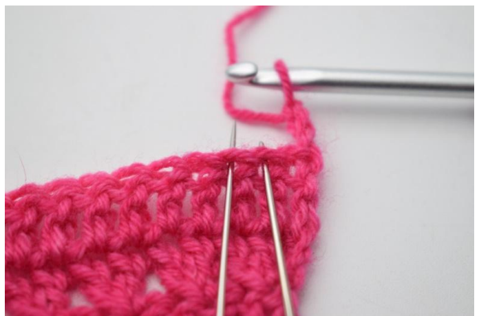
2. Effectuer une diminution en crochant les mailles n°2 et 3 ensemble.