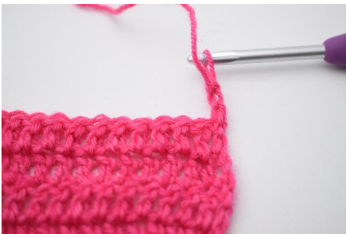
1. Retourner l'ouvrage avec 3 ml.

99. Retourner l'ouvrage avec 3 ml. Sauter 2 m et crocheter 1 b. Crocheter 1 b dans la m à côté de celle qui vient d'être sautée. "Sauter 1 m et crocheter 1 b dans la prochaine m. Crocheter 1 b dans la m qui vient d'être sautée." Répéter de "à" le reste du rang jusqu'à ce qu'il reste 2 m. Sauter 1 m et crocheter 1 b dans la dernière m. (94)