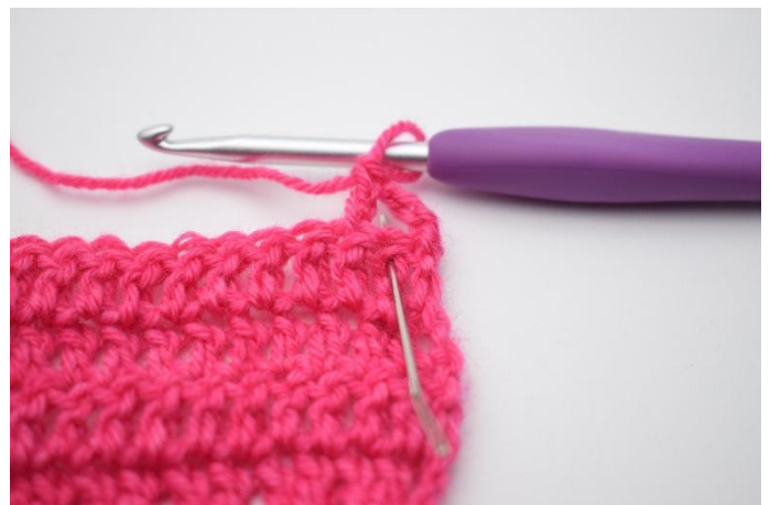
4. Crocheter 1 b dans la 2ème m qui a été sautée.