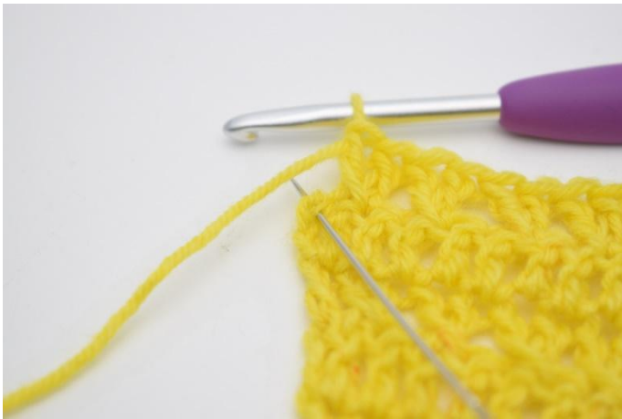
11. Crocheter 1 b dans la dernière m.