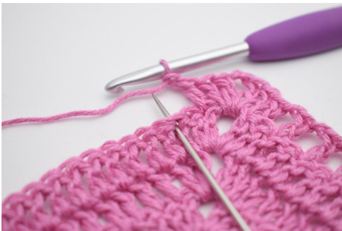
7. *1 ml, sauter 1 m, 1 br dans la m suivante*