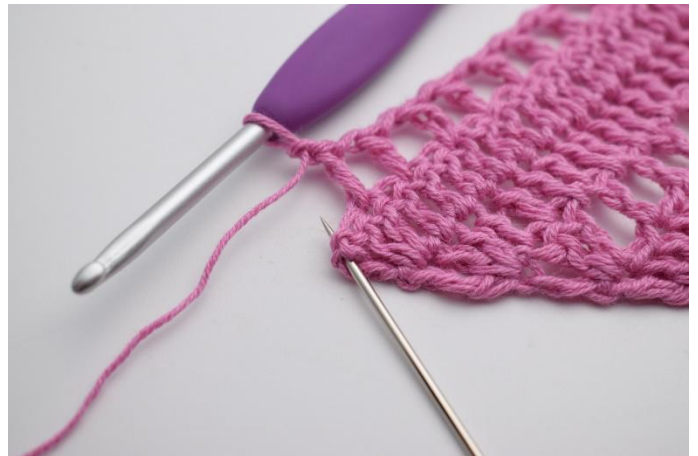
10. 1 ml, sauter 1 m, 2 br et 1 tbr dans la dernière m.