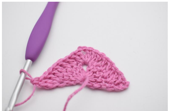
8. Comme ceci.