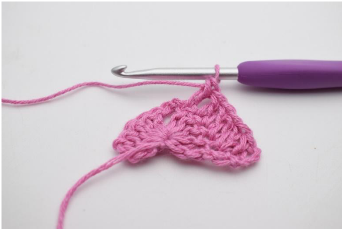
3. 1 br dans les 4 m suivantes.