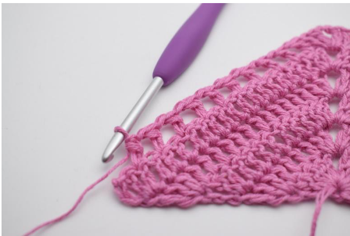
9. Répéter de * à * 9 fois au total.