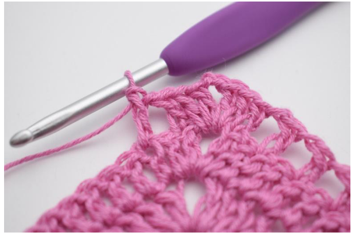
8. Comme ceci.