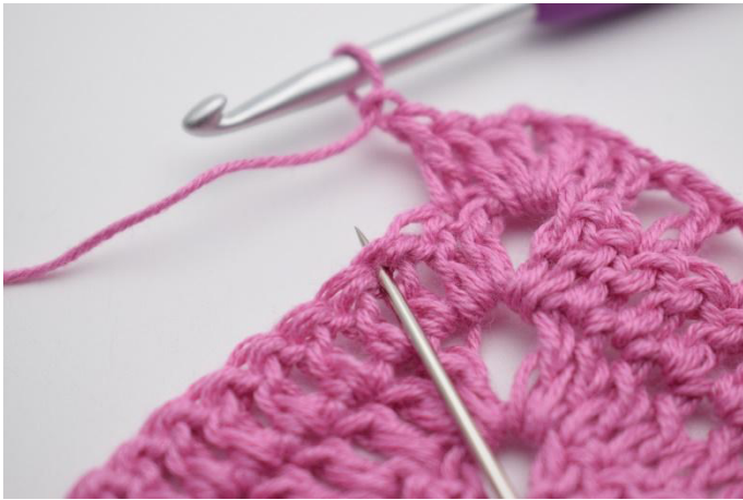
7. *1 ml, sauter 1 m, 1 br dans la m suivante*