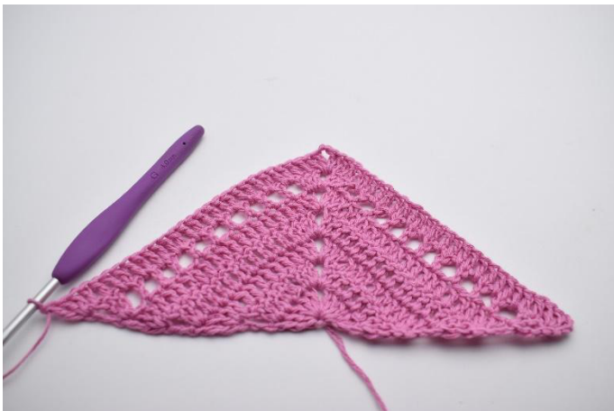
5. 2 br et 1 tbr dans la dernière m.