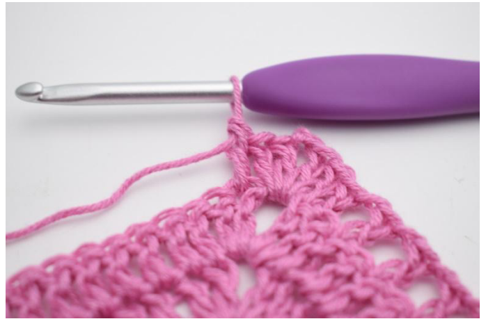
6. 1 br dans la m suivante.