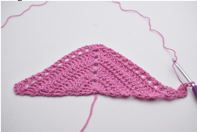
1. 4 ml et tourner. 2 br dans la 1ère m.