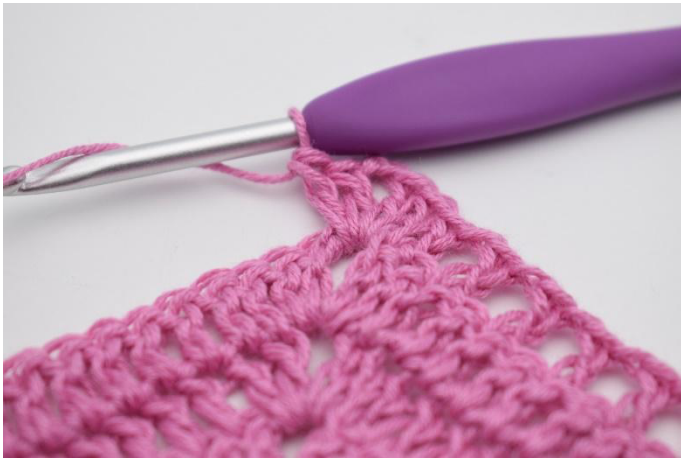
5. 2 br, 2 ml, 2 br dans l'espace de ml.