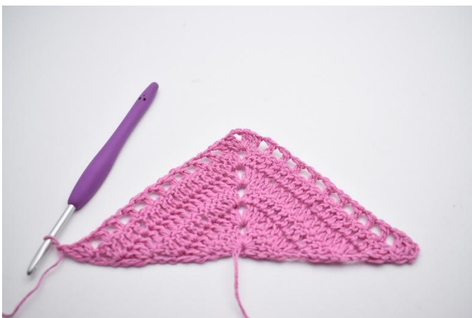
11. Comme ceci.