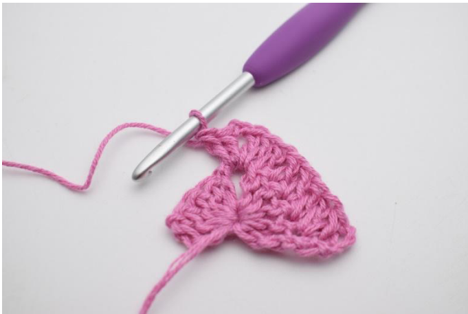
5. Comme ceci.