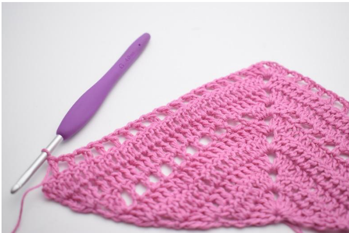
9. Répéter de * à * 15 fois au total.