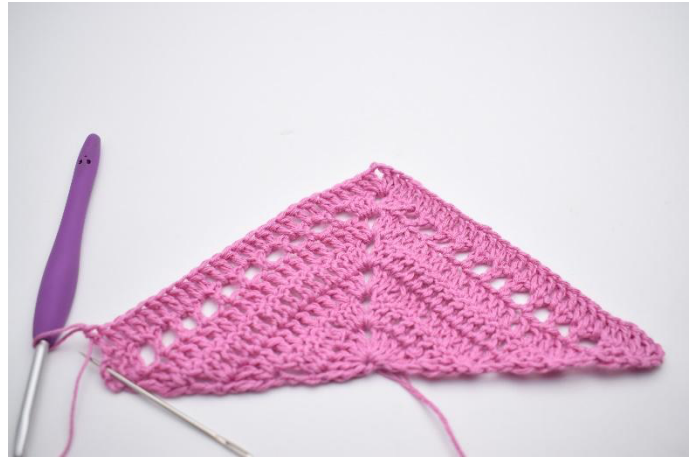
4. 1 br dans les 24 m et espaces de ml.