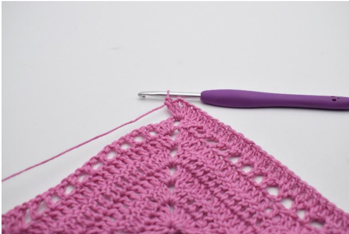
3. 2 br, 2 ml, 2 br dans l'espace de ml.