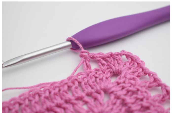
8. Comme ceci.