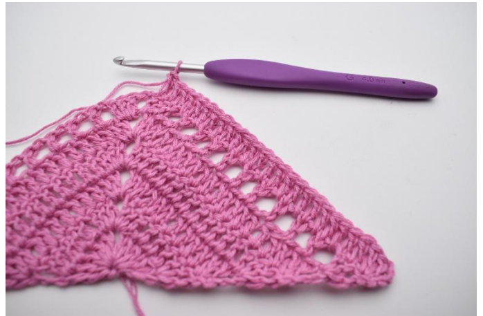
2. 1 br dans les 24 m et espaces de ml.