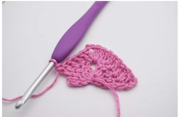
6. 1 br dans les 4 m suivantes.