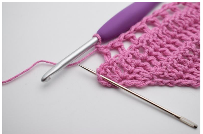
10. 1 ml, sauter 1 m, 2 br et 1 tbr dans la dernière m.