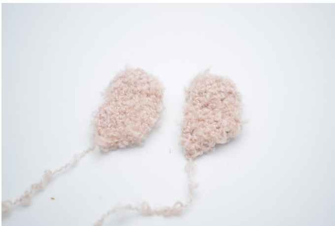
1. Les ailes sont prêtes pour l'assemblage.

Aplatir les ailes et crocheter le bas ensemble.