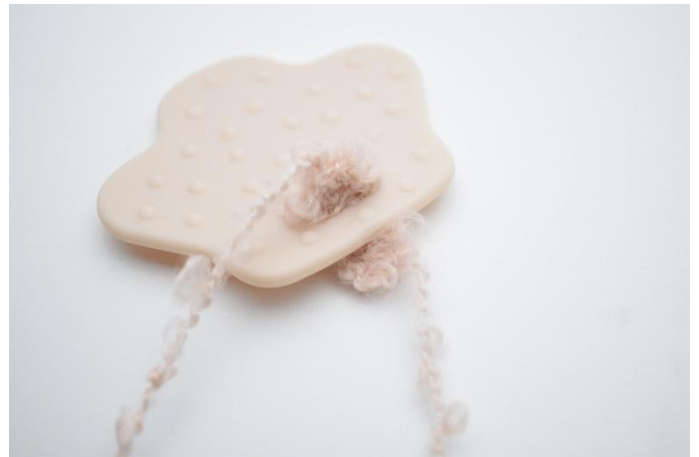
2. Tirer le petit morceau à travers le trou et le plier comme montré sur la photo ici.