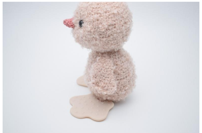
2. Coudre une aile sur le côté, à environ 3 tours en-dessous du cou.