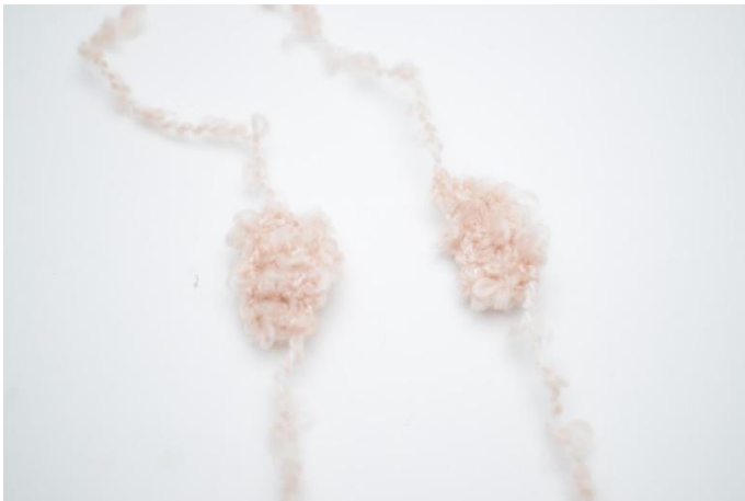
1. Les pieds se montent avec les 2 lanières.