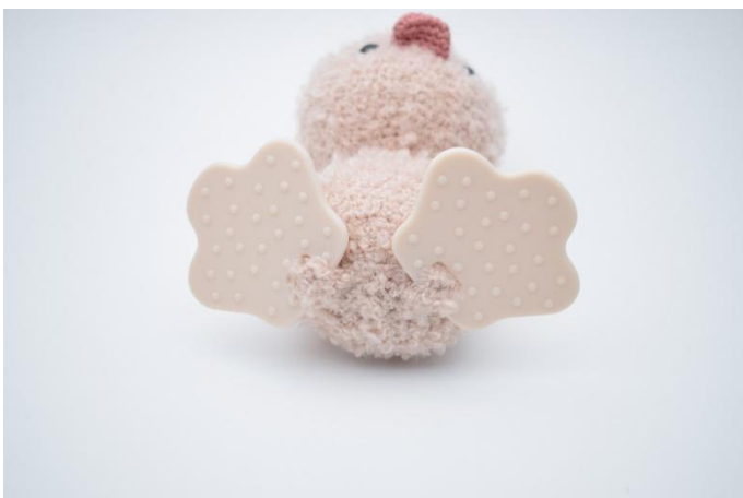
5. Répéter avec l'autre pied.