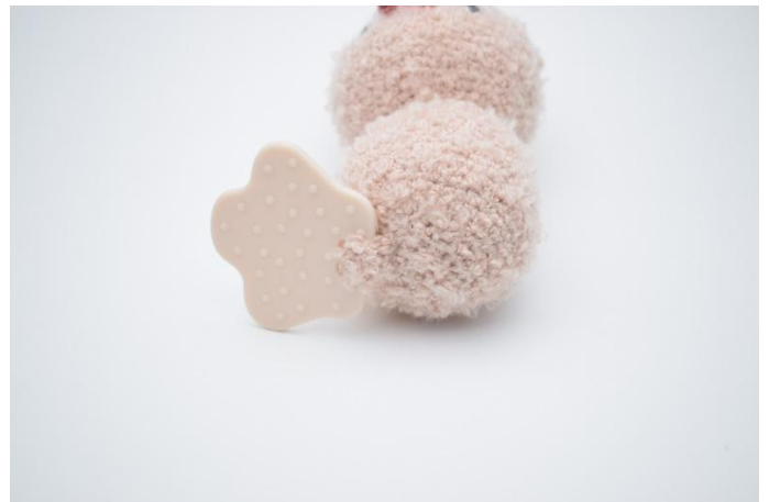
4. et le coudre sous le canard.