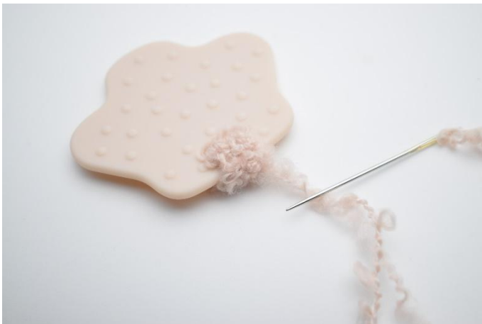
3. Coudre le morceau ensemble,