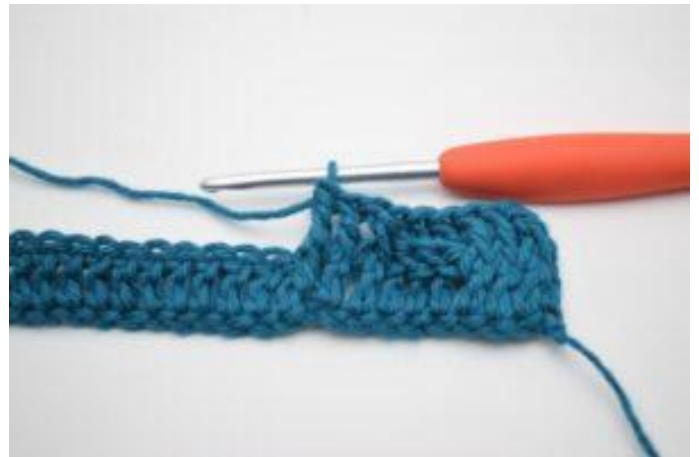
8. Crocheter 1 bRav autour des 3 b suivantes.