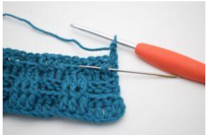
2. Crocheter 1 bRav autour de la première b.