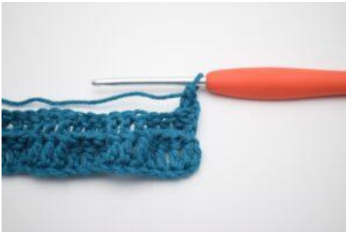
3. Comme ceci.