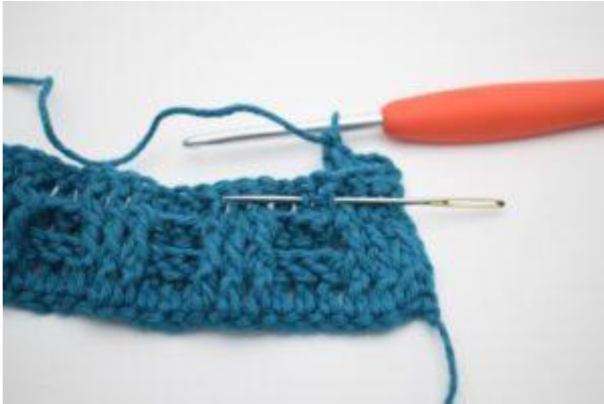
5. Crocheter 1 bRav autour de la b suivante.