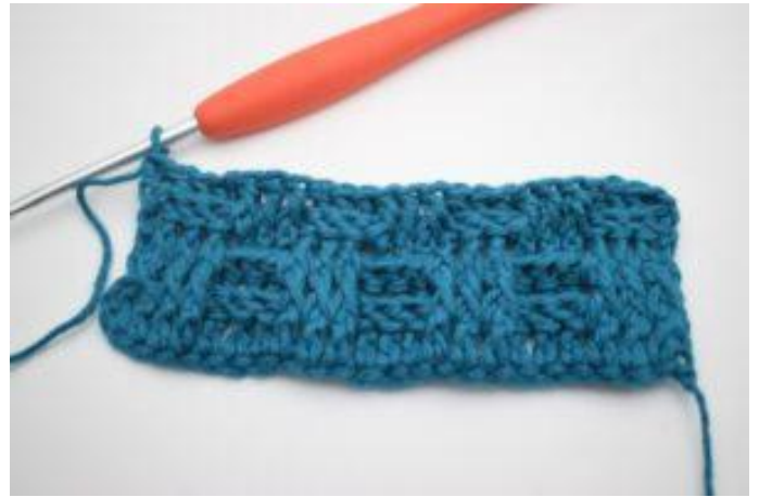
8. Répéter en alternant 3 bRar et 3 bRav tout le rang. Le rang se termine par 3 bRar. Crocheter 1 b normale dans la dernière m.