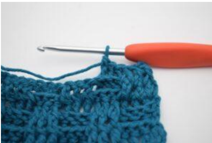
7. Crocheter 1 bRar autour des 2 b suivantes.