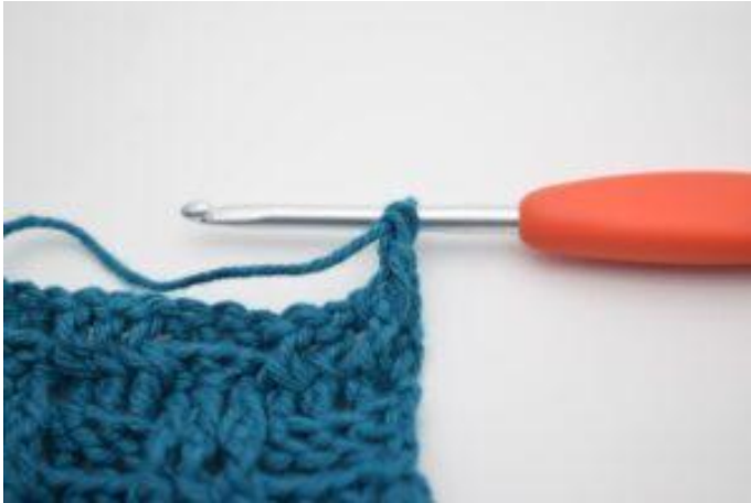
3. Comme ceci.