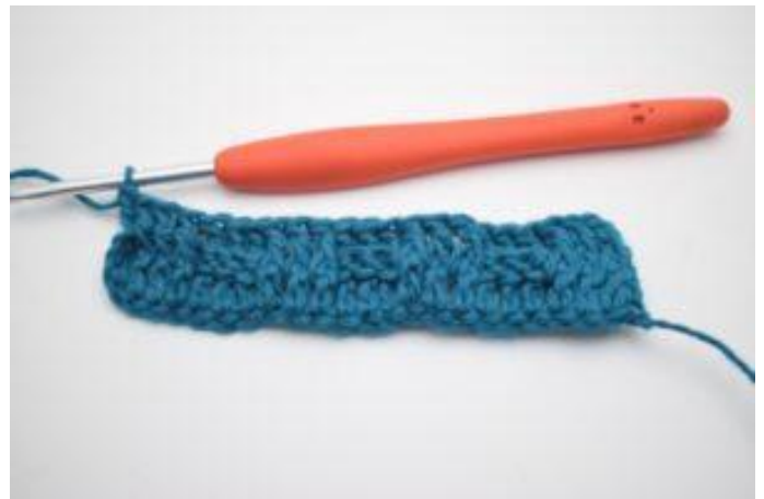
12. Comme ceci.