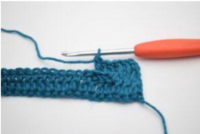
7. Crocheter 1 bRar autour des 2 b suivantes.