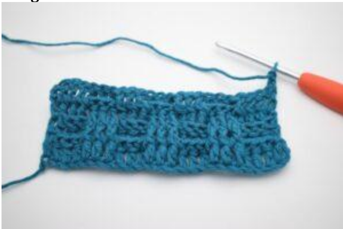
1. Retourner avec 2 ml.