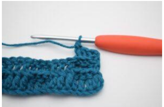
4. Crocheter 1 bRar autour des 2 b suivantes.