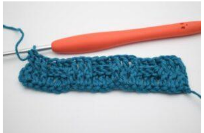
10. Répéter en alternant 3 bRav et 3 bRar tout le rang. Le rang se termine par 3 bRav.