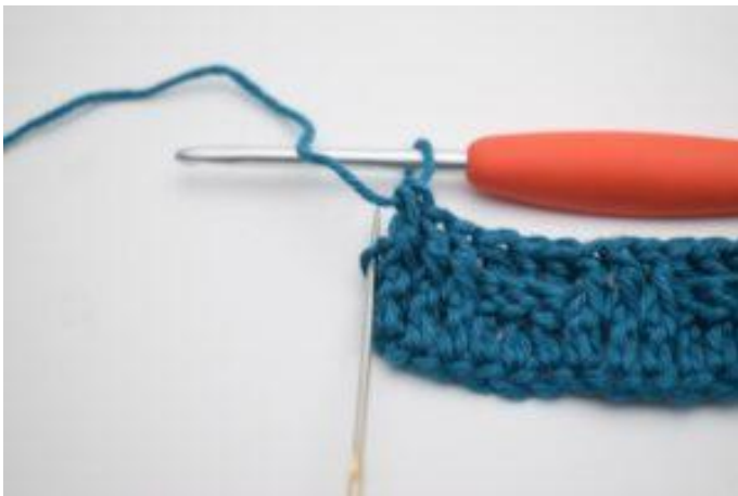
11. Crocheter 1 b normale dans la dernière m.