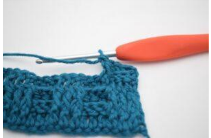
6. Comme ceci.