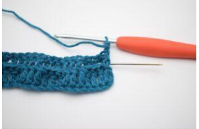
2. Crocheter 1 bRar autour de la première b.