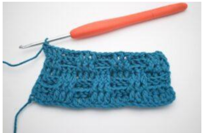
8. Répéter en alternant 3 bRav et 3 bRar tout le rang. Le rang se termine par 3 bRav. Crocheter 1 b normale dans la dernière m.