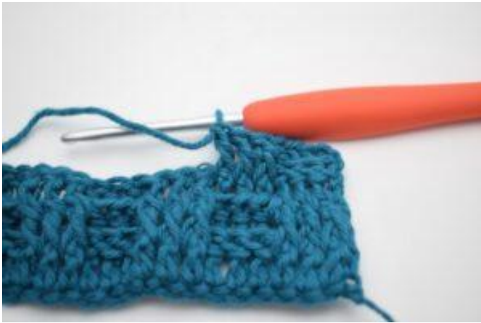
7. Crocheter 1 bRav autour des 2 b suivantes