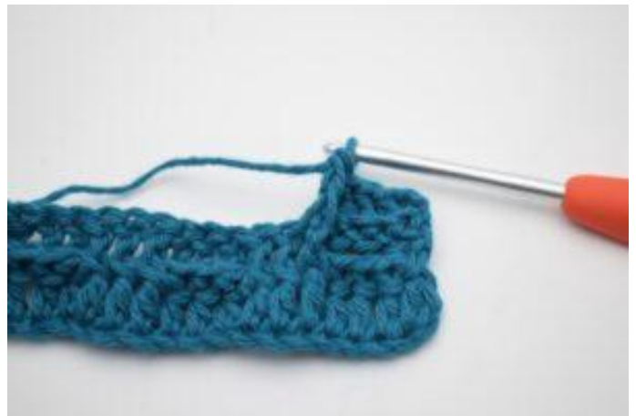
6. Comme ceci.