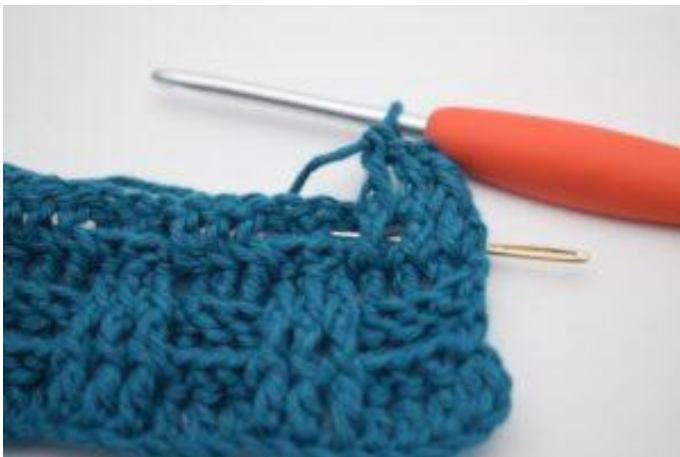
5. Crocheter 1 bRar autour de la b suivante.