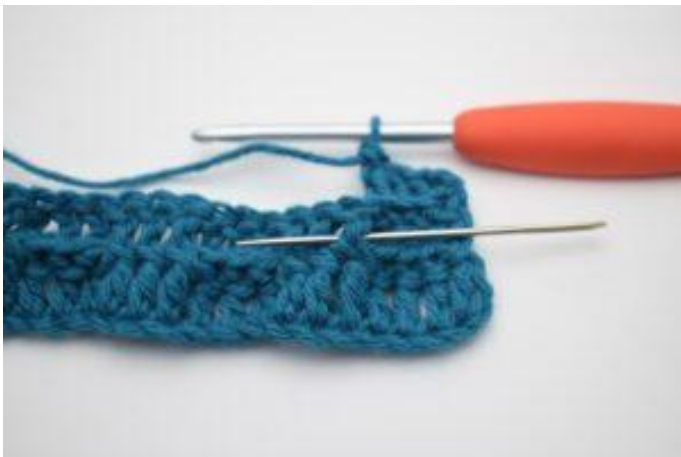
5. Crocheter 1 bRav autour de la b suivante.