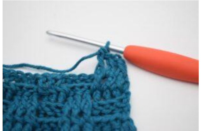
4. Crocheter 1 bRav autour des 2 b suivantes.