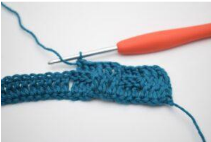
9. Crocheter 1 bRar autour des 3 b suivantes.