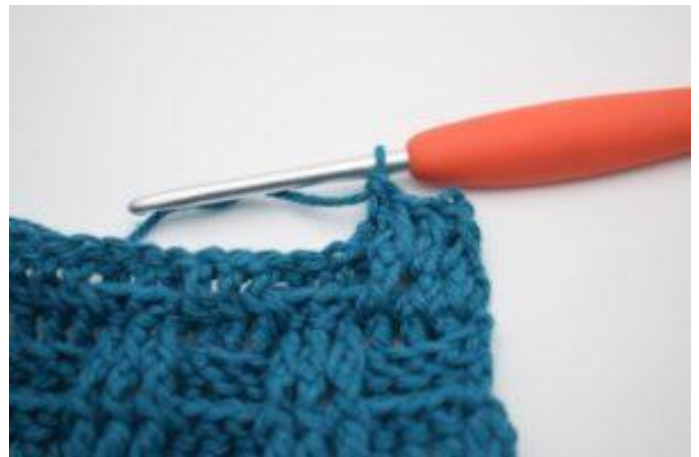
6. Comme ceci.