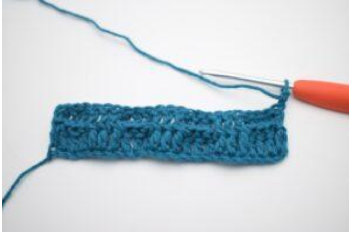
1. Retourner avec 2 ml.