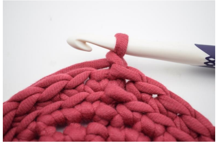
8. Faire 1 ml.