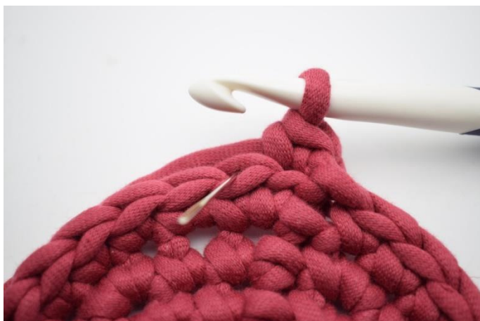
5. Faire 1 ms Bar dans la mm suivante. L'aiguille montre où insérer le crochet.