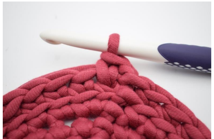
10. Comme ceci. Il y a maintenant 1 mj.