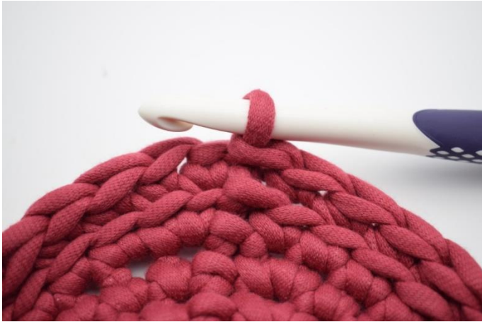
7. Répéter tout le tour et finir avec 1 mc.