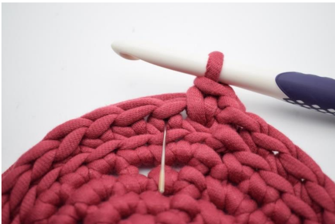
11. Crocheter 1 mj dans le "v" suivant. L'aiguille montre où insérer le crochet.