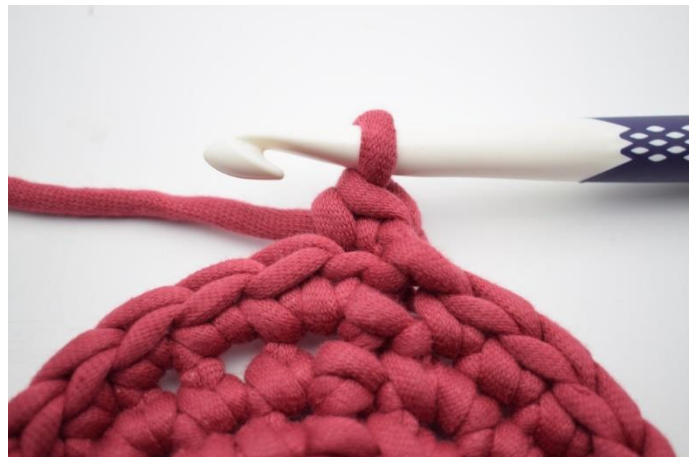
4. Comme ceci.