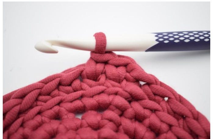
12. Comme ceci.