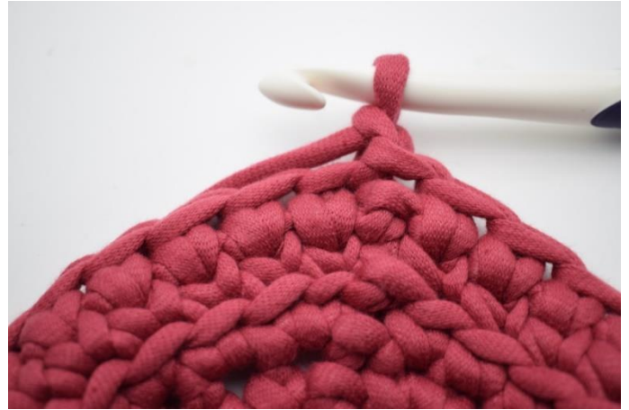
14. Faire 1 ml. Et répéter ce rang.