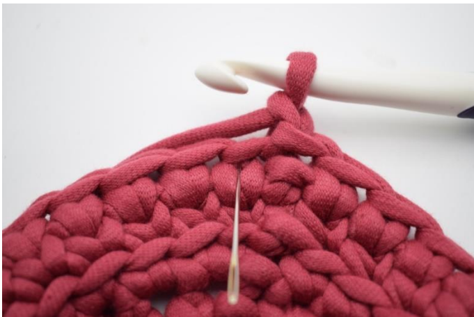
15. Crocheter 1 mj dans le premier "v".