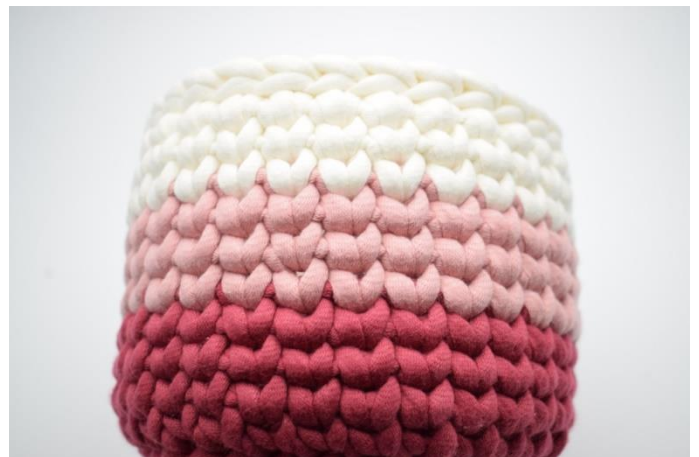
18. Répéter ce tour comme décrit dans le tutoriel écrit. Finir avec un tour de mc. Couper le fil et le cacher.