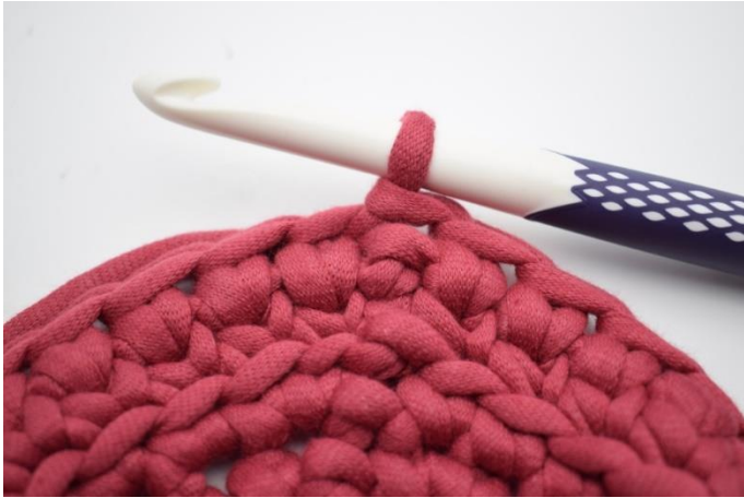
13. Répéter tout le tour et finir avec 1 mc.