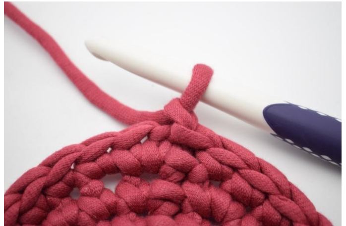
2. Faire 1 ml.