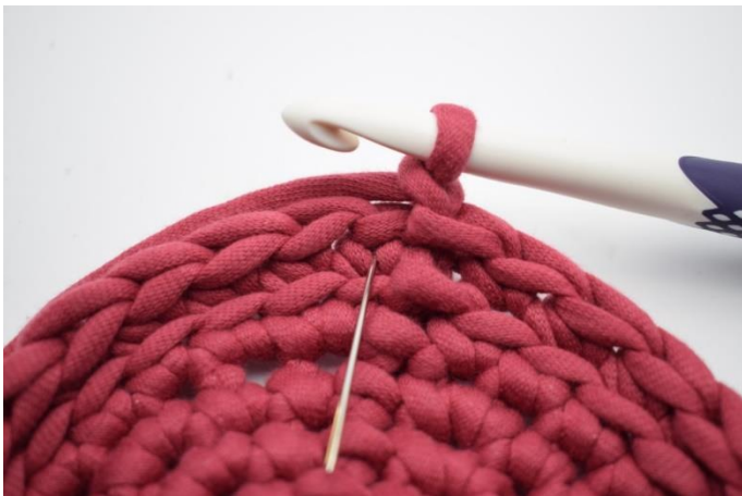
9. Ce tour doit être crocheter en mj. Une mj est une ms normale mais crocheter dans le "v" au lieu du haut de la m. L'aiguille indique le "v" où vous devez insérer le crochet.