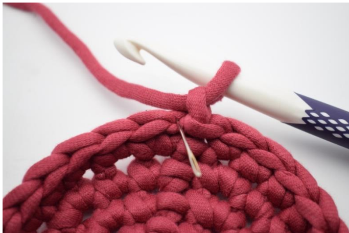
3. Crocheter un tour de ms Bar dans chaque m. L'aiguille montre où insérer le crochet.