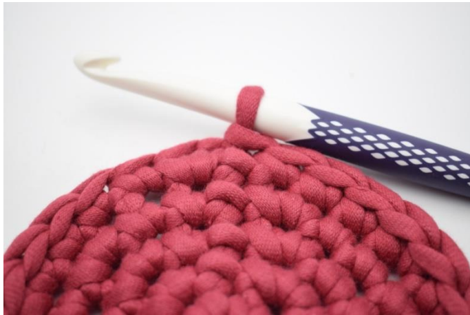
1. Voilà à quoi doit ressembler la base une fois terminée.