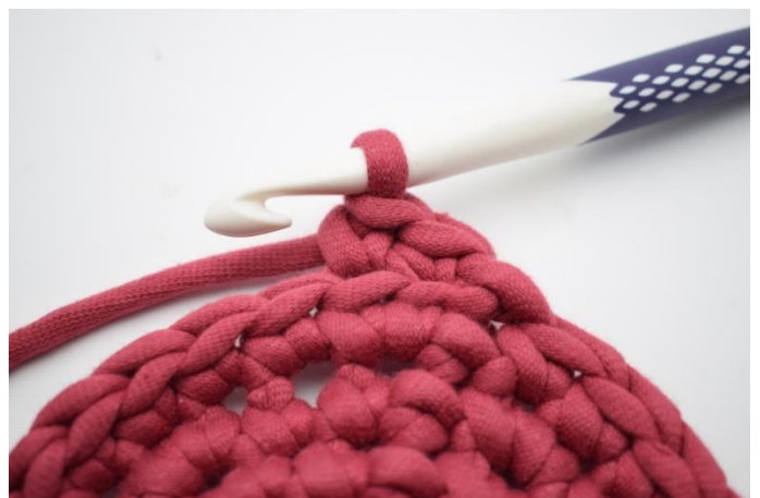
6. Comme ceci.