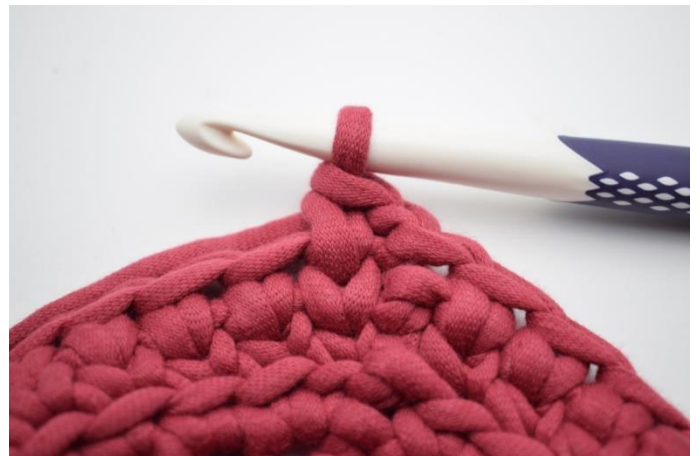
16. Comme ceci.