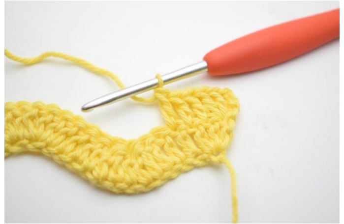
4. Faire 1 br dans les 3 m suivantes.