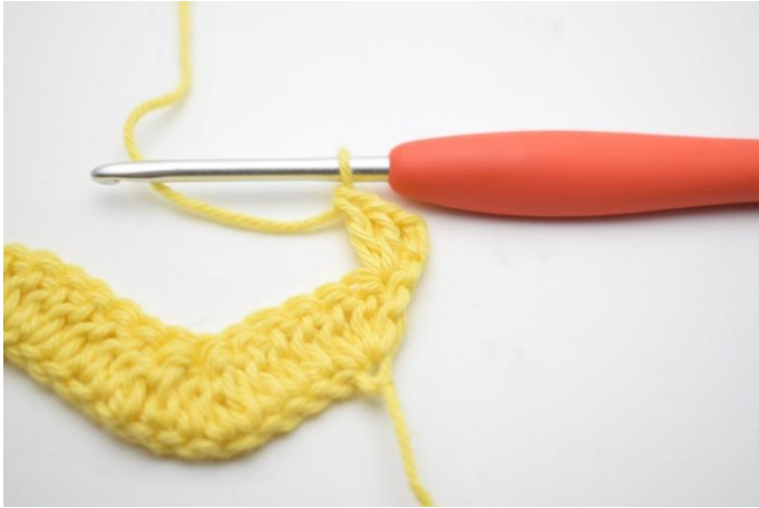
3. Comme ceci.