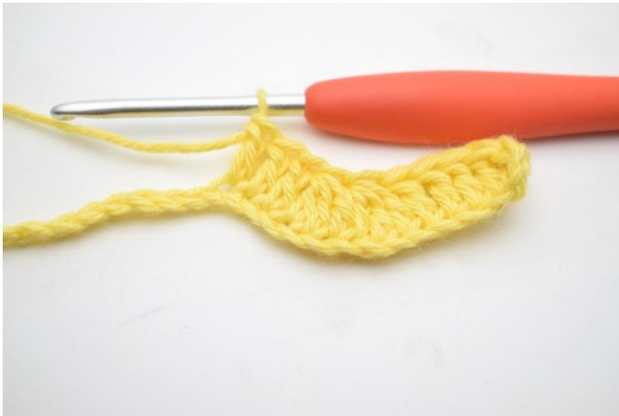
7. Travailler 1 br dans les 3 ml suivantes.