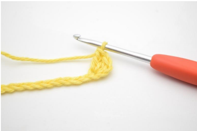
3. Comme ceci.