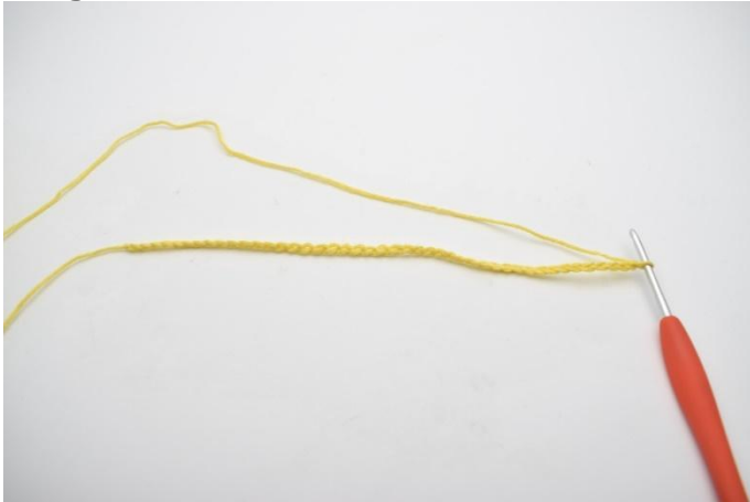
1. Monter 58 ml.