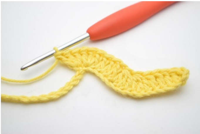
9. Répéter et faire 3 br dans la ml suivante.