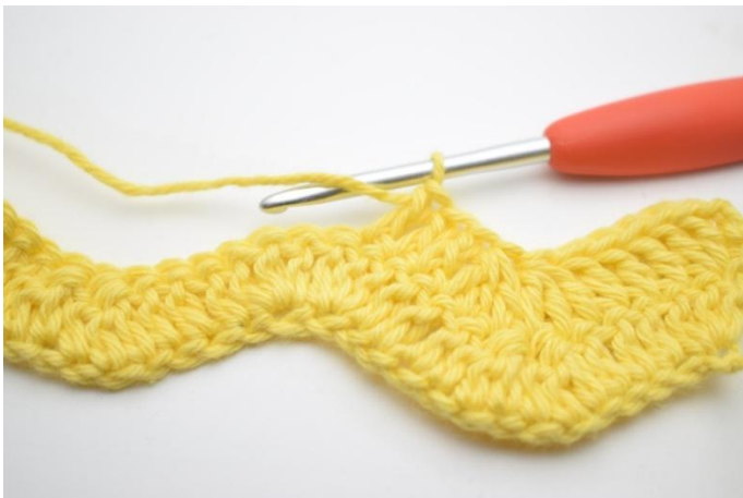
7. Faire 1 br dans les 3 m suivantes.