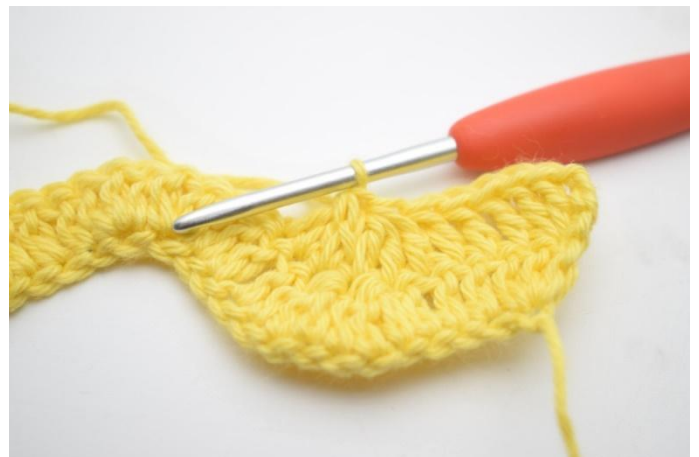
6. Répéter et faire 3 br ens dans les 3 m suivantes.