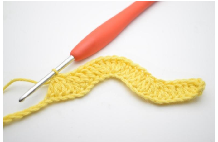
10. Travailler 1 br dans les 3 ml suivantes. "Faire 3 br ens dans les 3 ml suivantes". Répéter de " à " 2 fois au total.