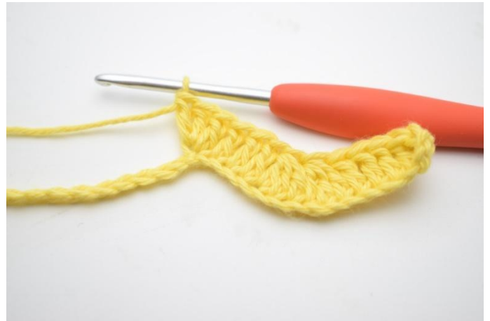
8. Faire 3 br dans la ml suivante.