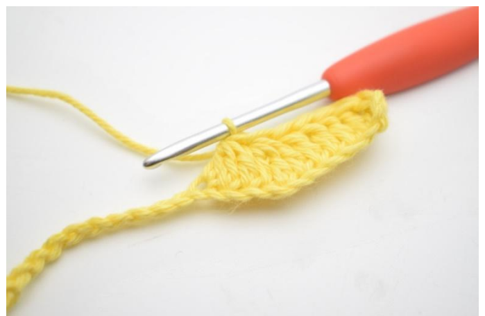
6. Répéter et faire 3 br ens dans les 3 ml suivantes.