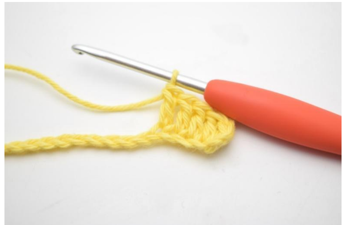
4. Travailler 1 br dans les 3 ml suivantes.