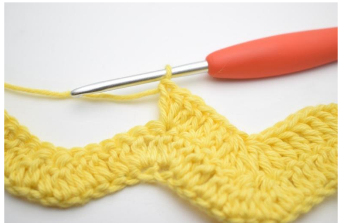
8. Faire 3 br dans la m suivante.