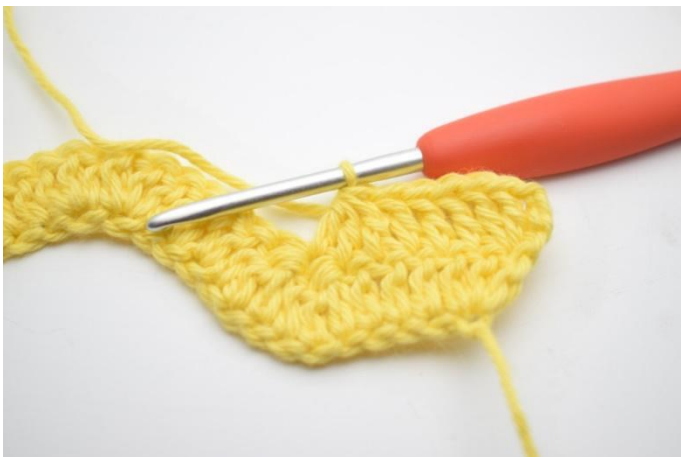
5. Faire 3 br ens dans les 3 m suivantes.