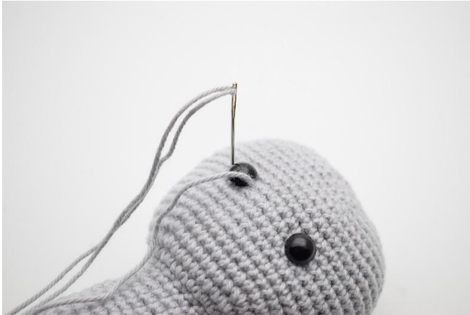
5. Puis la piquer à nouveau à gauche de l'oeil.