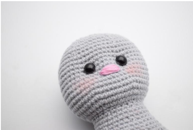
7. Coudre le museau comme sur la photo. Il est cousu sur 2-3 m.