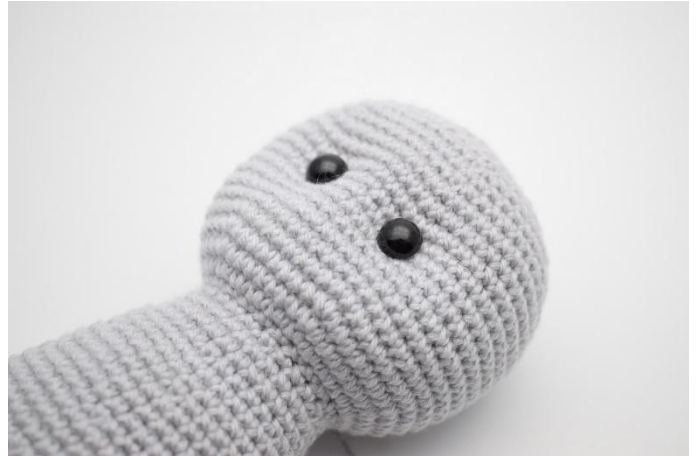
6. Tirer doucement pour créer le renforcement et donner au lapin une expression mignonne.