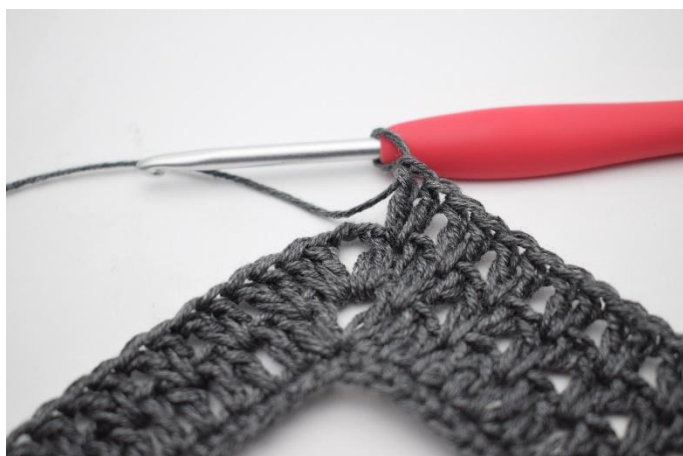
4. Crocheter "2 b entre les 2 b suivantes, sauter 1 m". Répéter de "à" en tout 36 fois.