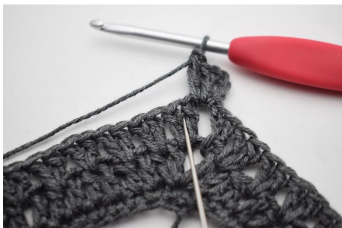
2. Crocheter 2 b entre les 2 premières b.