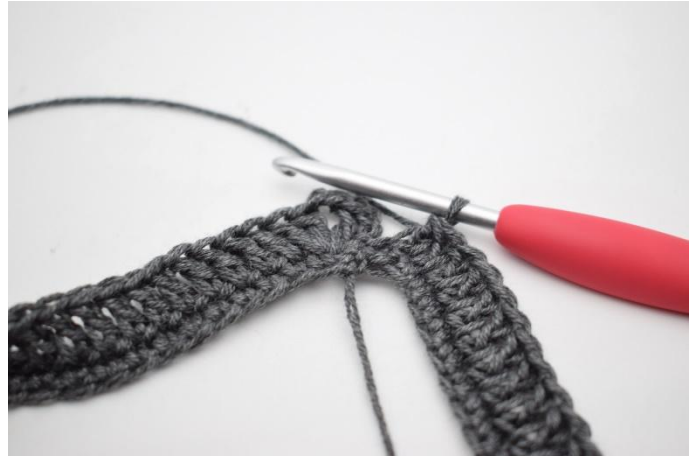
4. Crocheter 1 b dans les 64 dernières m.