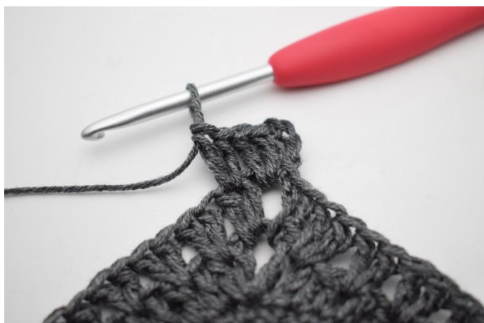
3. Comme ceci.