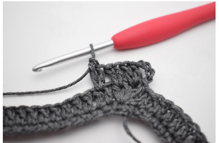
6. Comme ceci.