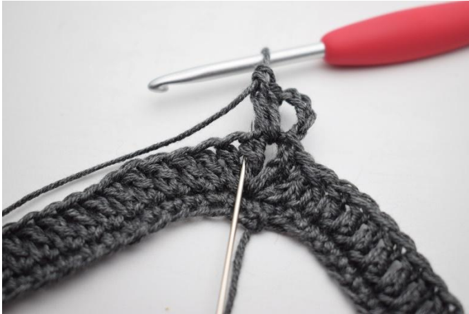
3. Crocheter 2 b entre les 2 b suivantes. L'aiguille ici indique où crocheter votre b.