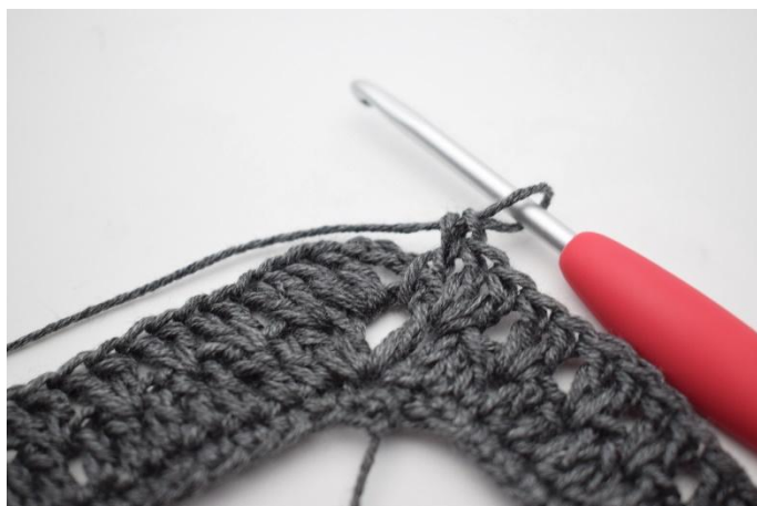
15. Comme ceci.