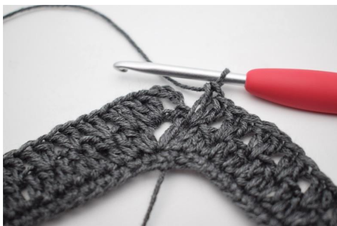
13. Crocheter "2 b entre les 2 b suivantes, sauter 1 m." Répéter de "à" en tout 34 fois.