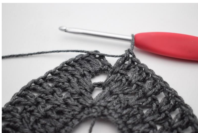
8. Crocheter "2 b entre les 2 b suivantes, sauter 1 m". Répéter de "à" en tout 36 fois.