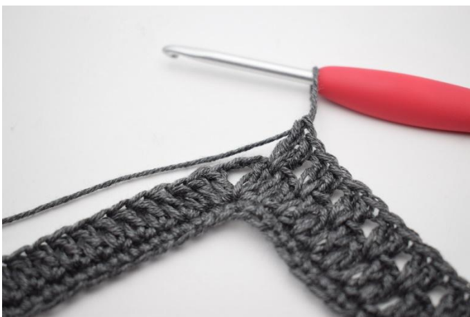
7. Crocheter "2 b entre les 2 b suivantes, sauter 1 m. Répéter de "à" en tout 34 fois.