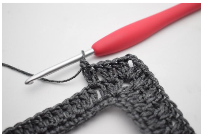
12. Comme ceci.