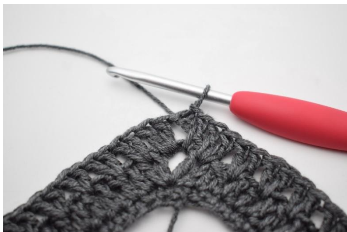
16. Finir avec 1 mc.