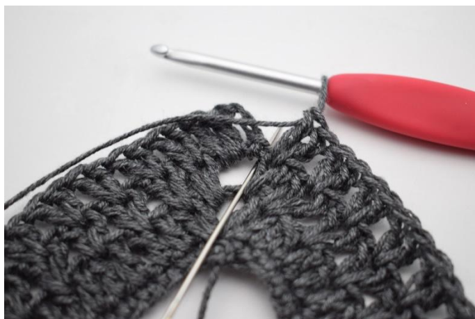
9. Crocheter 1 b dans l'arceau du début du tour.