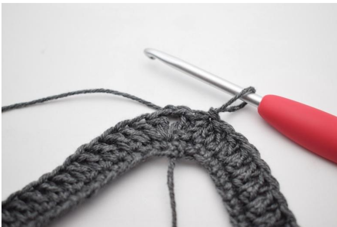
5. Finir avec 1 mc.