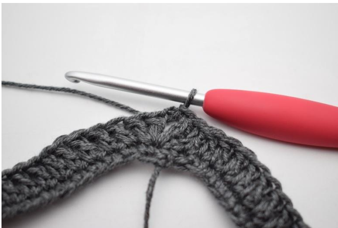
1. Faire des mc jusqu'à l'arceau.