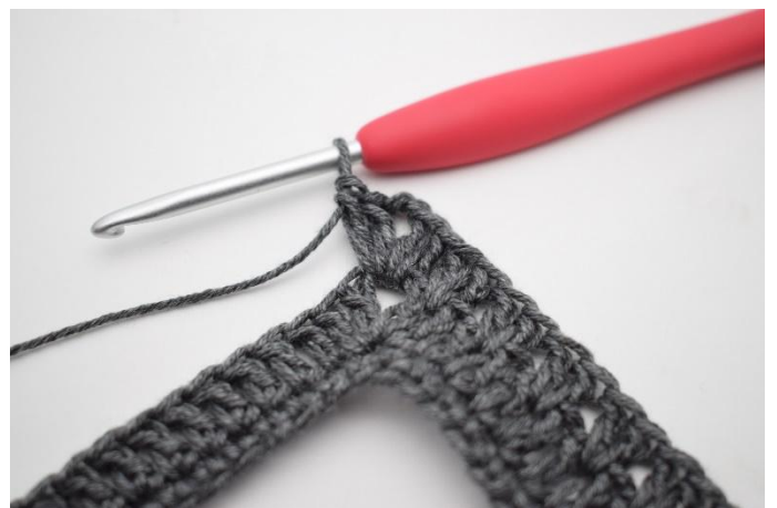
8. Crocheter 2 b, 2 ml, 2 b dans l'arceau.