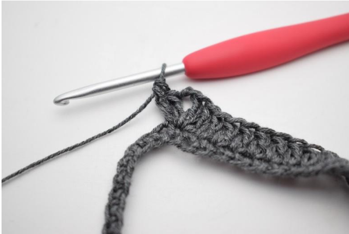
3. Dans la m suivante, crocheter 2 b, 2 ml et 2 b.