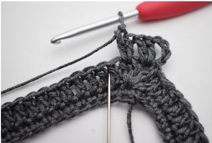
5. Sauter 1 m et crocheter 2 b entre les 2 b suivantes.