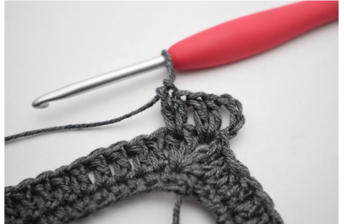
4. Comme ceci.