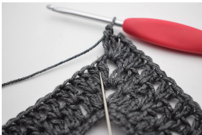
6. Crocheter 2 b entre les 2 premières b.