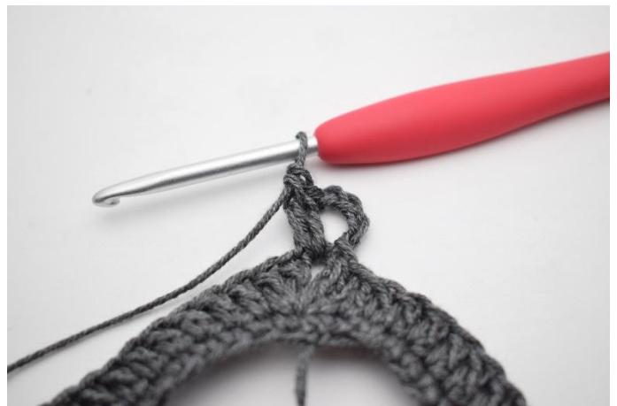
2. Faire 5 ml et crocheter 2 b dans l'arceau.