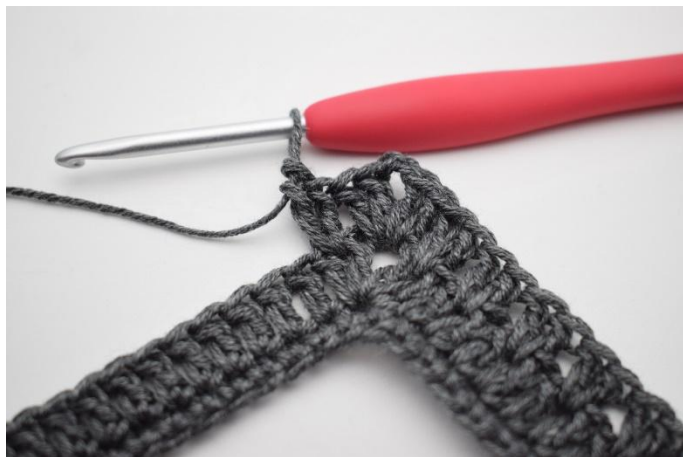
10. Comme ceci.