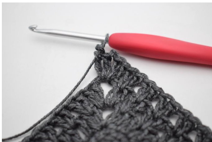
5. Crocheter 2 b, 2 ml, 2 b dans l'arceau.