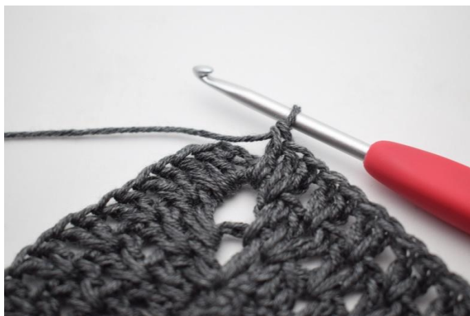
10. Comme ceci.