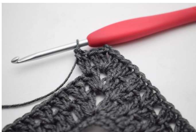
7. Comme ceci.