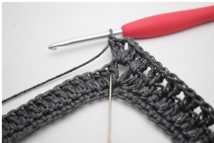
9. Crocheter 2 b entre les 2 premières b. L'aiguille indique ici où crocheter votre b.