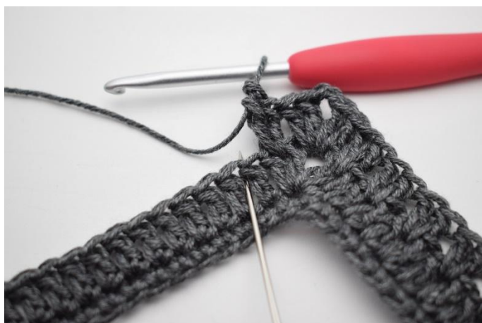
11. Sauter 1 m et crocheter 2 b entre les 2 b suivantes.