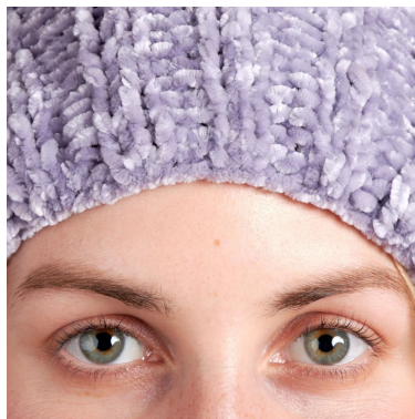
Bordure de montage