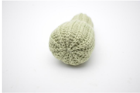
10. Rentrer le fil.