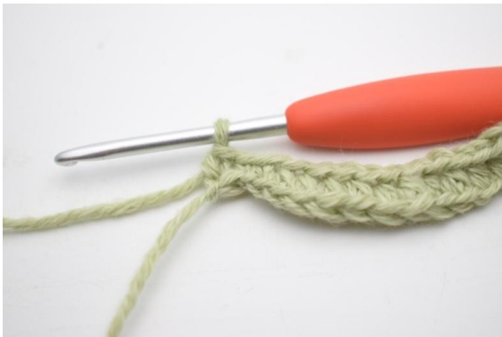
7. Crocheter 1 ms dans les 2 (3) dernières ml.