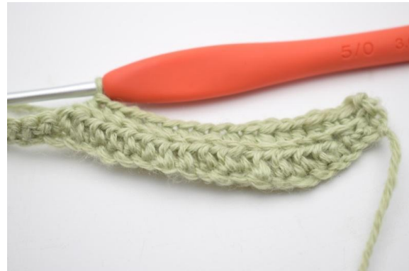
4. Crocheter 1 db dans les 11 (15) m suivantes.