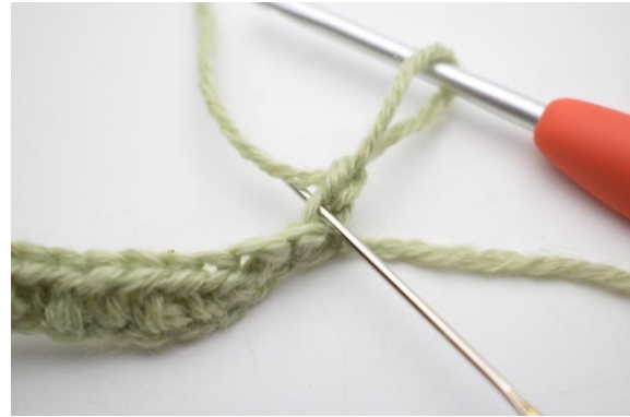
2. A partir de maintenant, ne crocheter QUE