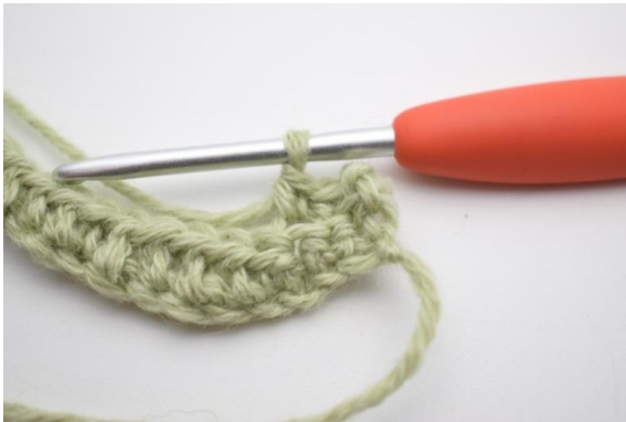
3. Crocheter 1 ms dans les 2 (3) premières m.