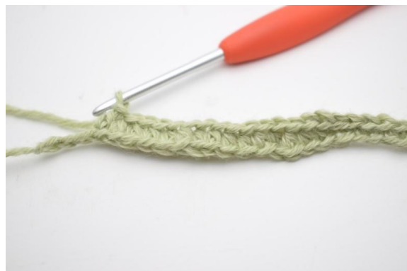
6. Crocheter 1 db dans les 11 (15) ms suivantes.