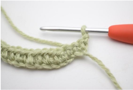
1. Retourner avec 1 ml.