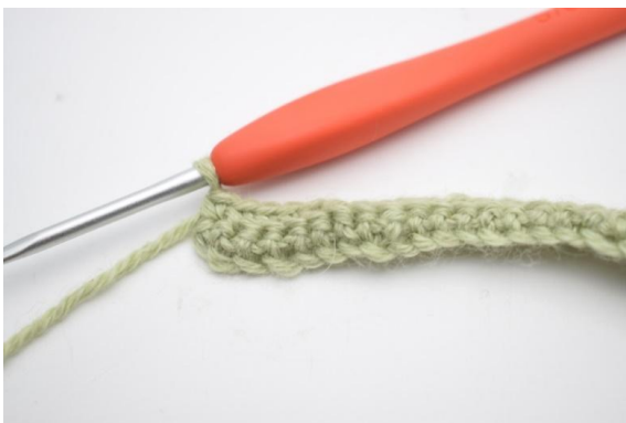
5. Crocheter 1 ms dans les 12 (17) dernières m.