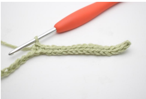
5. Crocheter 1 ms dans les 11 (16) ml suivantes.