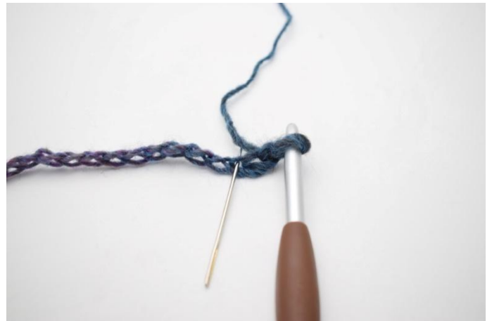
2. Crocheter 1 db dans la 3ème ml depuis le crochet.