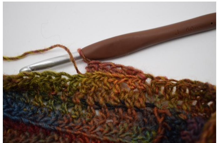
8. Crocheter des db dans les ba tout le tour.