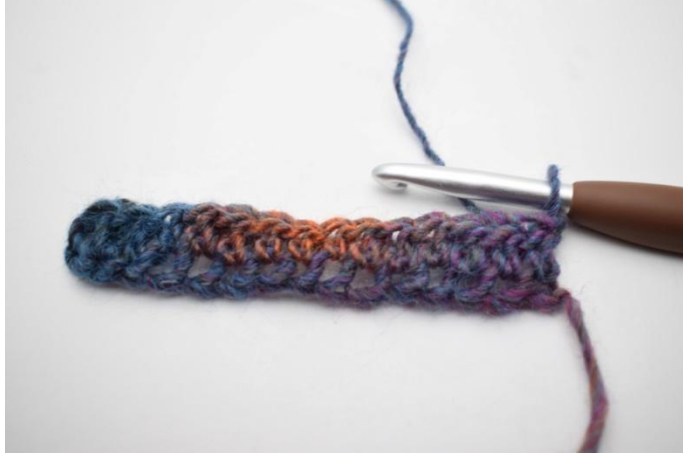
5. Retourner avec 1 ml.