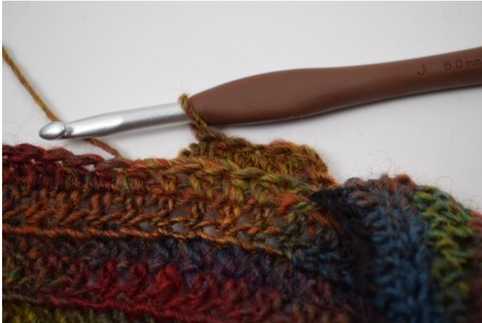
5. Faire 1 ml. Crocheter des db dans les ba tout le tour.