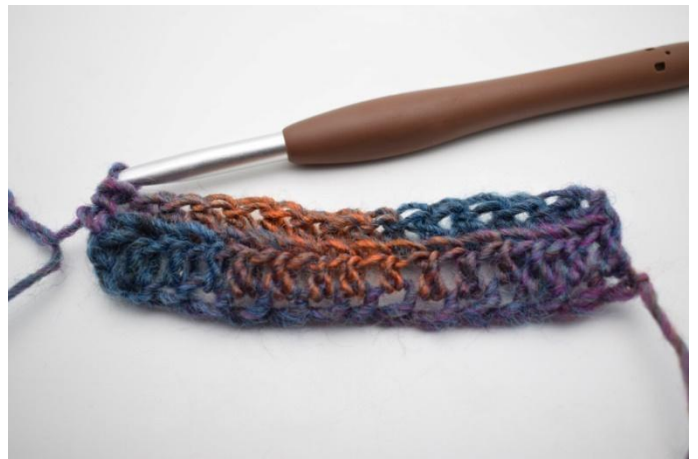
8. Crocheter des db dans les ba tout le rang.