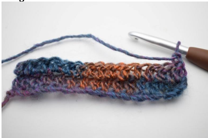
9. Retourner avec 1 ml.