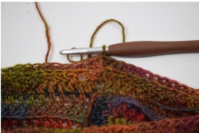
9. Finir avec 1 mc dans la première db.