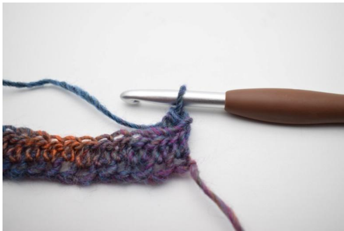
7. Comme ceci.