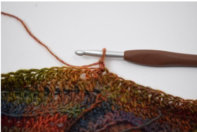
7. Retourner l'ouvrage avec 1 ml.