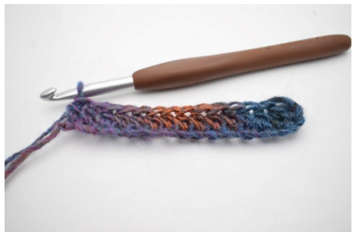
4. Crocheter des db tout le rang.