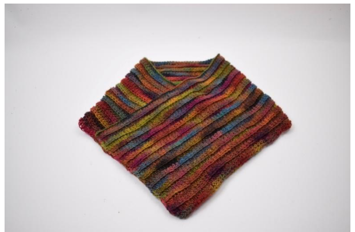
2. Plier l'autre côté sur le premier côté afin qu'ils se superposent de 30 mailles.