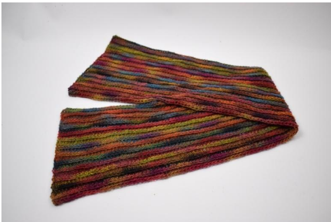
13. Répéter ce procédé jusqu'à avoir en tout 26 rangs; couper et rentrer le fil.