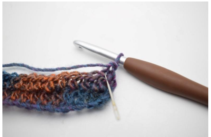
10. Crocheter 1 db dans le ba. L'aiguille indique ici le brin dans lequel crocheter la db.