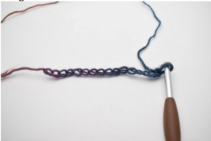
1. Monter les ml.