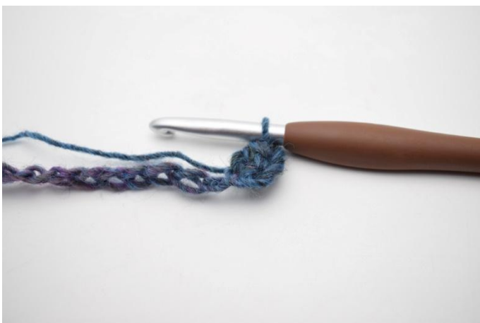
3. Comme ceci.