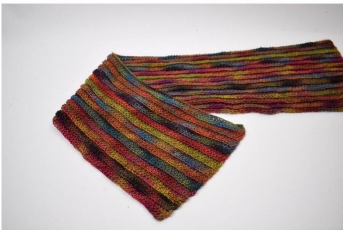
1. Plier une extrémité vers le centre comme montré sur la photo.