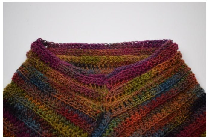
10. Répéter comme décrit dans le modèle jusqu'à avoir en tout 6 tours de db.