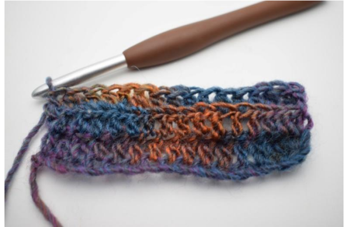
12. Crocheter des db dans les ba tout le rang.