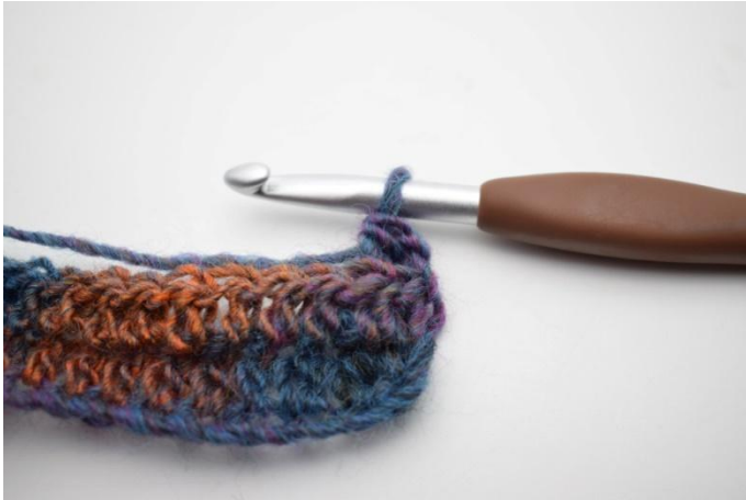
11. Comme ceci.