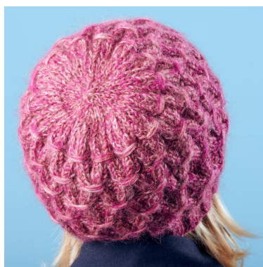
Diminutions sur le dessus