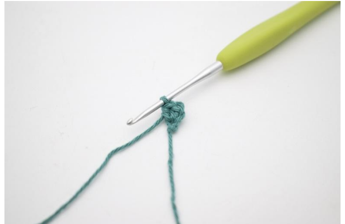
2. Crocheter 2 demi-br dans la 2ème ml à partir du crochet.