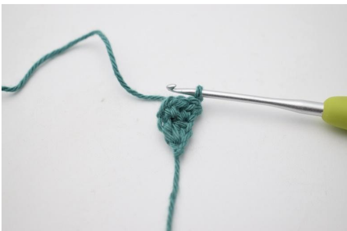
5. Faire 1 ml pour tourner.