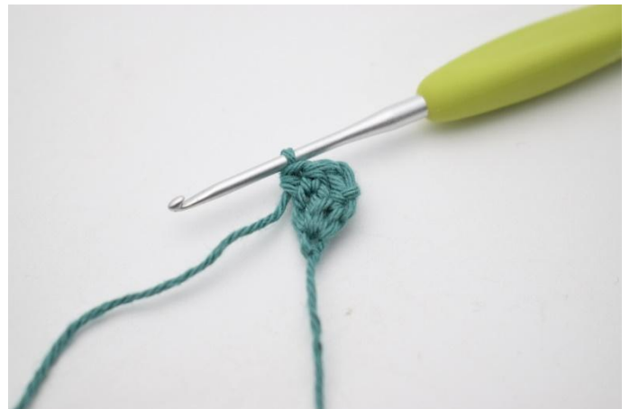
4. Crocheter tous les rangs dans le brin arrière. Crocheter 1 demi-br dans la 1ère m et 2 demi-br dans la dernière m.