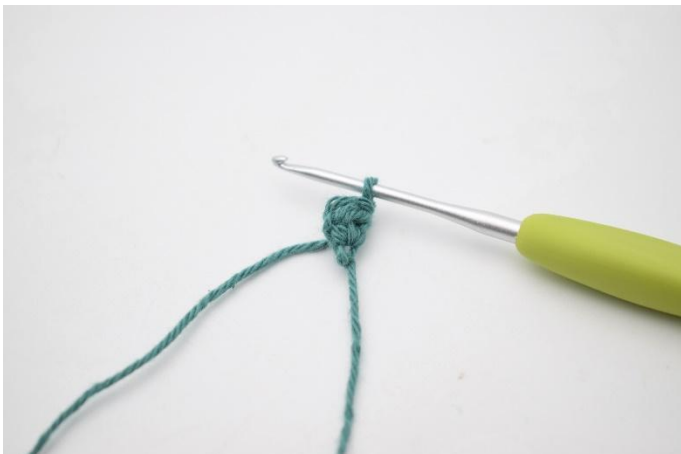
3. Faire 1 ml pour tourner.