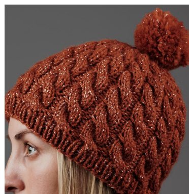
Réflexion avec lumière dans le noir