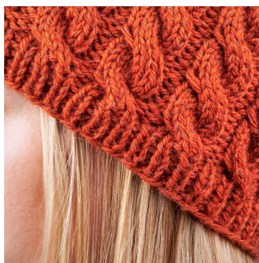
Bordures avec torsades