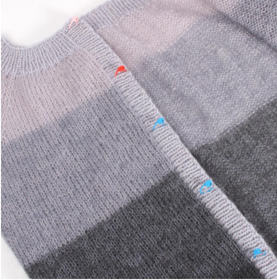
7- Marquer l'emplacement des boutons.