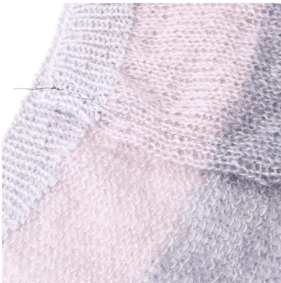
5- Le bord ressemble à ceci à présent.