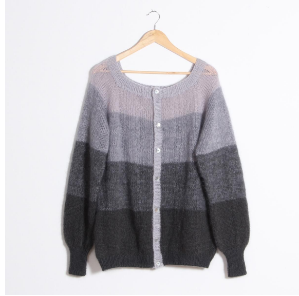
8- Assemblage terminé.