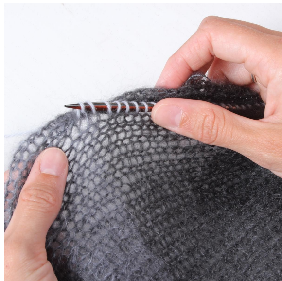
6- Relever les m sur l'endroit le long du bord.