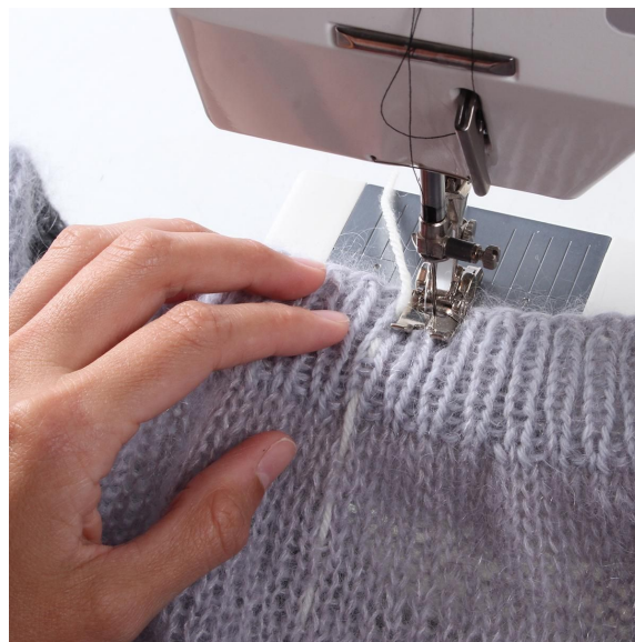
2- Coudre en zig-zag à la machine de chaque côté du fil contraste.