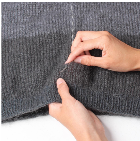
1- Marquer l'endroit où il faut couper. Coudre un fil de couleur contrastante le long de toute la bordure.

Retourner l'envers, et coudre en point lancé la parmenture par dessus les m de découpe.