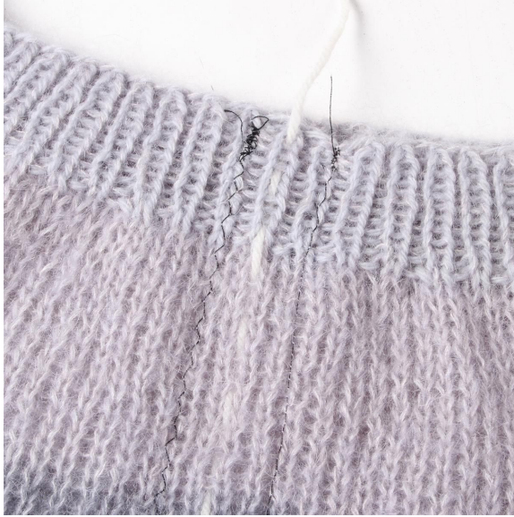
3- La couture zig-zag retient les m. Attention à ne pas le serrer.