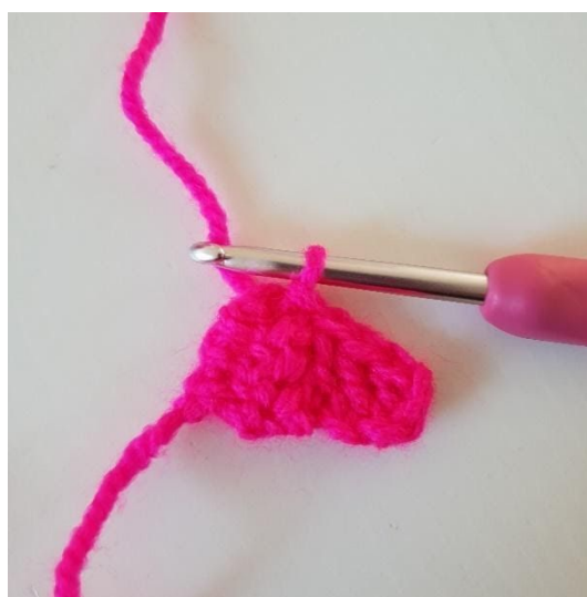
4. Maintenant vous devez réunir ce pixel avec le premier pixel. Pour faire cela, il faut commencer par tourner le pixel et faire 1 mc sur la gauche du premier pixel. La photo montre les deux pixels travailler ensemble.