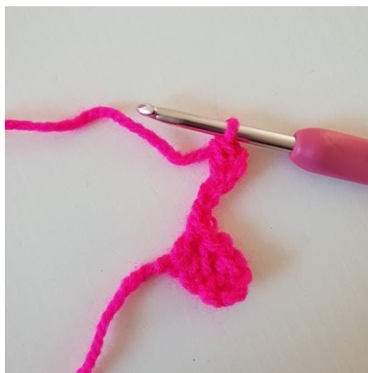
2. Faire 1 br dans la 3ème ml à partir du crochet