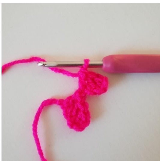
3. Crocheter 1 br dans chacune des 2 ml suivantes. Vous avez maintenant fait un pixel de plus.