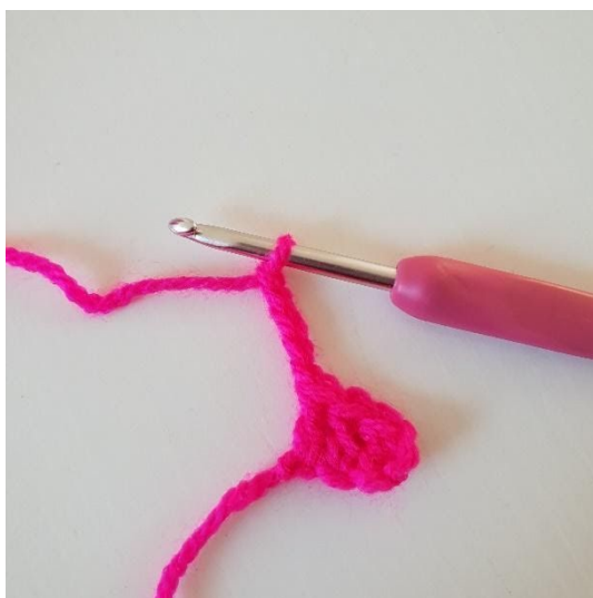
1. Commencer par 5 ml