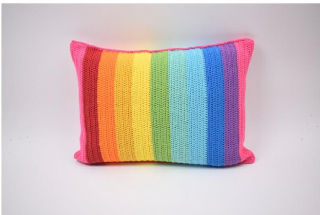
9. Comme ceci.