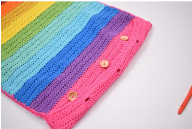
7. Coudre 3 boutons en face des boutonnières.