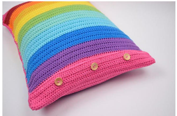
8. Placer le coussin à l'intérieur et fermer la housse.