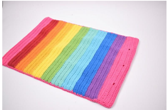
6. Répéter de chaque côtés. Couper le fil et le cacher.