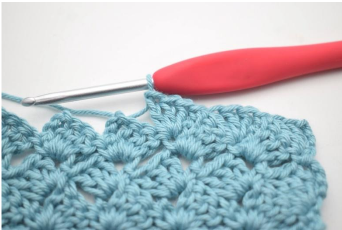
44. Comme ceci.