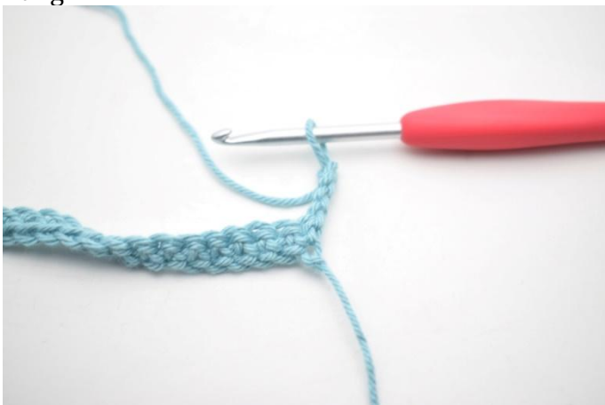
5. Tourner, 4 ml.