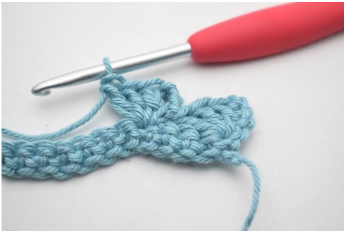
9. Comme ceci.