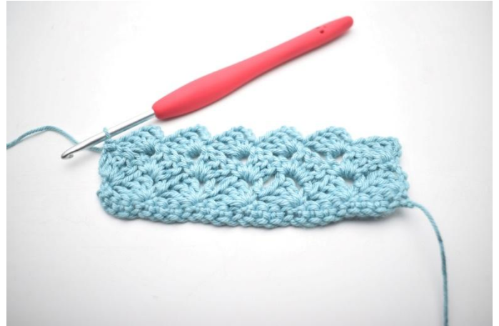
32. Comme ceci.