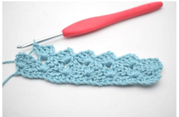
22. Répéter de * à * 13 fois au total.