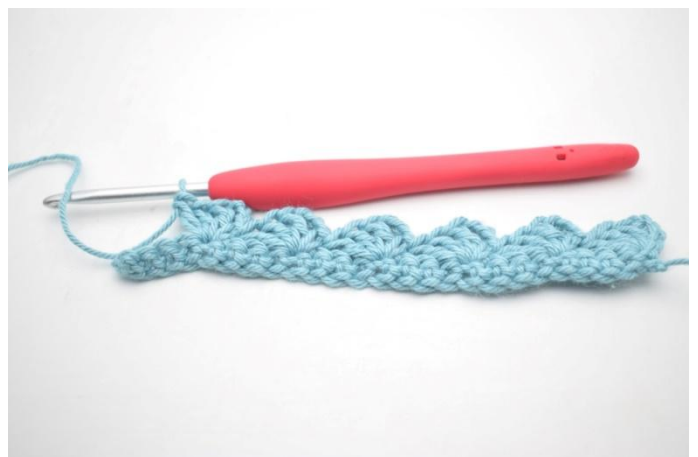
12. Répéter de * à * jusqu'à ce qu'il reste 4 m.