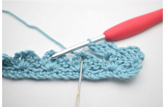
20. *1 ms, 3 ml et 3 br dans l'espace de ml suivant*.