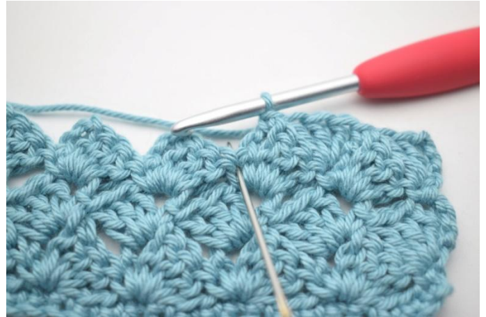
43. 3 br dans la ms du rang précédent*.