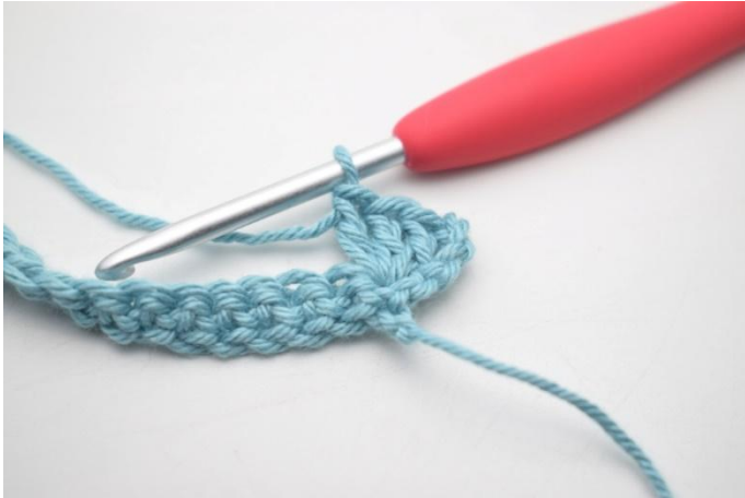
7. Comme ceci.