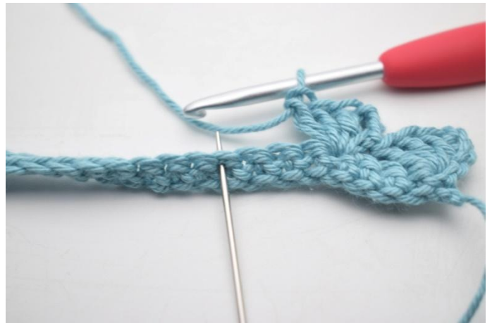
10. *sauter 3 m, 1 ms, 3 ml et 3 br dans la m suivante*