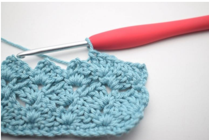
40. Comme ceci.