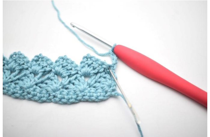
26. 3 br dans la première m.