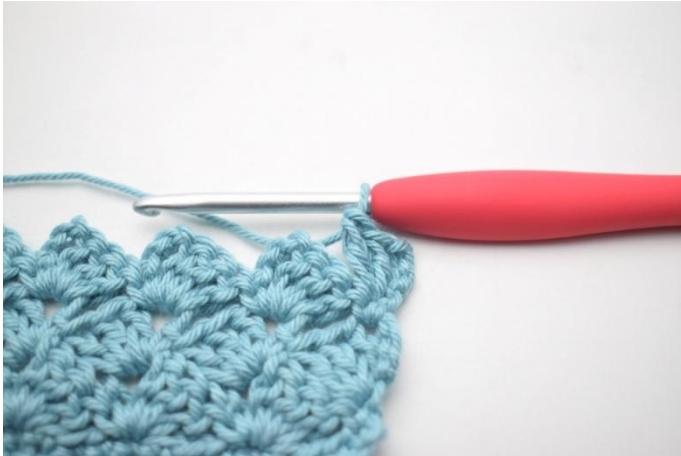
36. Comme ceci.