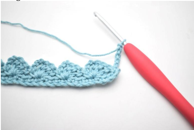
15. Tourner, 4 ml.