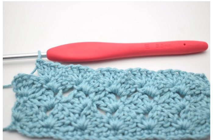
45. Répéter de * à * 13 fois au total.