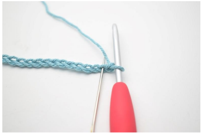
2. 1 ms dans la 2ème ml à partir du crochet.