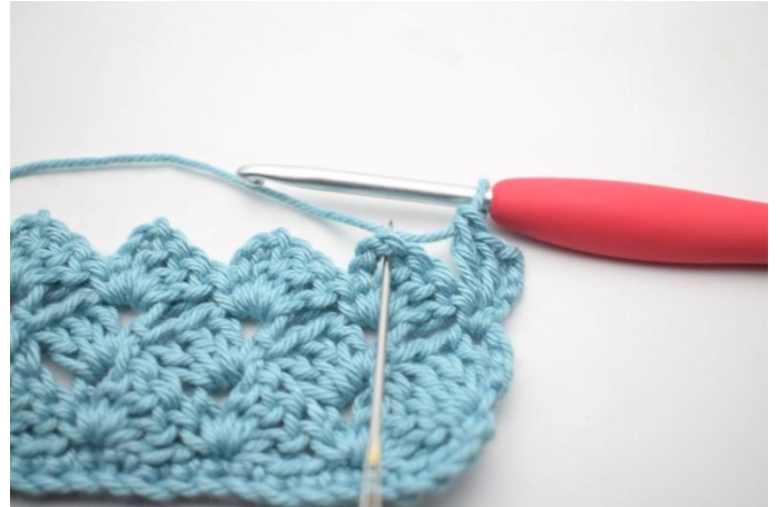
37. *1 ms dans l'espace de ml,