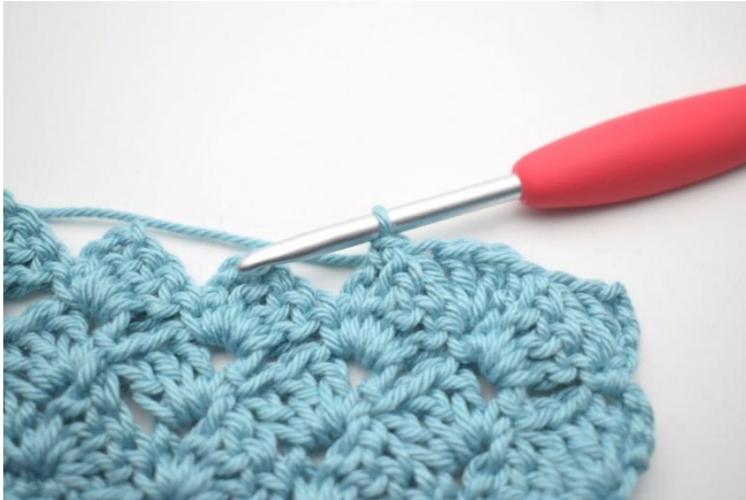
42. Comme ceci.