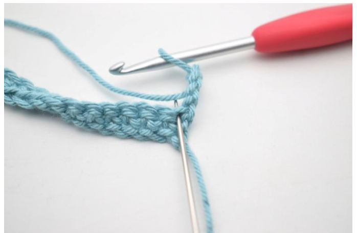
6. 3 br dans la première m.