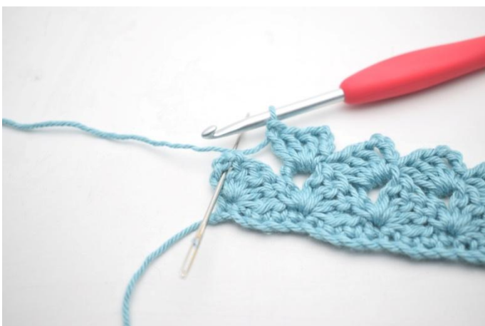
23. 1 ms dans le dernier espace de ml.