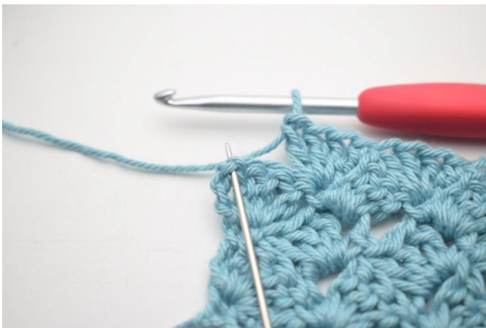
46. 1 ms dans le dernier espace de ml.