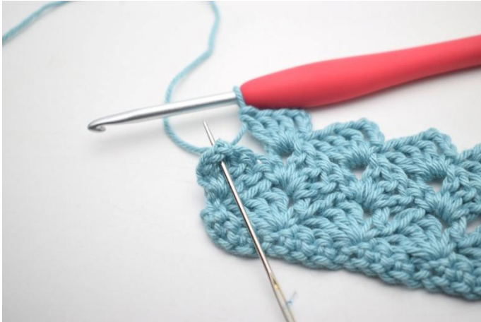
31. 1 ms dans le dernier espace de ml.