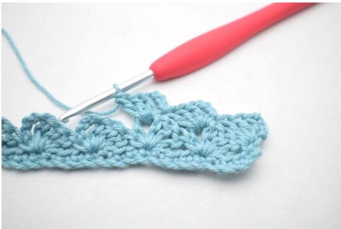
21. Comme ceci.