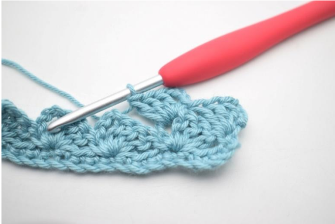
19. Comme ceci.