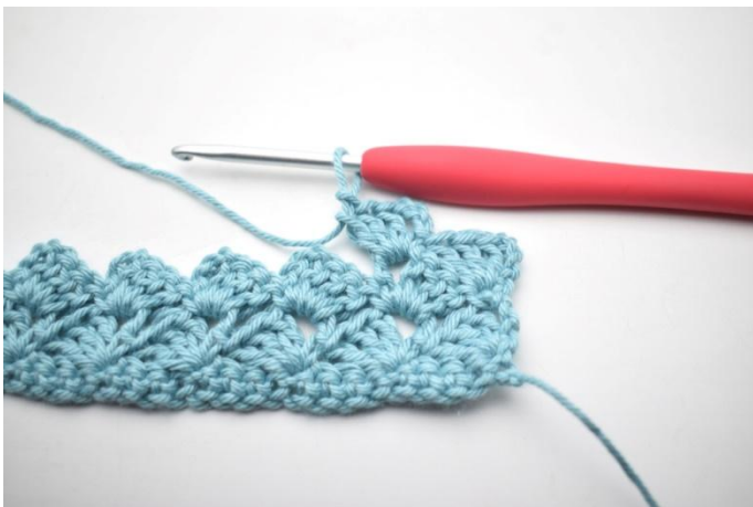
29. Comme ceci.