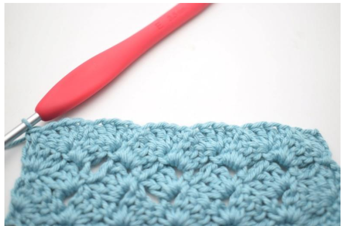
47. Comme ceci.