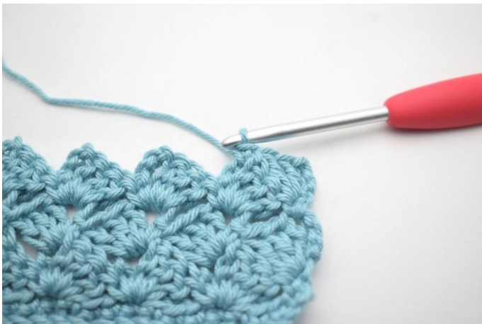
38. Comme ceci.