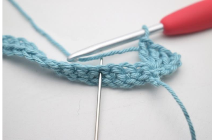
8. *sauter 3 m, 1 ms, 3 ml et 3 br dans la m suivante*.