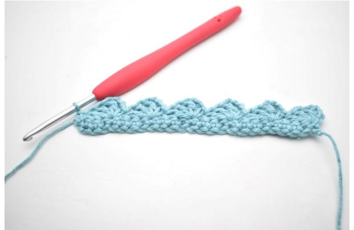
14. Comme ceci.