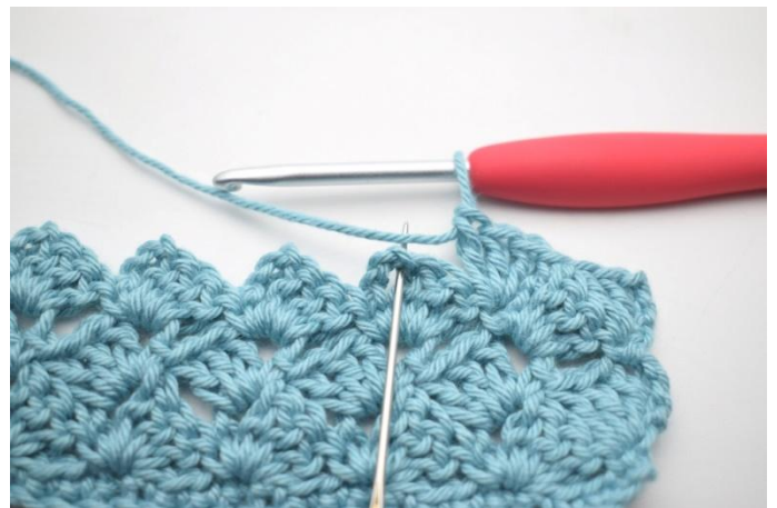
41. *1 ms dans l'espace de ml,