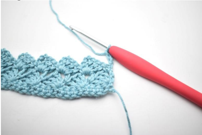
25. Ce rang est croché comme le rang 3. Tourner, 4 ml.