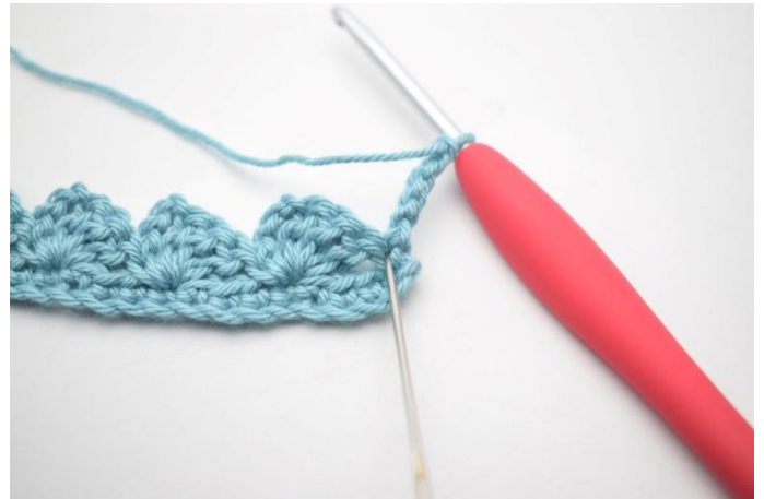
16. 3 br dans la première m.