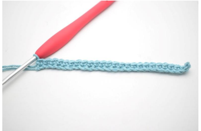
4. 1 ms dans chaque ml.