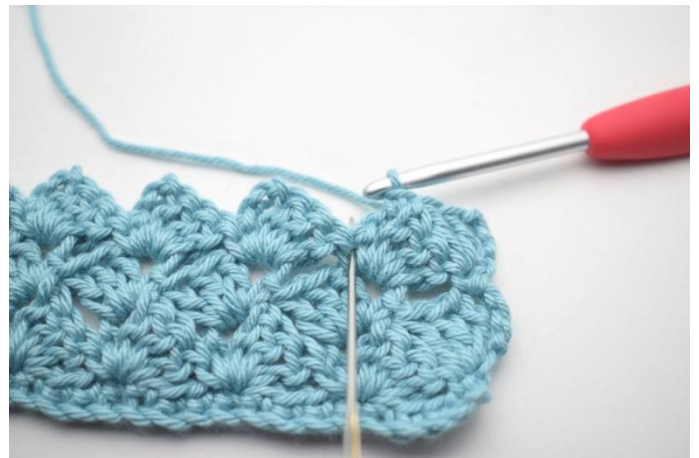
39. 3 br dans la ms du rang précédent*.