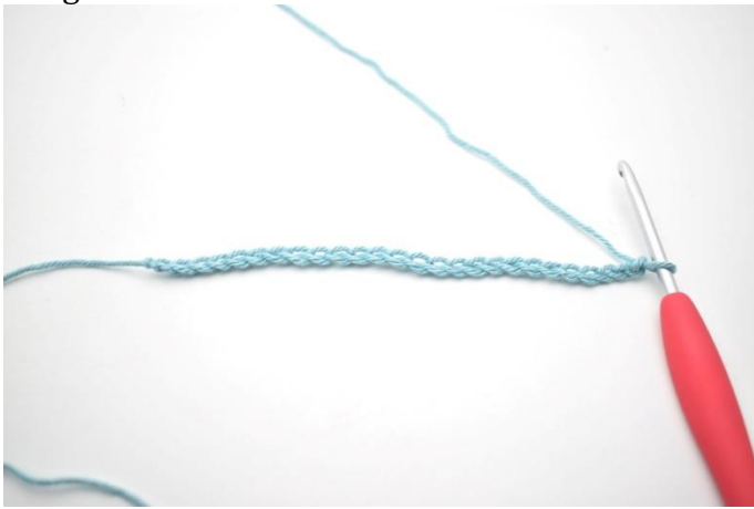
1. Faire 58 ml.