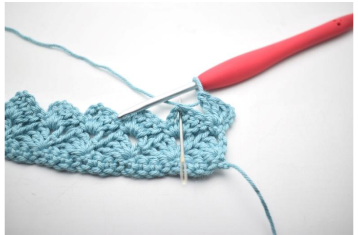
28. *1 ms, 3 ml et 3 br dans l'espace de ml suivant*.