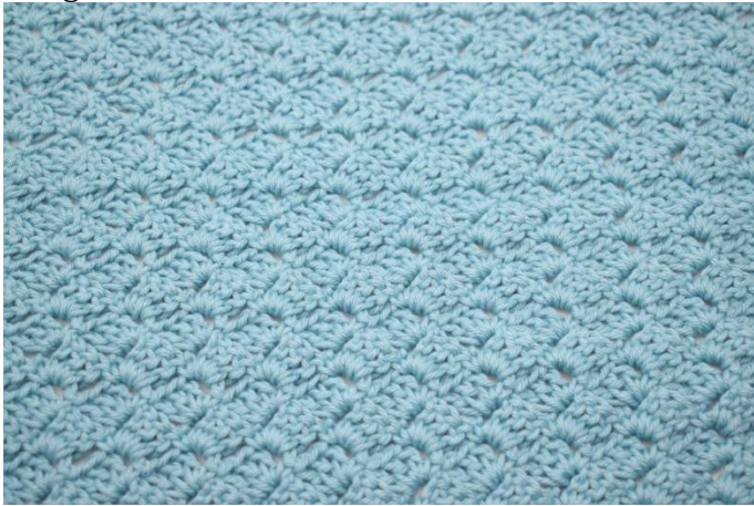
33. Répéter la méthode du rang 3 jusqu'à avoir un total de 24 rangs..