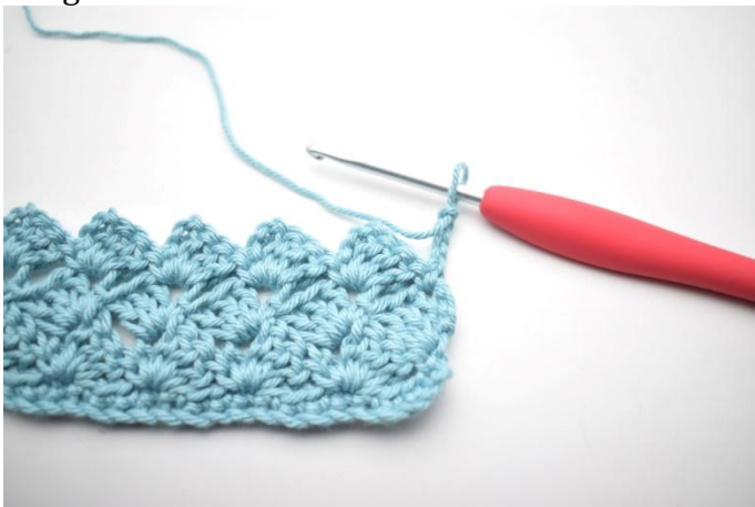
34. Tourner, 4 ml.