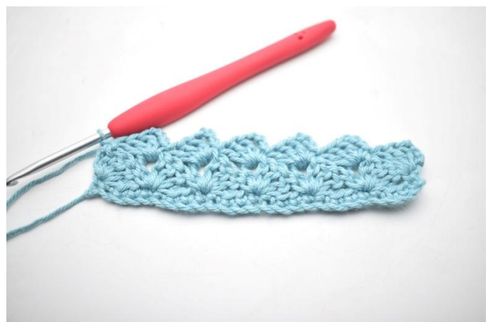
24. Comme ceci.