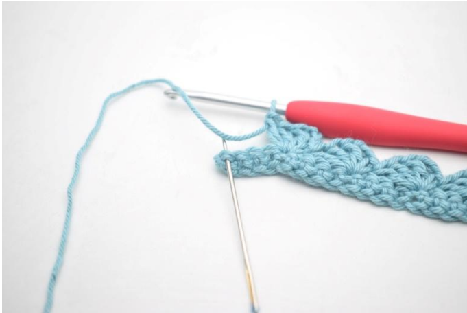
13. Sauter 3 m, 1 ms dans la dernière m.