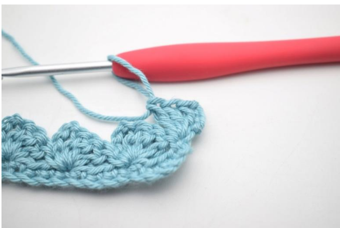
17. Comme ceci.