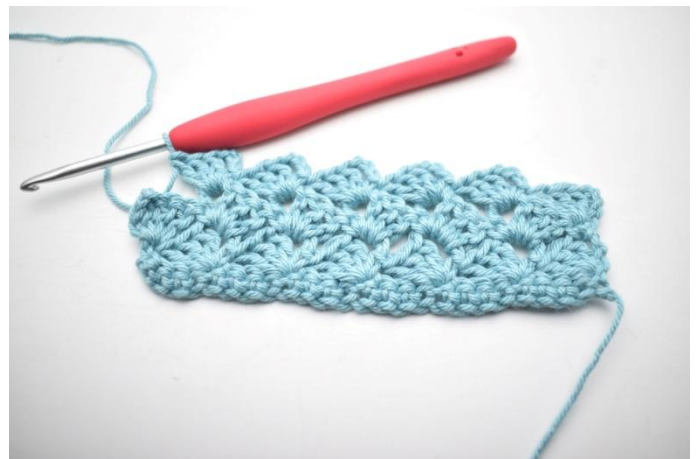
30. *1 ms, 3 ml et 3 br dans l'espace de ml suivant*. Répéter de * à * 13 fois au total.