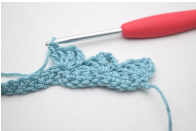
11. Comme ceci.