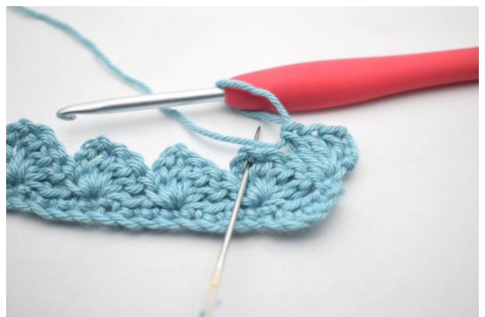
18. *1 ms, 3 ml et 3 br dans l'espace de ml suivant*.