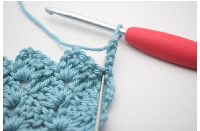
35. 2 br dans la première m.