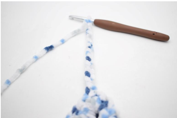
36. faire 15 ml, 3 ms dans la 2ème ml à partir du crochet, 3 ms dans les 12 dernières ml.