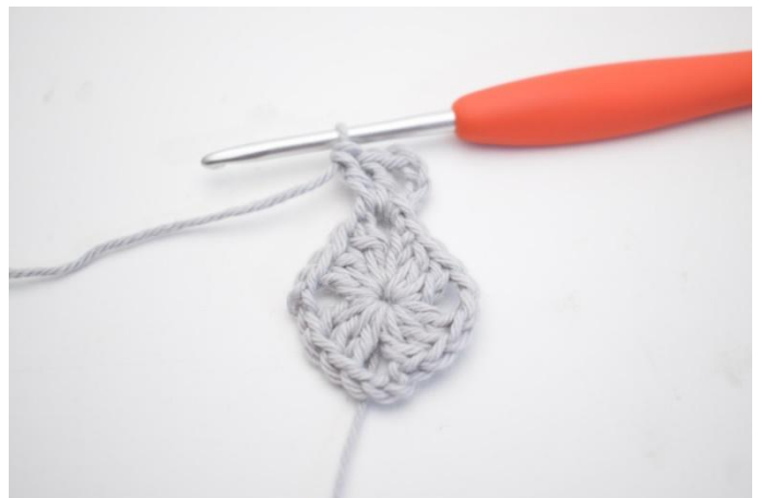
6. faire 4 ml, 2 br dans l'esp-ml.