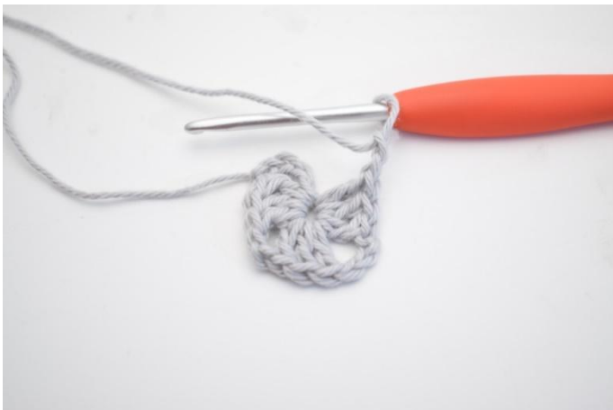
3. Répéter de * à * 3 fois au total..