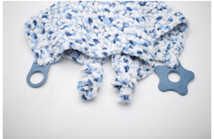
8. Votre doudou plat Nuzzle est maintenant prêt à être câliner et cajoler 😊