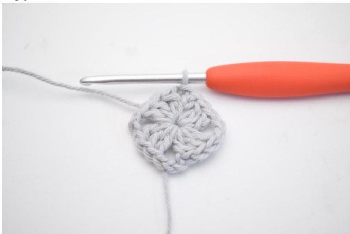
5. 1 sl st in the ch-sp. 1 mc dans l'esp-ml,