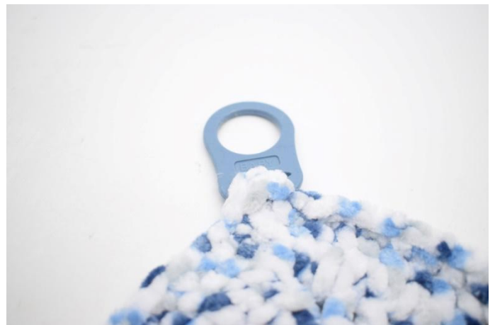
2. Plier *bout pointu* autour de l'ouverture de l'adaptateur et le coudre fermement.