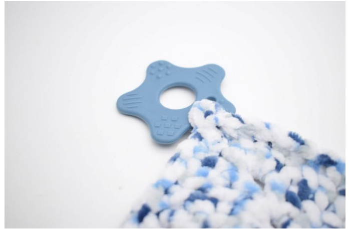
6. Plier *bout pointu* autour de l'ouverture de l'adaptateur et le coudre fermement.