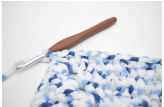
29. 1 ms dans les 32 m suivantes.