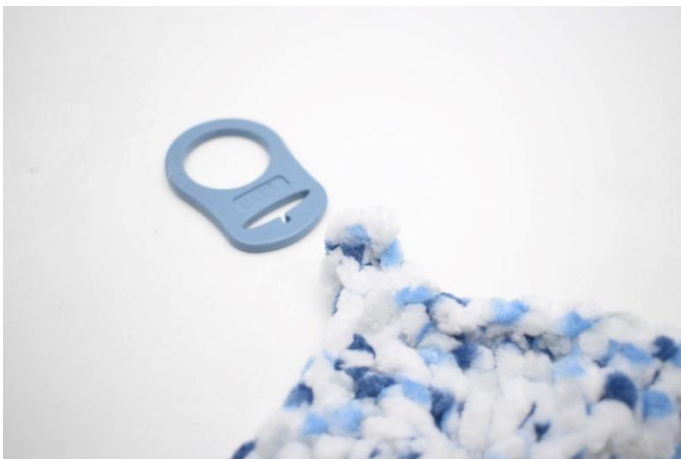
1. Dans le premier coin, attacher l'adaptateur attache tétine.