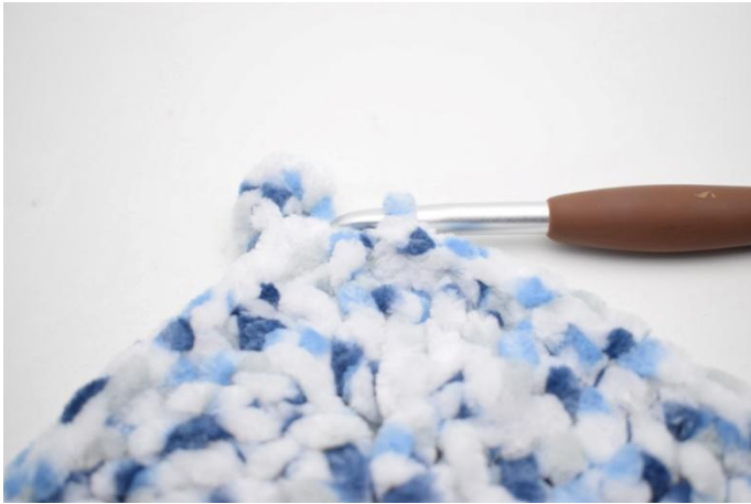
38. 1 ms dans les 30 m suivantes, 1 mc.