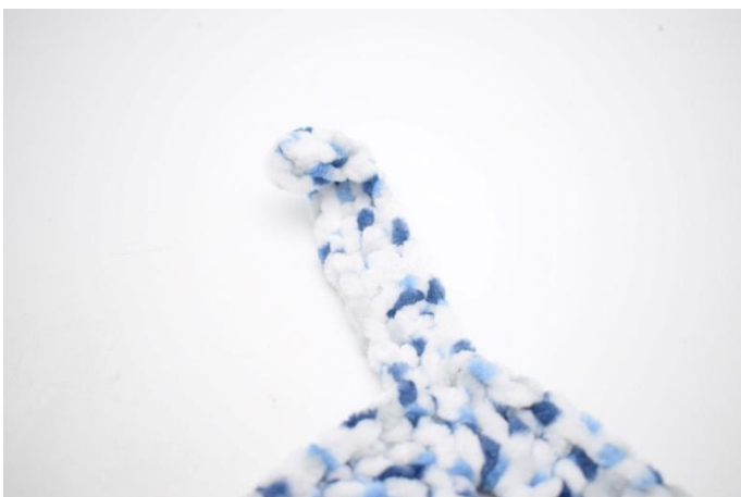
3. Dans le coin suivant, faire un noeud