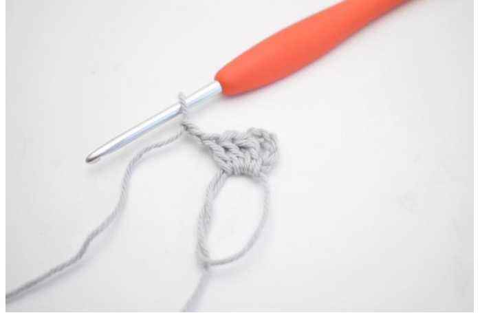
2. *3 br et 3 ml*.