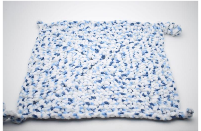
39. Couper le fil et le cacher.