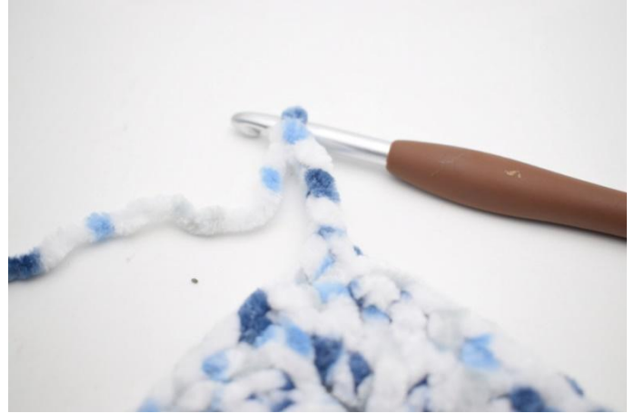
27. Faire 4 ml, 1 ms dans la 2ème ml à partir du crochet, 1 ms dans les 2 dernières ml.