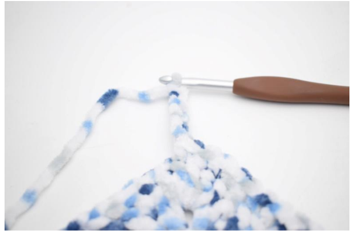
33. faire 6 ml, 1 ms dans la 2ème ml à partir du crochet, 1 ms dans les 4 dernières ml.