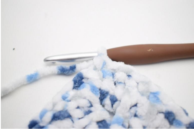
26. Faire 1 ml, 1 ms dans la 1ère m.