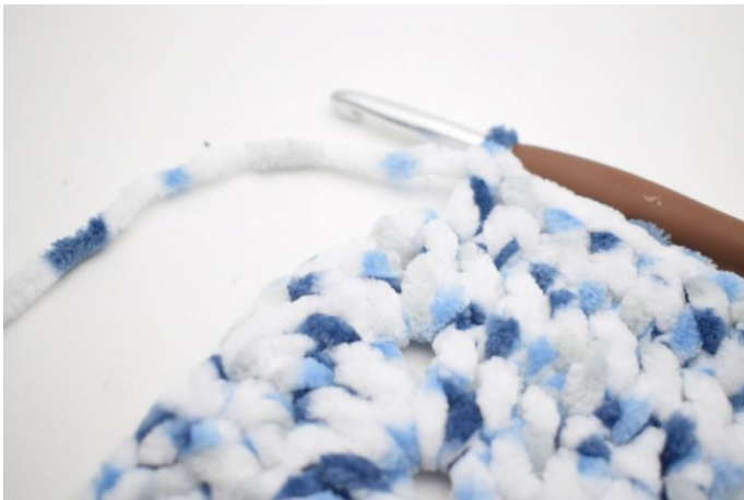
23. *1 br dans les 27 m suivantes,