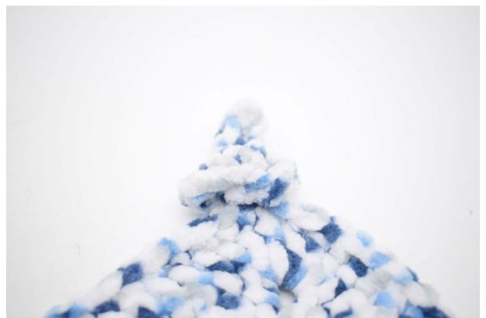
4. Comme ceci