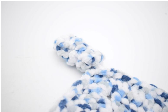
7. Le dernier coin est comme il est