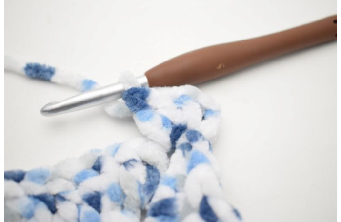
22. faire 3 ml, 3 br dans l'esp-ml.