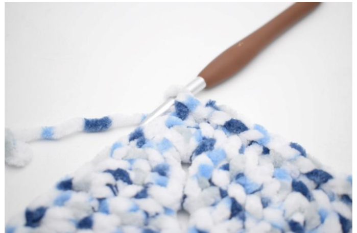
35. 1 ms dans les 32 m suivantes,