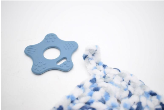
5. Dans le coin 3, attacher l'anneau de dentition.