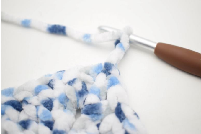
21. 1 sl st in the ch-sp, ch3. 1 mc dans l'esp-ml,