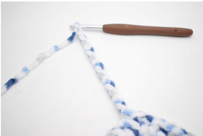
30. faire 15 ml, 1 br dans la 3ème ml à partir du crochet, 1 br dans les 12 dernières ml.