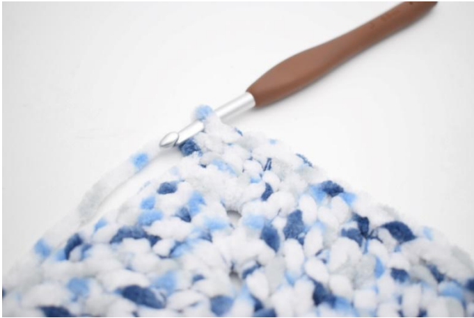
32. 1 ms dans les 32 m suivantes,