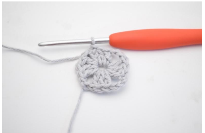
4. 2 br, 1 mc dans la 3ème ml du début du tour.