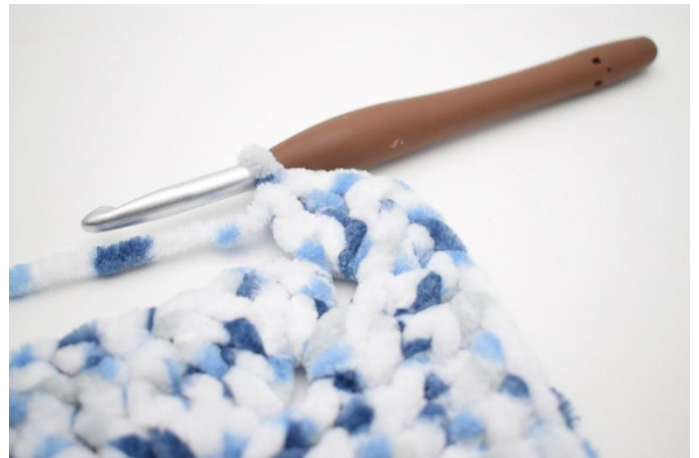
24. 5 br dans l'esp-ml suivant*.