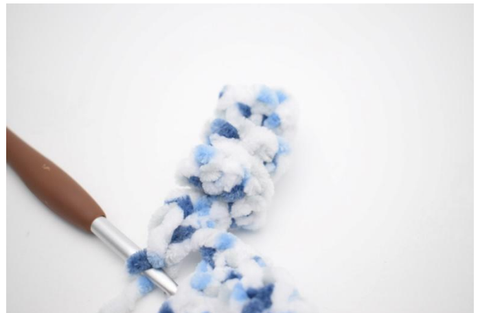
37. Comme ceci.