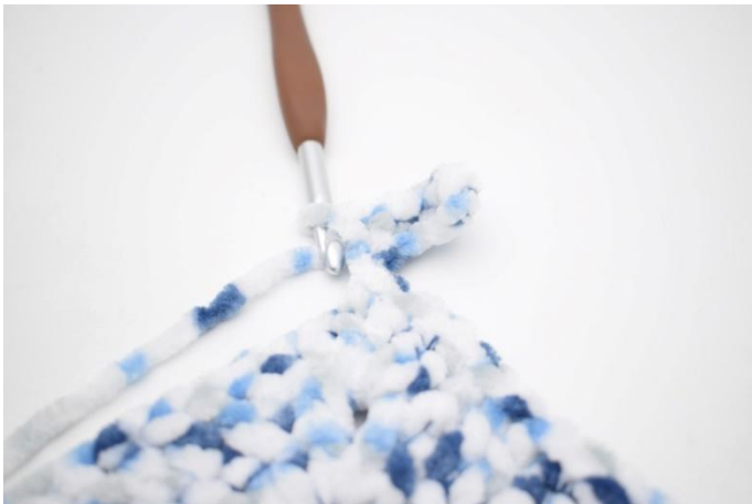
34. Comme ceci.