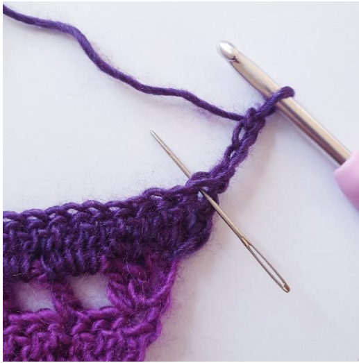
Rg 6: 2 br dans la première m