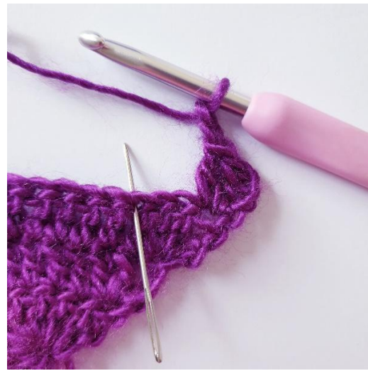
[2 ml, sauter 2 m,