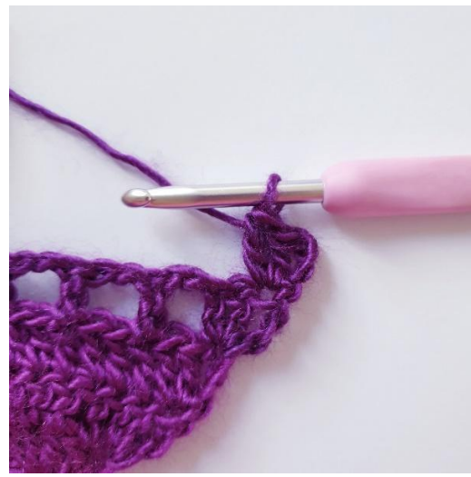
Rg 5: 2 br dans la première m