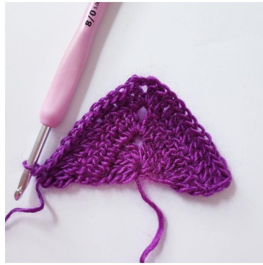
Après le tour 3