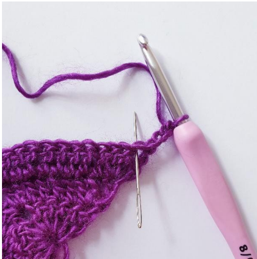
Rg 4: 2 br dans la première m