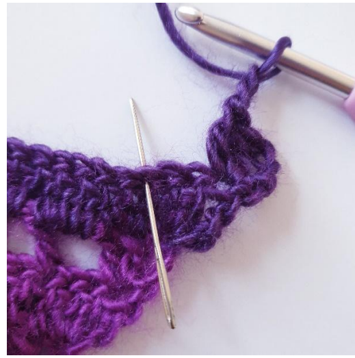
[2 m], sauter 2 m,