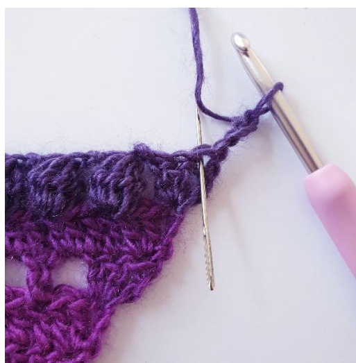
Rg 7: 2 br dans la première m