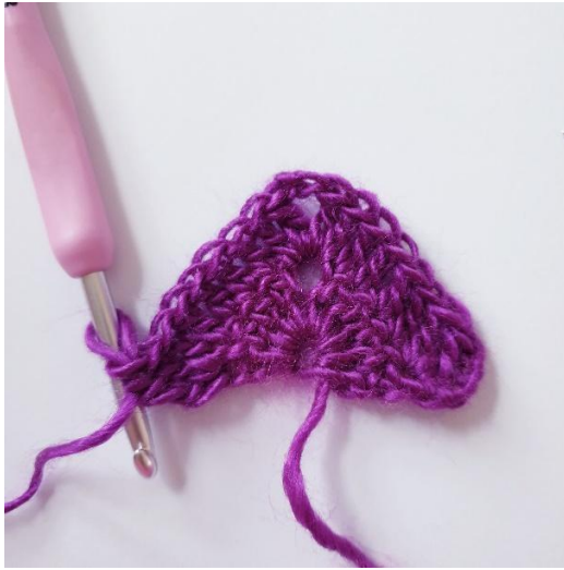
Après le tour 2