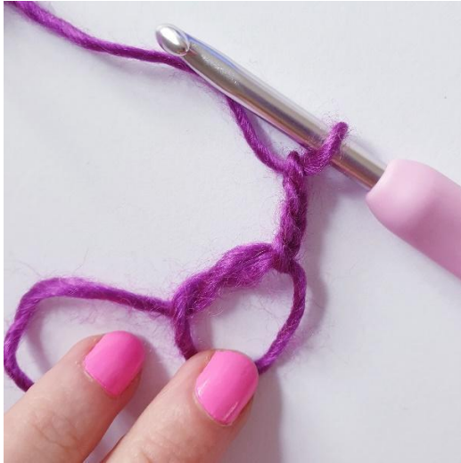
Rg 1: Faire 4 ml,

Faire un cercle magique, sans le fermer complètement.