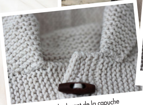
Plié sur le devant de la capuche