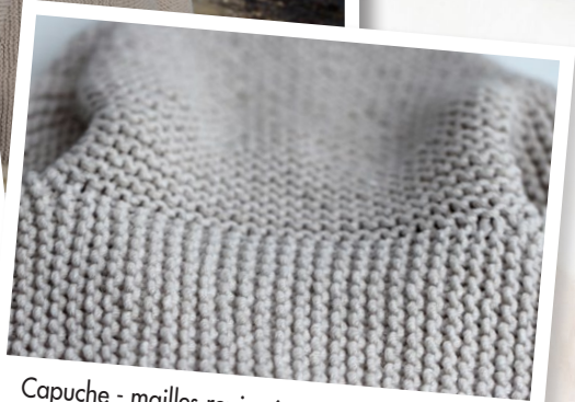
Capuche - mailles repiquées à partir de l'encolure