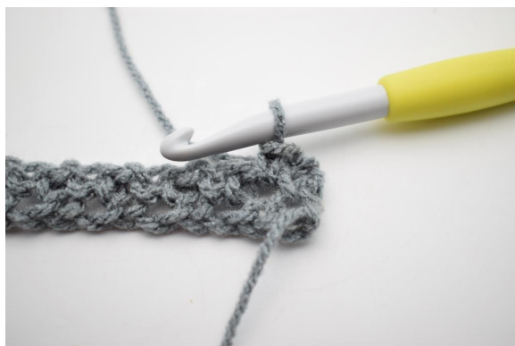
3. Comme ceci.