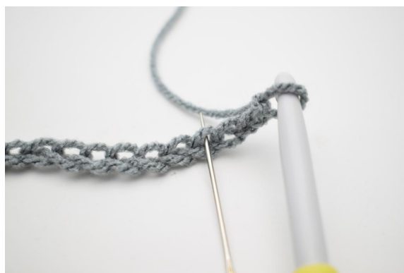
2. Dans la 4ème ml à partir du crochet, 1ms.