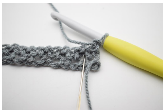
2. 1 ms dans le premier esp-ml.