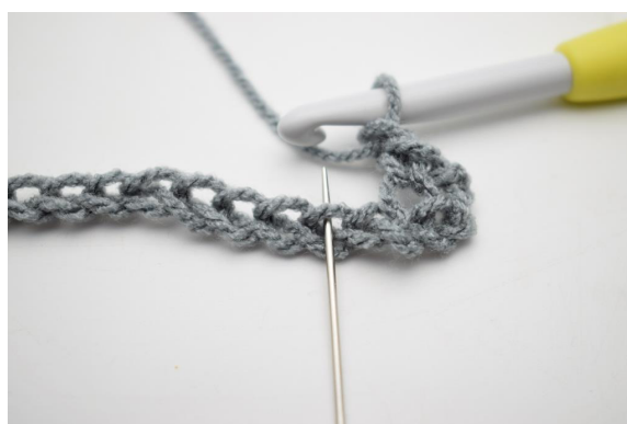
4. * faire 1 ml, sauter 1 m et 1 ms dans la suivante *.