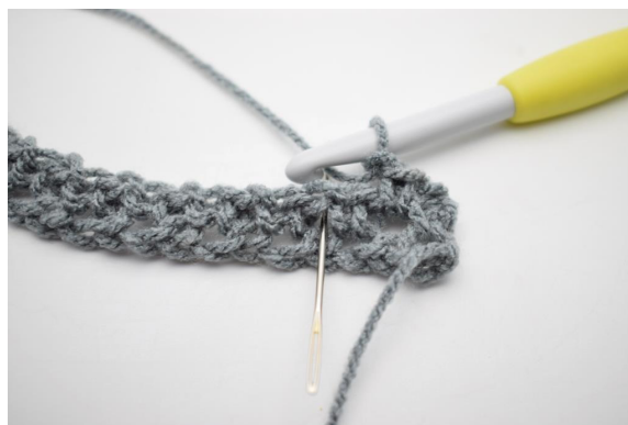
4. * faire 1 ml et 1 ms dans l'esp-ml suivant*.