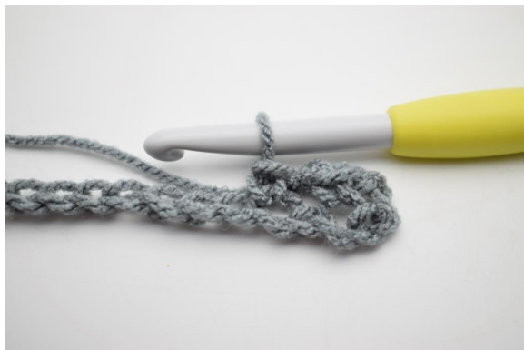
5. Comme ceci.