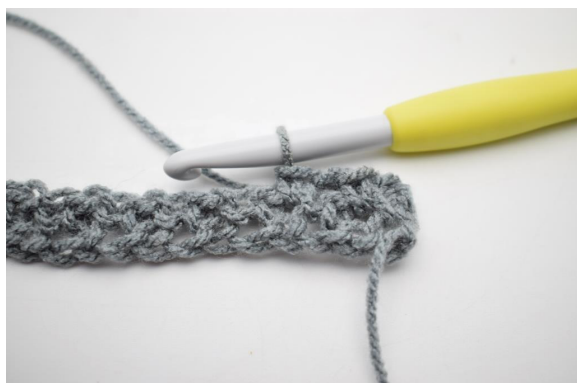
5. Comme ceci.