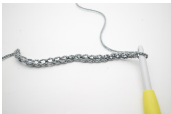
1. Faire 232 ml.