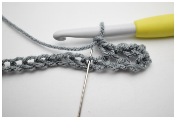
6. * faire 1 ml, sauter 1 m et 1 ms la m suivante *.