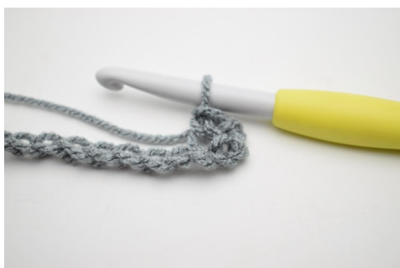
3. Comme ceci.