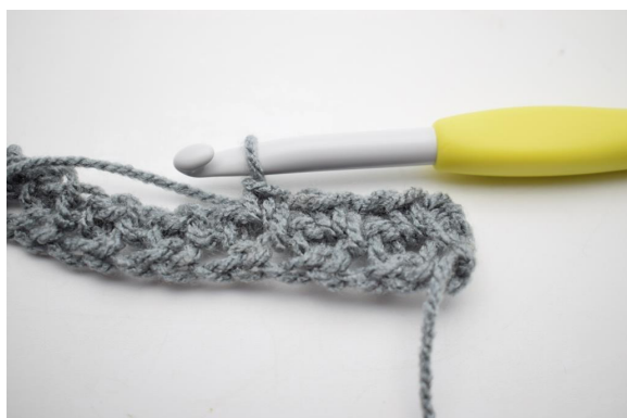
7. Comme ceci.