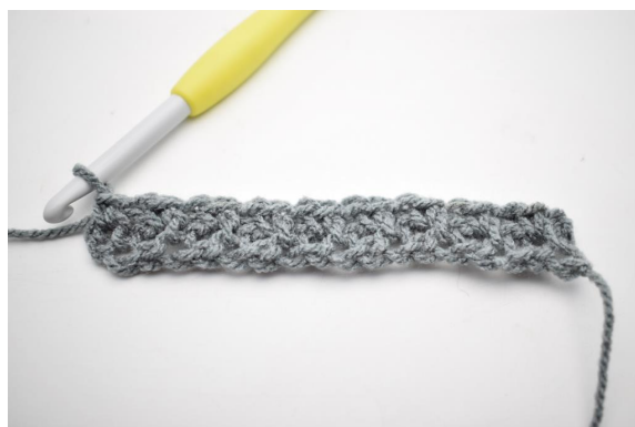
8. Répéter de * à * jusqu'à la fin du rang.