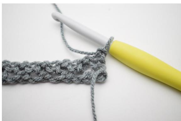
1. Tourner et faire 2 mlf.