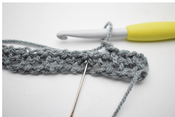
6. * faire 1 ml et 1 ms dans l'esp-ml suivant*.