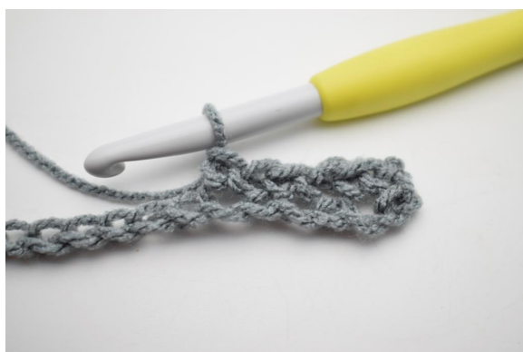
7. Comme ceci.