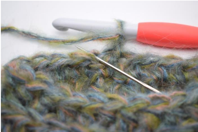
14. Faire 1 demi-br bar dans la première m.