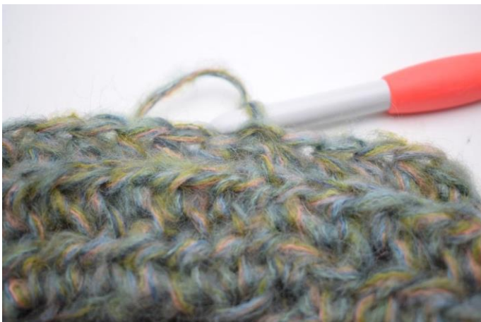
11. 1 demi-br bar dans chaque m tout le tour. Finir avec 1 mc dans la première demi-br. (58)