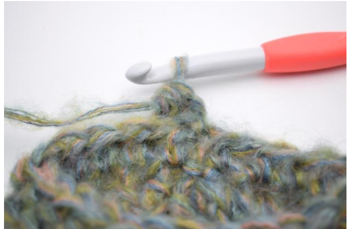
15. Comme ceci.