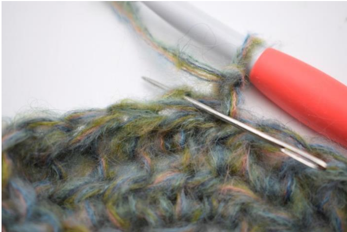
9. Faire 1 demi-br bar dans la première m.