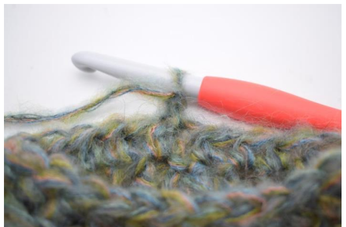
13. Tourner la pièce.