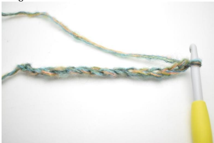
1. Faire 50 (53) 56 ml.