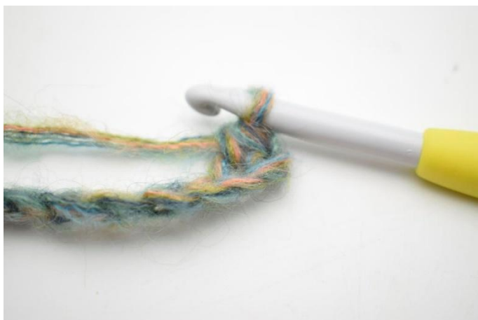
3. Comme ceci.