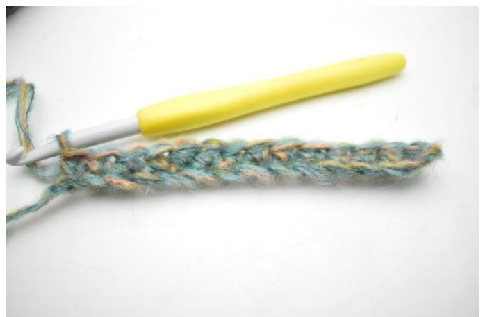
4. Faire des ms tout le rang. = 49 (52) 55 m.