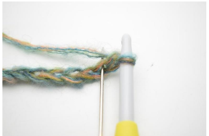
2. Faire 1 ms dans la 2ème ml à partir du crochet.