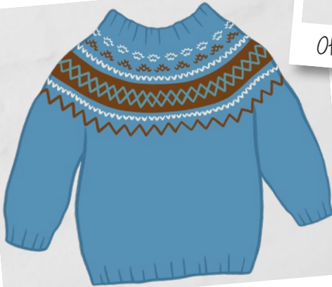
Jeans blue, Autumn orange, Off-white