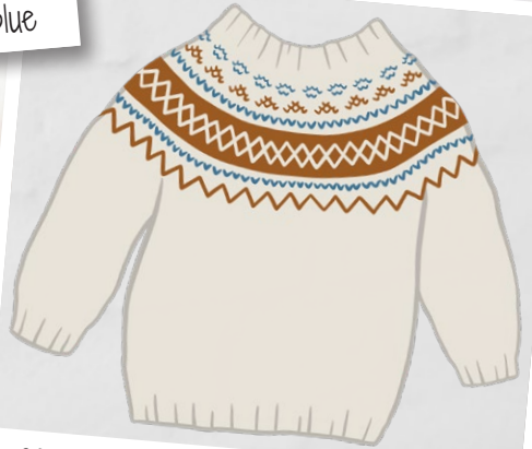
Off-white, Autumn orange, Jeans blue