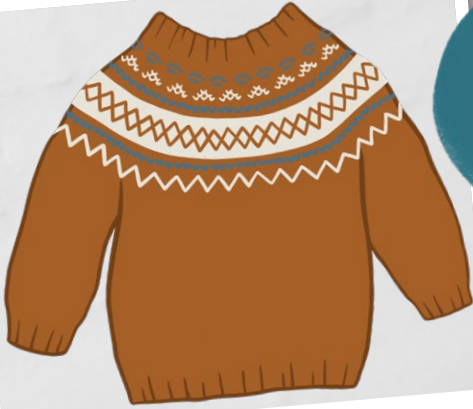
Autumn orange, Off-white, Jeans blue

Le dessin peut également être réalisé en 3 couleurs.