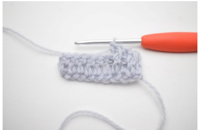
6. "Faire 1 brRAV autour de la m suivante, faire 1 brRAR autour de la prochaine m".