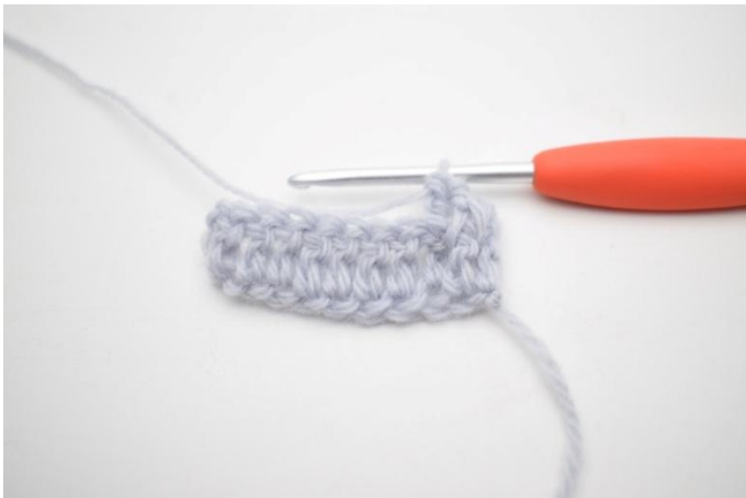
5. Comme ceci.