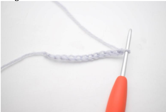
1. Faire 25 ml.