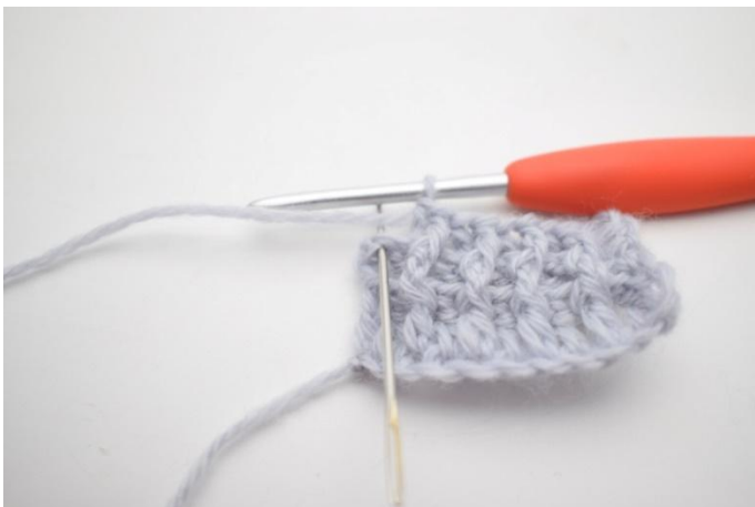
9. Faire 1 br normale dans la dernière m.