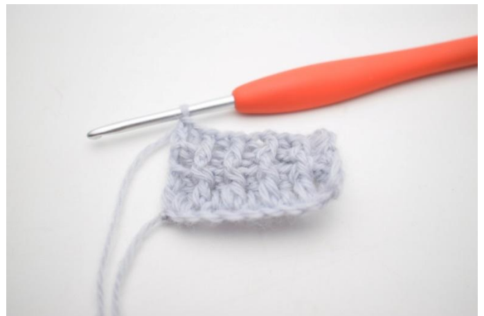
10. Comme ceci.