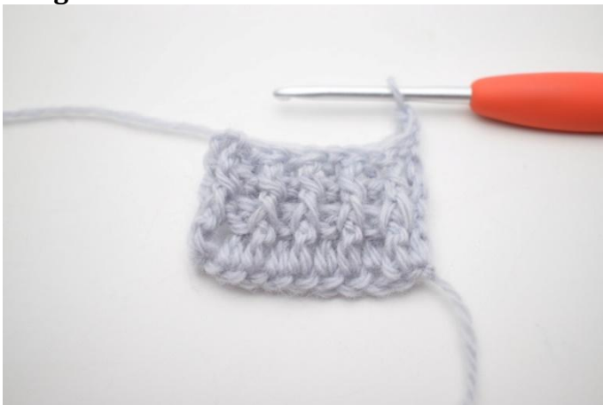
1. Ce rang est une répétition du rang 2. Faire 3 ml et tourner.