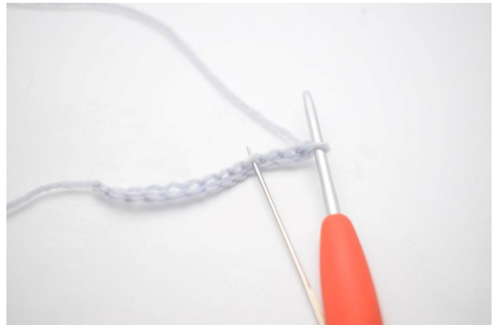
2. Faire 1 br dans la 4ème ml à partir du crochet.