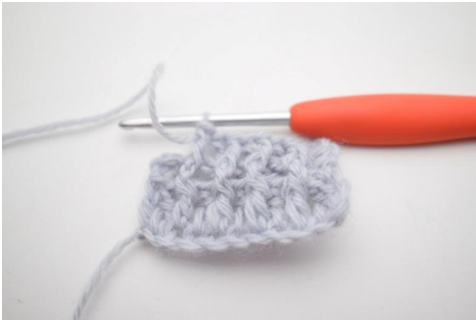
7. Répéter de " à " jusqu'à ce qu'il reste 2 m.