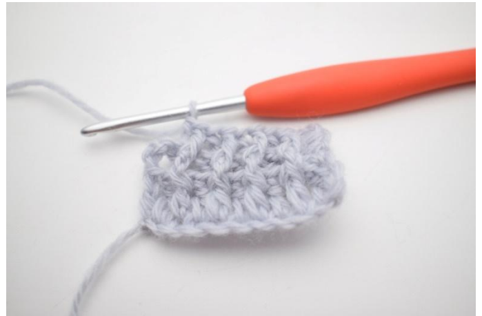
8. Faire 1 brRAR autour de la m suivante.