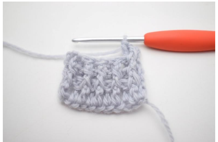
2. "Faire 1 brRAV autour de la première m, faire 1 brRAR autour de la m suivante".