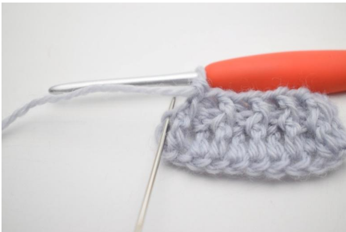
7. Faire 1 br normale dans la dernière m.