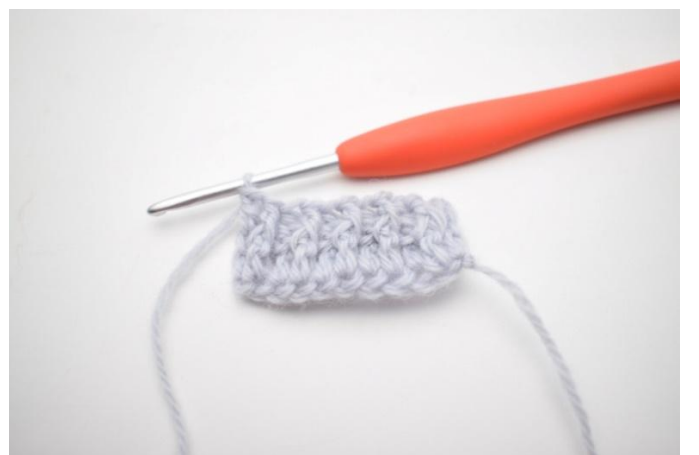
10. Comme ceci.