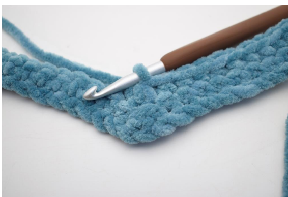
19. Crocheter 3 ms ens.