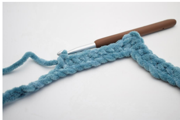
8. "Crocheter 1 ms dans les 8 ml suivantes.