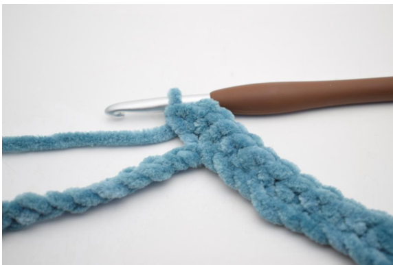
7. Crocheter 3 ms dans la prochaine ml".