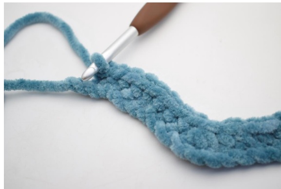
14. Crocheter 1 ms dans les 8 ml suivantes.