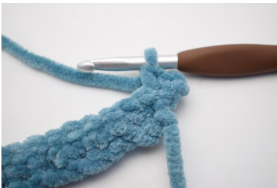
17. Faire 2 ms dans la première m.