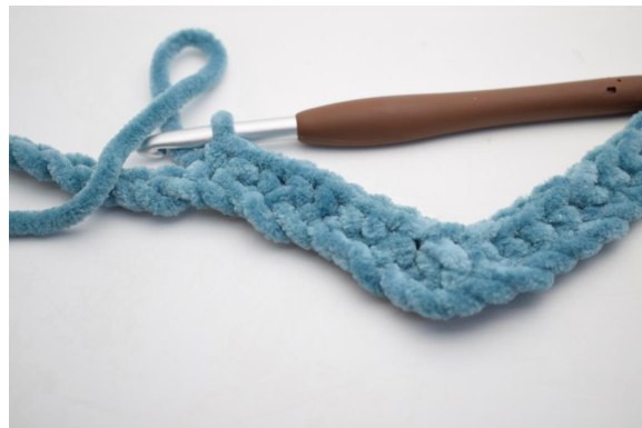
10. "Crocheter 1 ms dans les 8 ml suivantes.