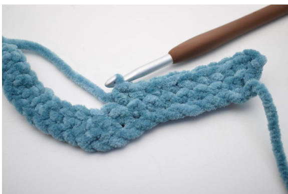
18. "Crocheter 1 ms dans les 8 m suivantes.