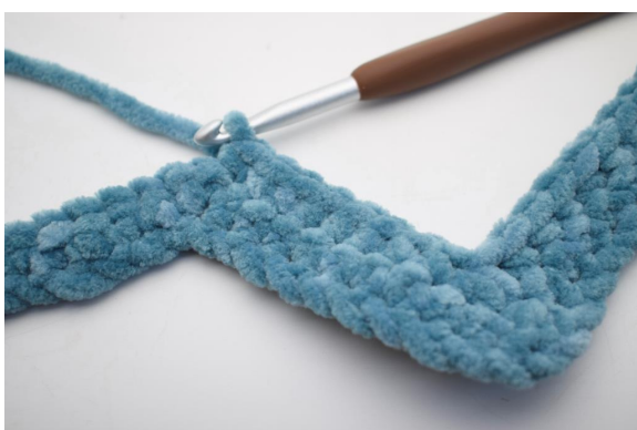
20. Crocheter 1 ms dans les 8 m suivantes.