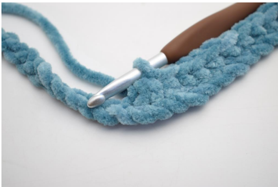
9. Crocheter 3 ms dans la prochaine ml".