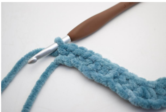
15. Faire 2 ms dans la dernière ml.