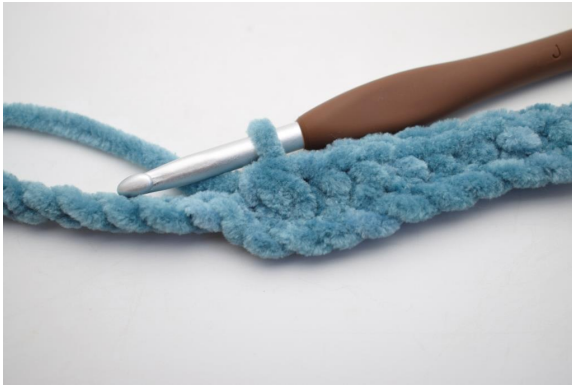
5. Crocheter 3 ms ens.