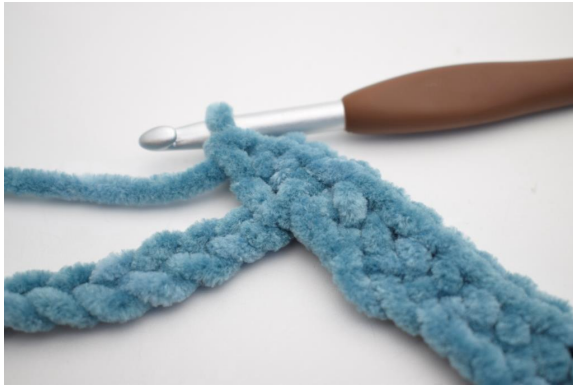
11. Crocheter 3 ms ens dans la ml suivante”.