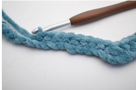
6. Crocheter 1 ms dans les 8 ml suivantes.