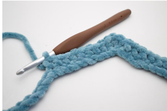
12. Crocheter 1 ms dans les 8 ml suivantes.