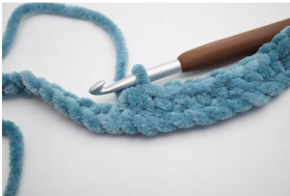
13. Crocheter 3 ms ens.