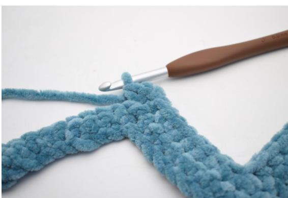
21. Crocheter 3 ms dans la prochaine m".