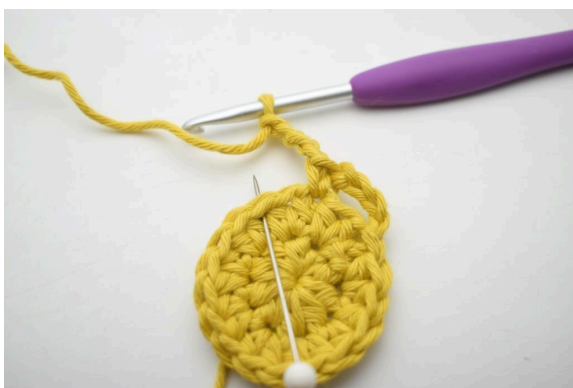
8. Sauter 1 m et crocheter 1 ms dans la m suivante ».