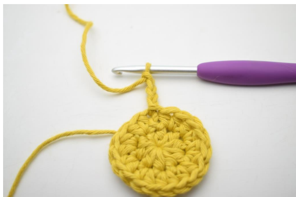
4. « Faire 4 ml.