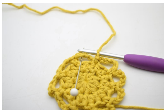
13. Faire 2 mc le long du premier espace de ml pour ainsi commencer au milieu de celui-ci.