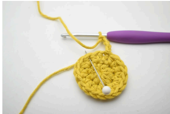
5. Sauter 1 m et crocheter 1 ms dans la m suivante ».