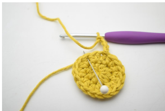
5. Sauter 1 m et crocheter 1 ms dans la m suivante ».