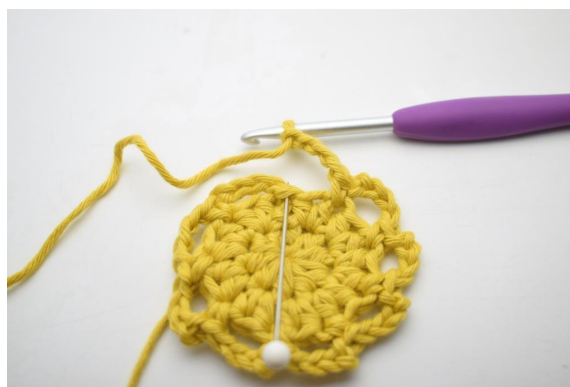
11. Terminer avec 1 mc.