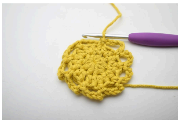
12. Ainsi. (9 espaces de ml)