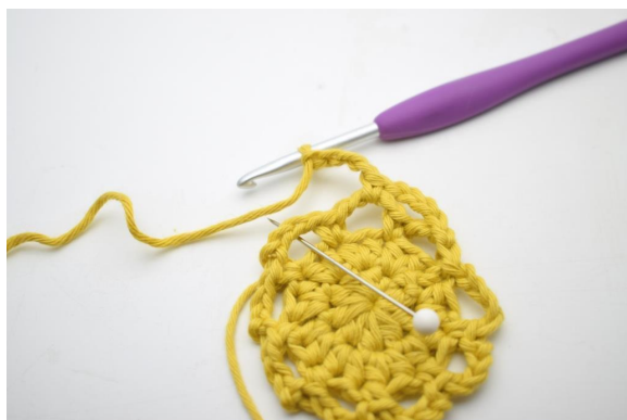
17. « Faire 4 ml et crocheter 1 ms dans le prochain espace de ml ».