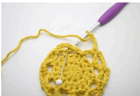
20. Le tour est terminé avec 1 ms dans le premier espace de ml, qui a été formé sur ce tour.