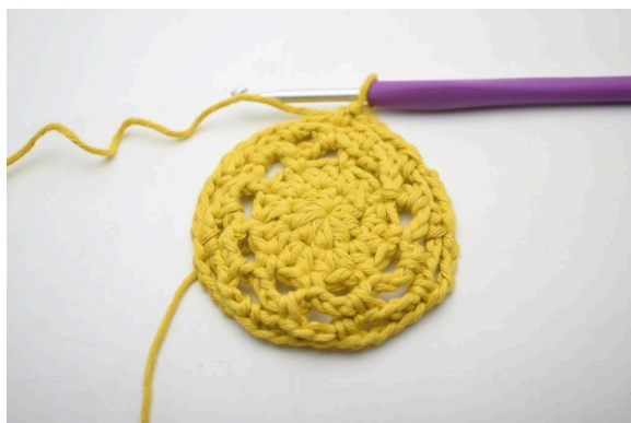
24. Répéter de « à » tout le tour. (9 espaces de ml)