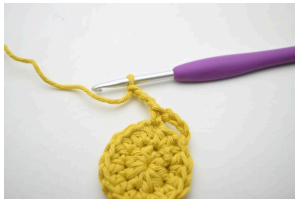
7. « Faire 4 ml.