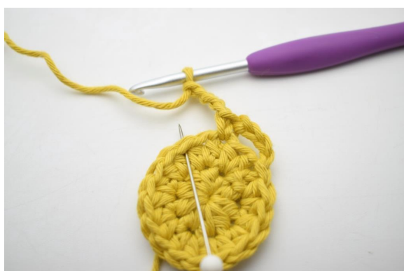
8. Sauter 1 m et crocheter 1 ms dans la m suivante ».