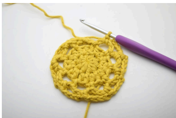
19. Répéter de « à » tout le tour.