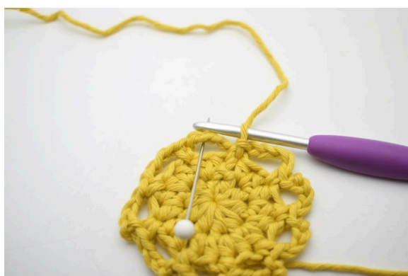
13. Faire 2 mc le long du premier espace de ml pour ainsi commencer au milieu de celui-ci.