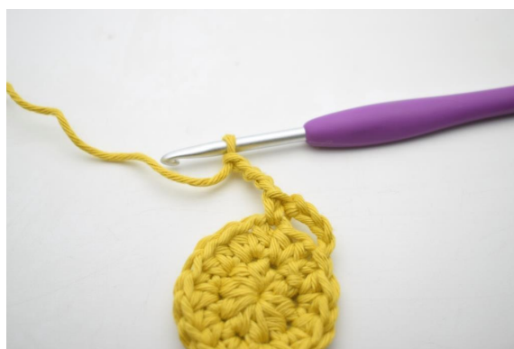
7. « Faire 4 ml.