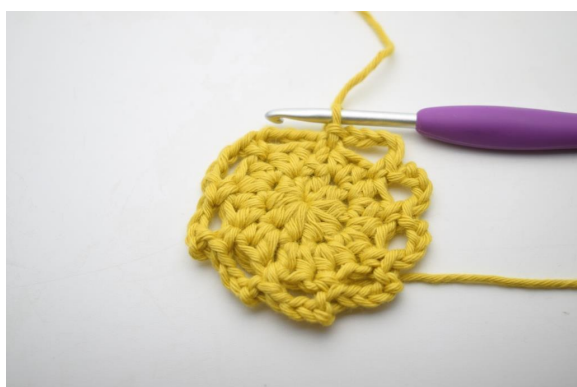
12. Ainsi. (9 espaces de ml)