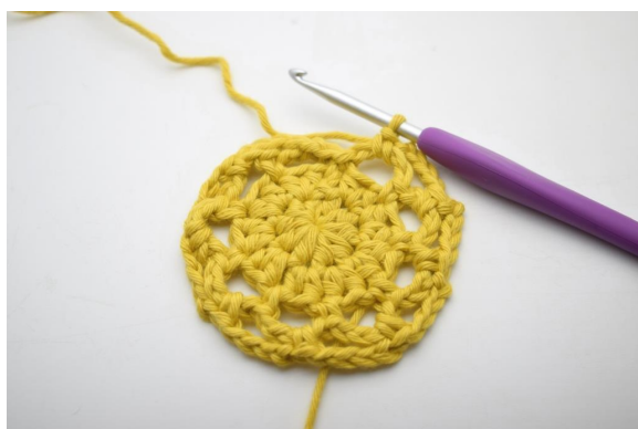
19. Répéter de « à » tout le tour.