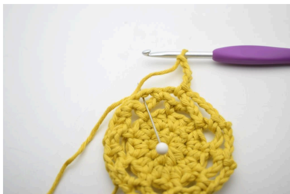
22. « Faire 4 ml et crocheter 1 ms dans le prochain espace de ml ».