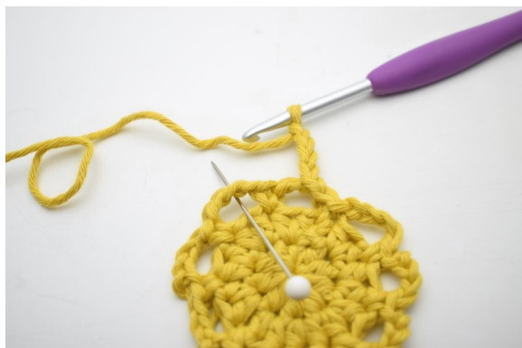
15. « Faire 4 ml et crocheter 1 ms dans le prochain espace de ml ».