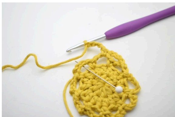
17. « Faire 4 ml et crocheter 1 ms dans le prochain espace de ml ».