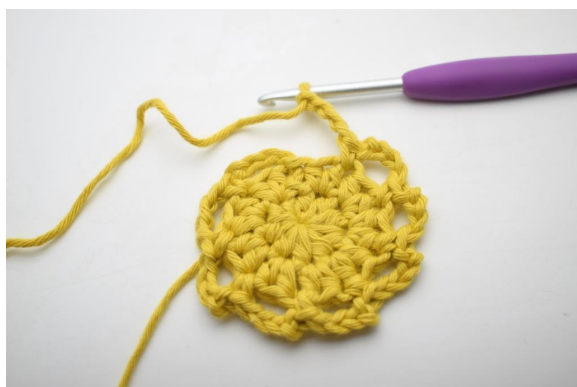
10. Répéter de « à » tout le tour.