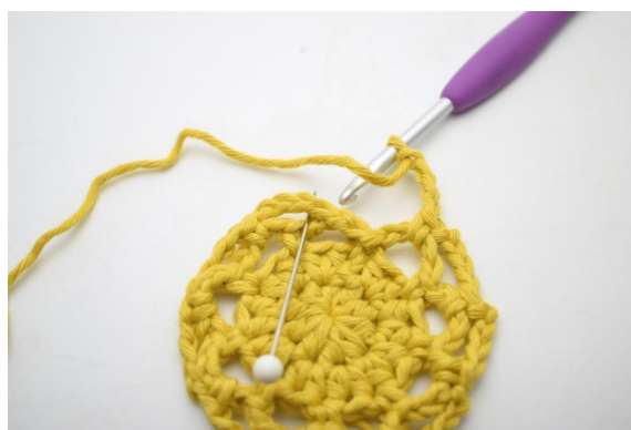
20. Le tour est terminé avec 1 ms dans le premier espace de ml, qui a été formé sur ce tour.