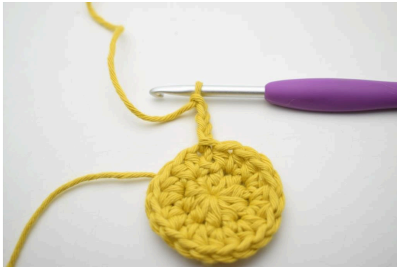
4. « Faire 4 ml.