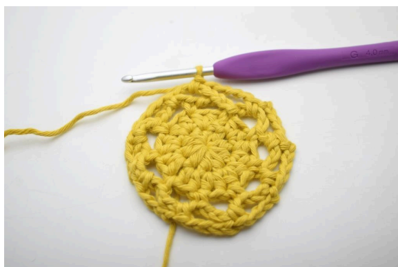
21. Ainsi. (9 espaces de ml)