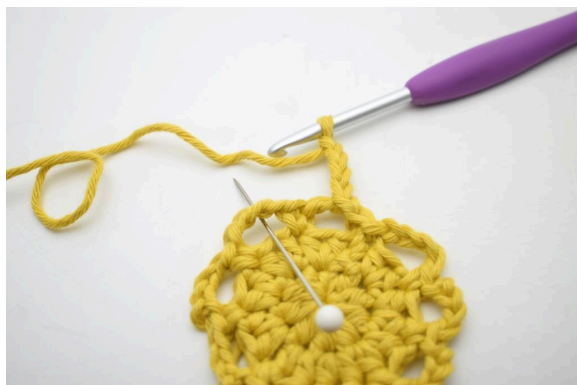
15. « Faire 4 ml et crocheter 1 ms dans le prochain espace de ml ».