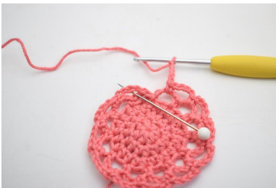
18. A la fin du tour, faire 1 ms dans le premier espace de ml fait sur ce même tour.