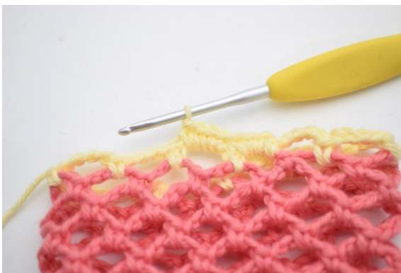
28. Comme ceci.