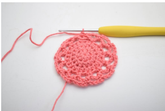
19. Comme ceci. (12 espaces de ml)