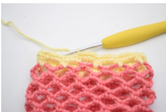
29. Faire 4 ms dans chaque espace de ml jusqu'à la fin du tour. Finir avec 1 mc. (48)