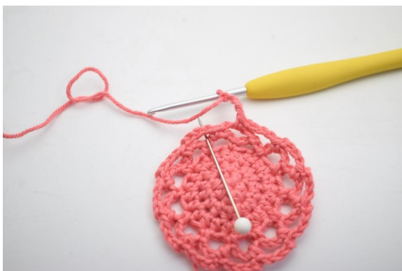
20. "Faire 4 ml, faire 1 ms dans l'espace de ml suivant"