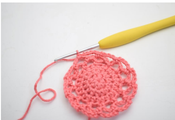
21. Comme ceci.