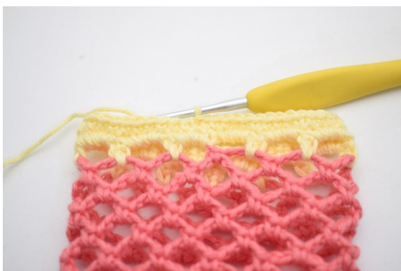
30. Faire 1 ml et faire des ms dans chaque m tout le tour. Finir avec 1 mc. (48)