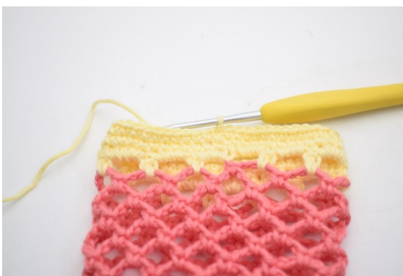
31. Faire 1 ml et faire des ms dans chaque m tout le tour. Finir avec 1 mc. (48)