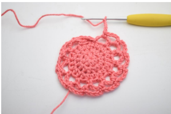
17. Répéter de " à " jusqu'à la fin du tour.